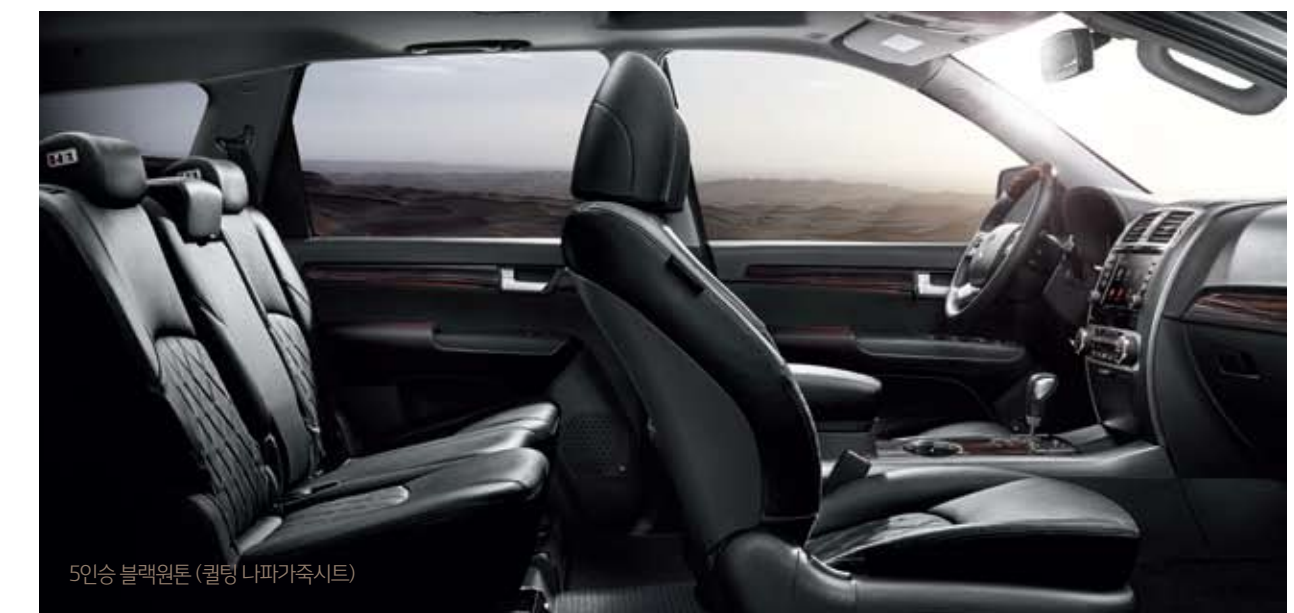
5인승 블랙원톤 (퀼팅 나파가죽시트)

※가죽 시트는 가죽 및 인조가죽이 혼용되어 있습니다. ※ 상기 사양구성은 차급 및 선택 사양에 따라 다르게 적용됩니다.