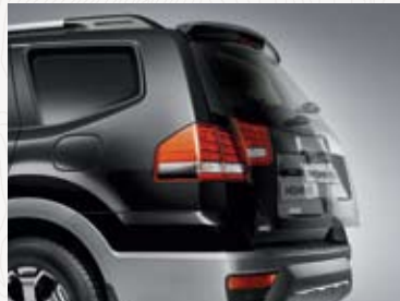
자동잠김 테일게이트 *