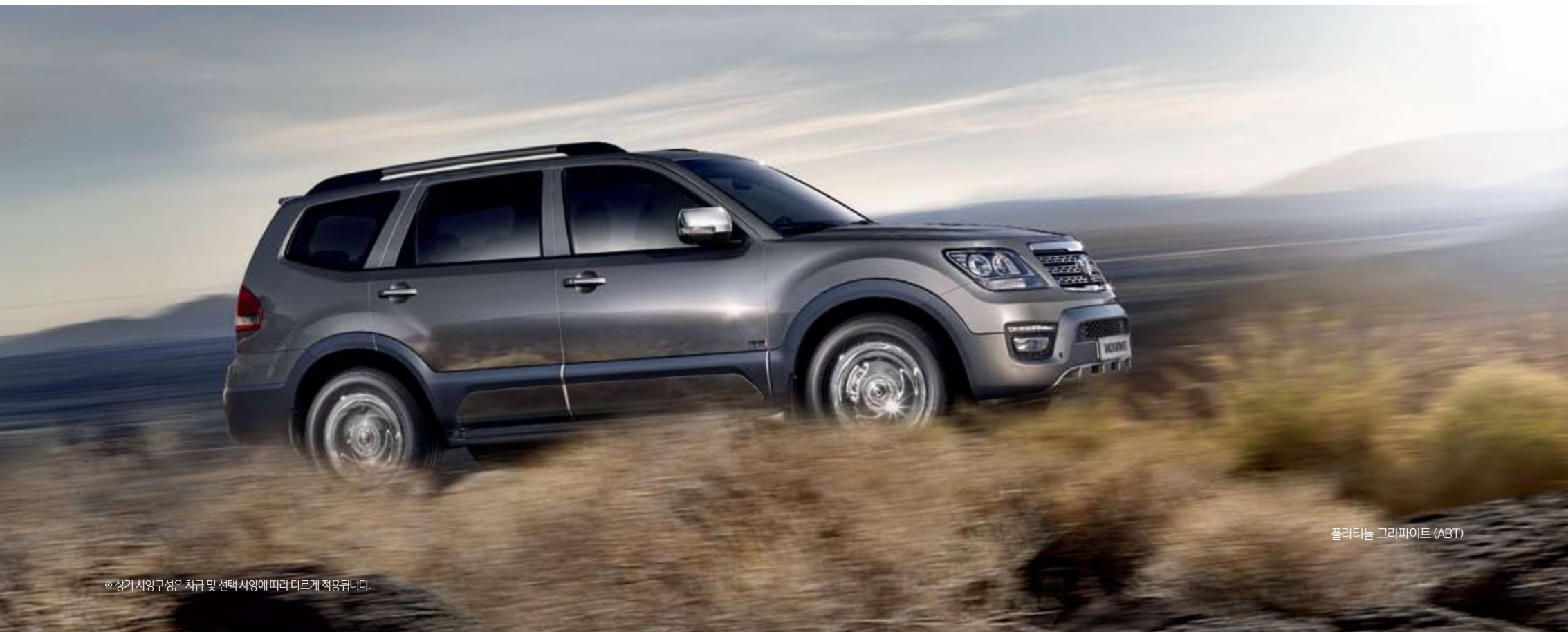
플라티늄 그라파이트 (ABT)