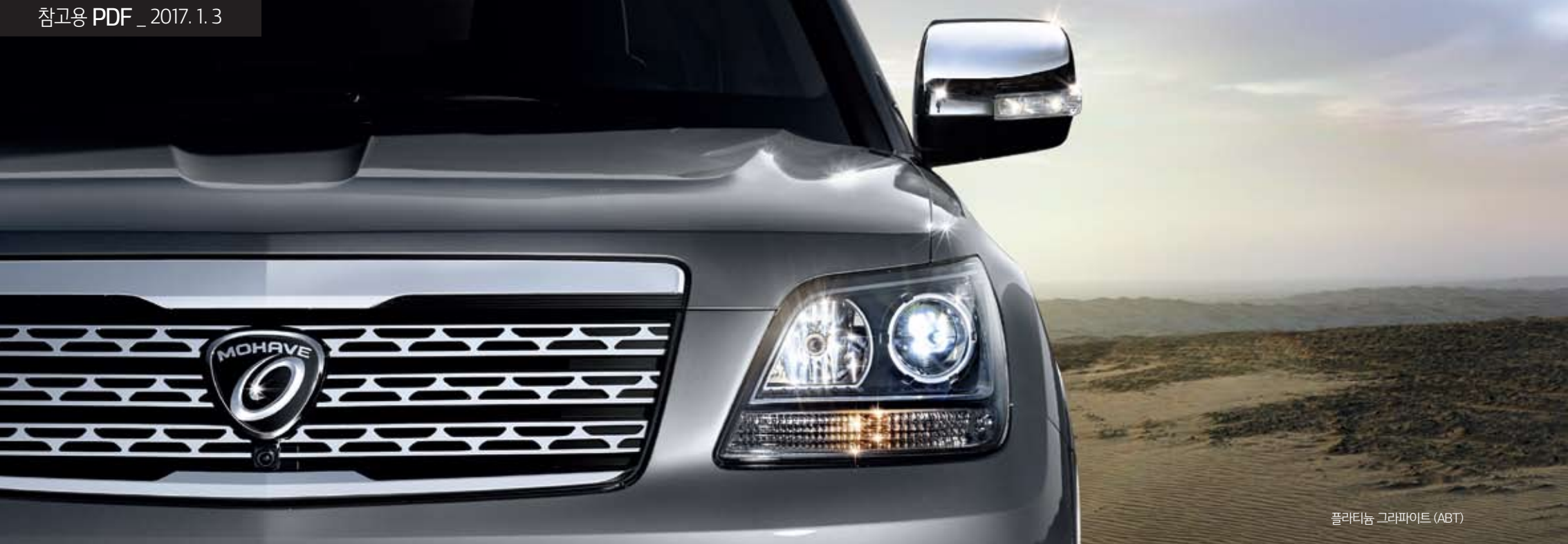
플라티늄 그라파이트 (ABT)