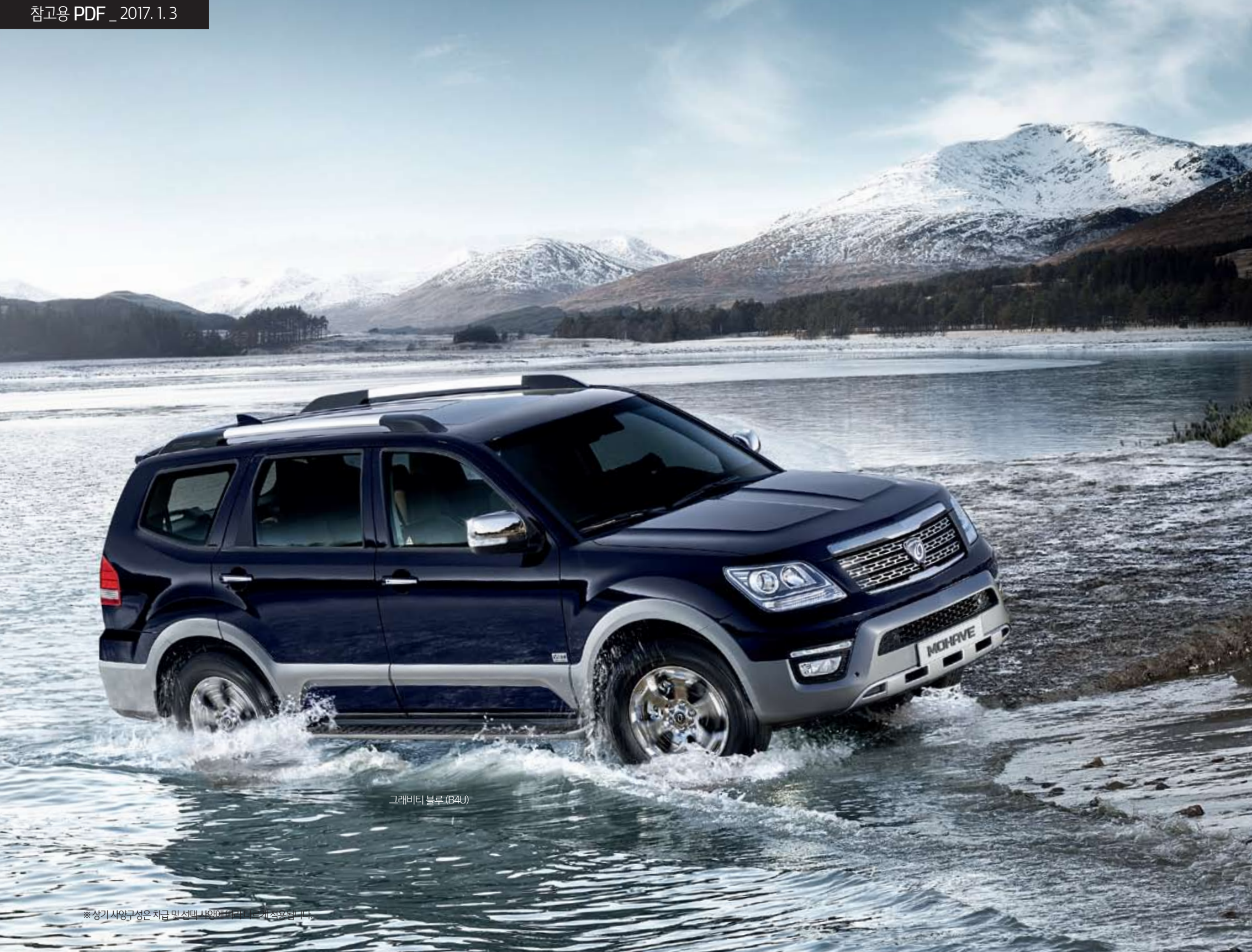
그래비티 블루 (B4U)