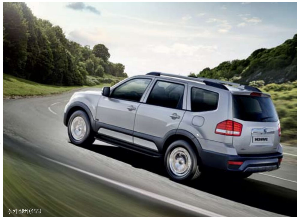
실키 실버 (4SS)