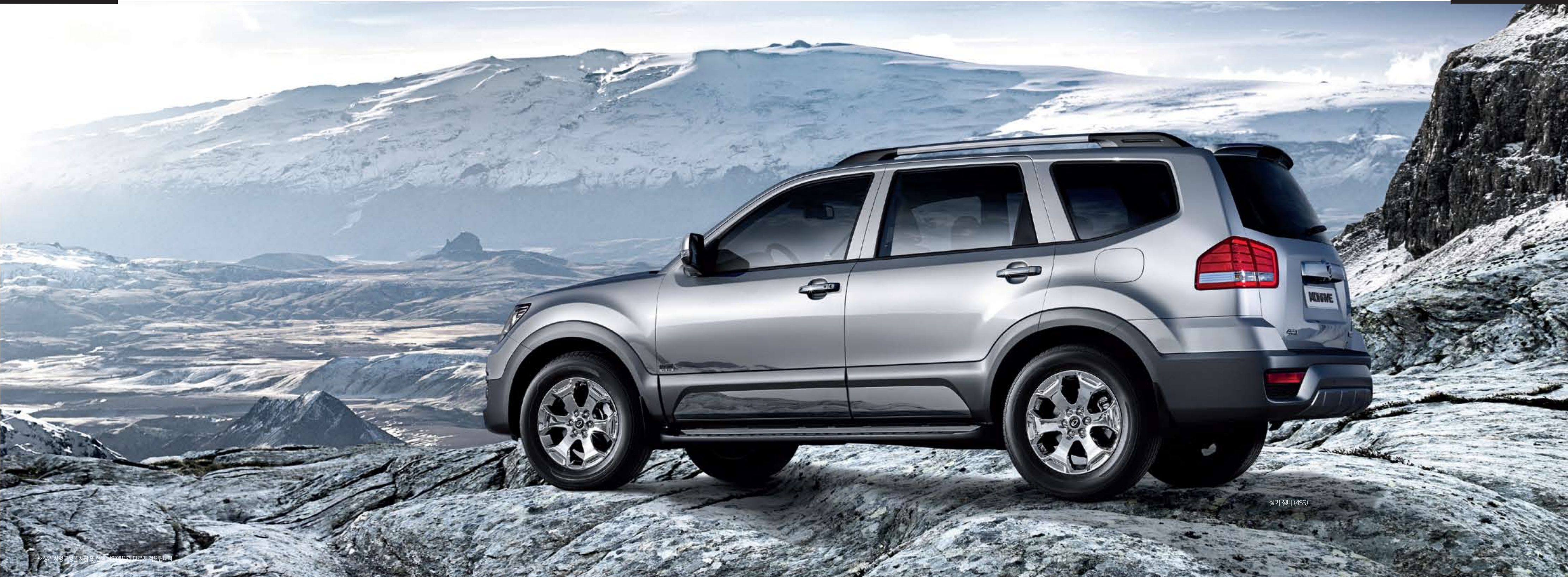
실키 실버 (4SS)