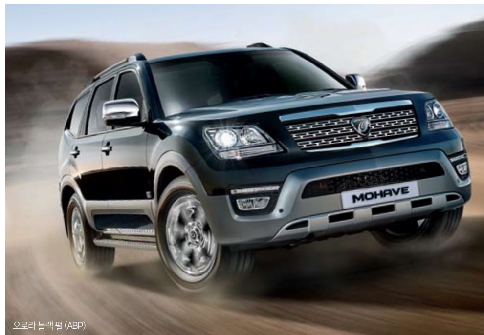
오로라 블랙 펄 (ABP)