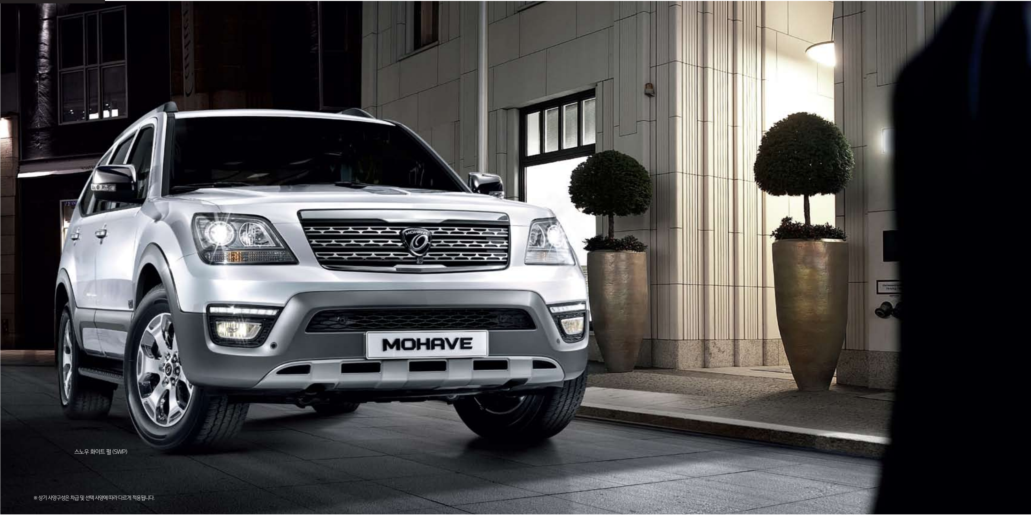
스노우 화이트 펄 (SWP)