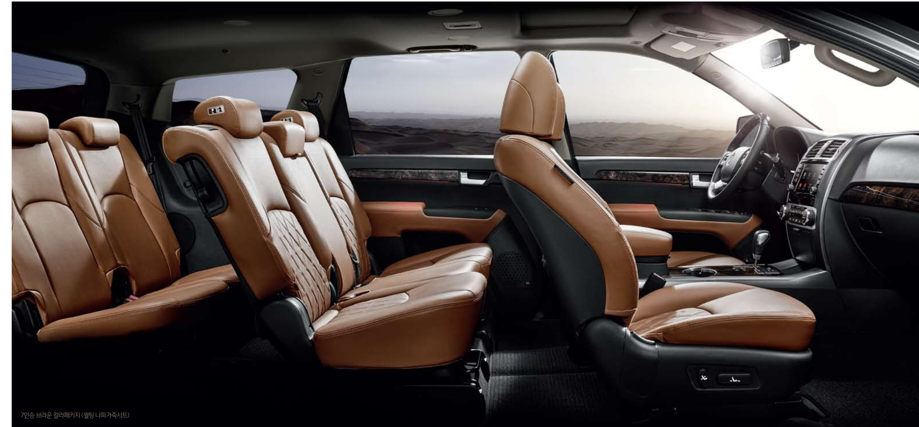
7인승 브라운 칼라패키지 (퀼팅 나파가죽시트)

※가죽 시트는 가죽 및 인조가죽이 혼용되어 있습니다. ※ 상기 사양구성은 차급 및 선택 사양에 따라 다르게 적용됩니다.