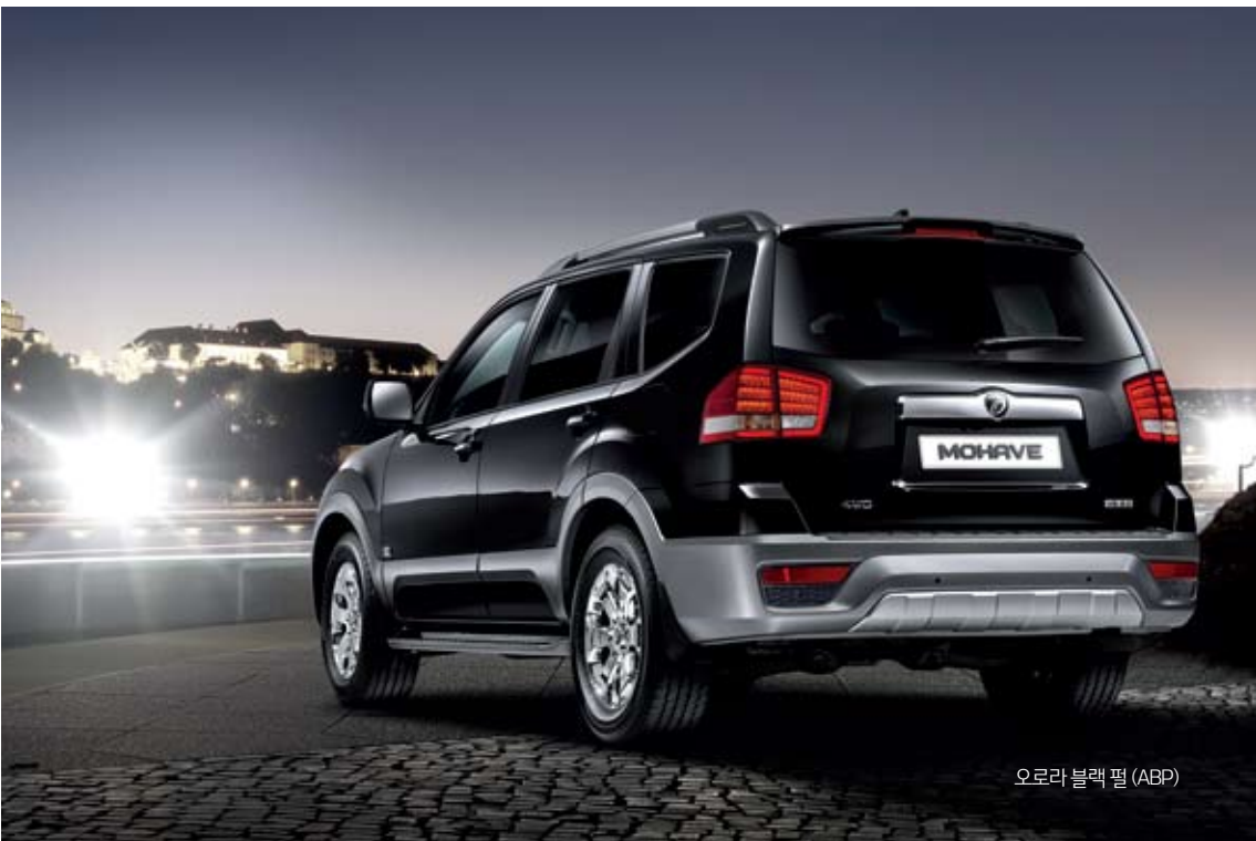
오로라 블랙 펄 (ABP)

외적인 강인함만큼이나 업그레이드 된 새로움, 깊이가 다른 정교함까지 더해져 더 모하비다운 모하비가 되다