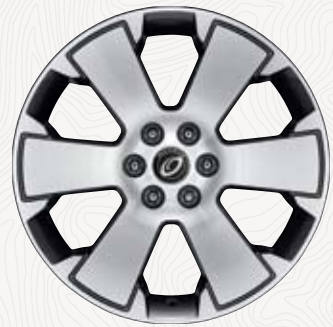
18인치 전면가공 알로이 휠