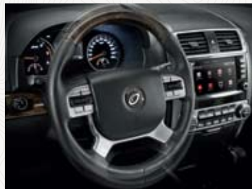
전동식 틸트 & 텔레스코픽 스티어링 휠*