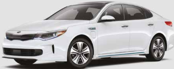
Blanc neige nacré