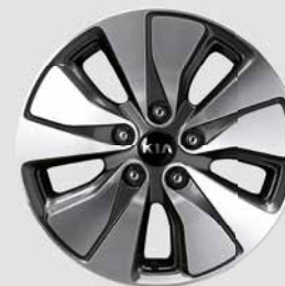
Jantes en alliage de 16 po