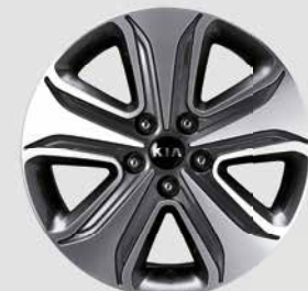
Jantes en alliage de 17 po