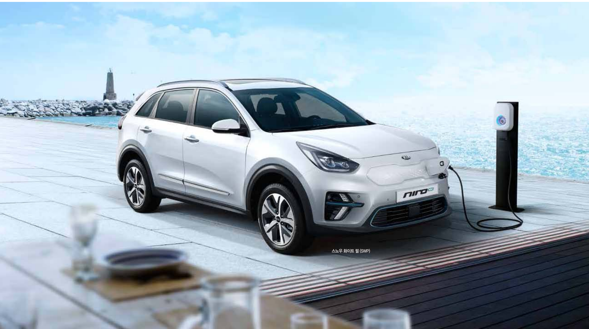
스노우 화이트 펠 (SWP)

대용량 배터리와 최적화된 전기자동차 특화기술 등 기술의 진보로 가능해진 효율적이고 즐거운 드라이빙을 경험할 수 있습니다.