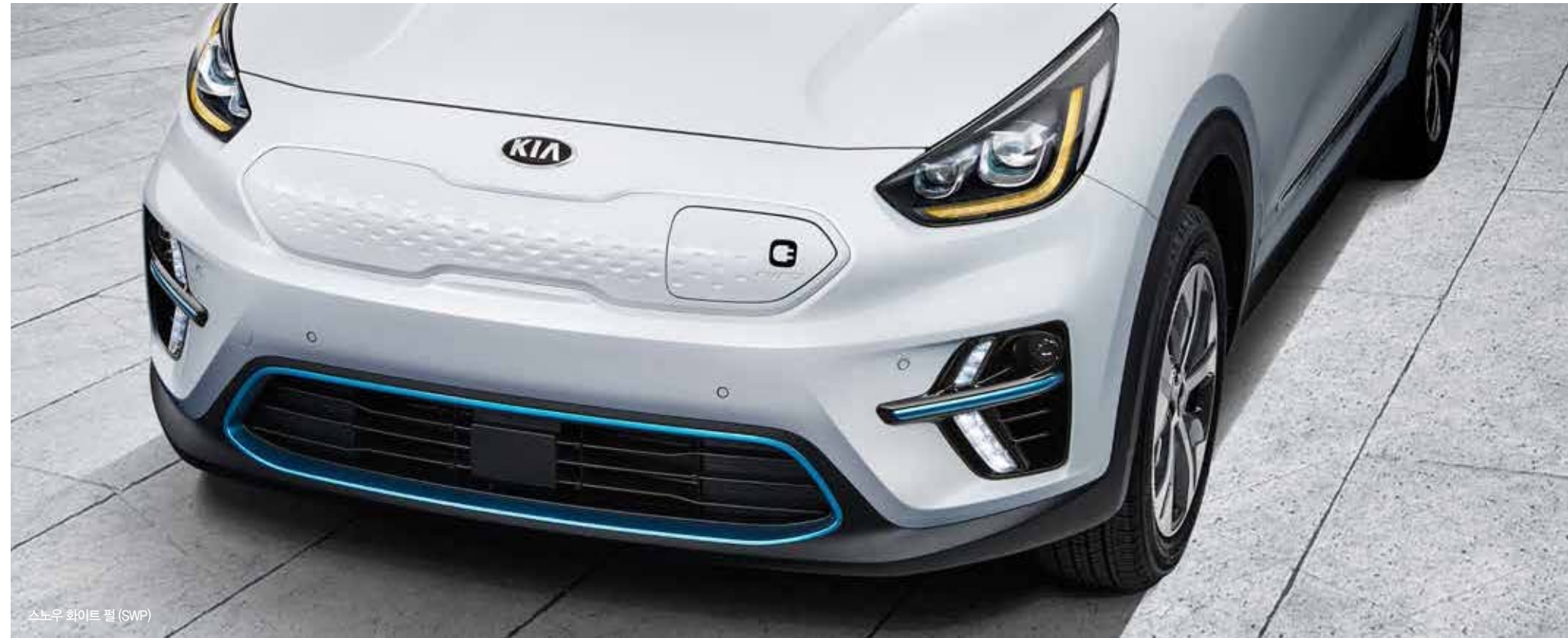
스노우 화이트 필 (SWP)

기하학적 패턴의 라디에이터 그릴, 감각적 디자인의 LED DRL, 하이테크 감성의 LED 헤드램프와 전용 휠 등 니로 EV만의 진보적이고 독창적인 스타일로 탄생했습니다.