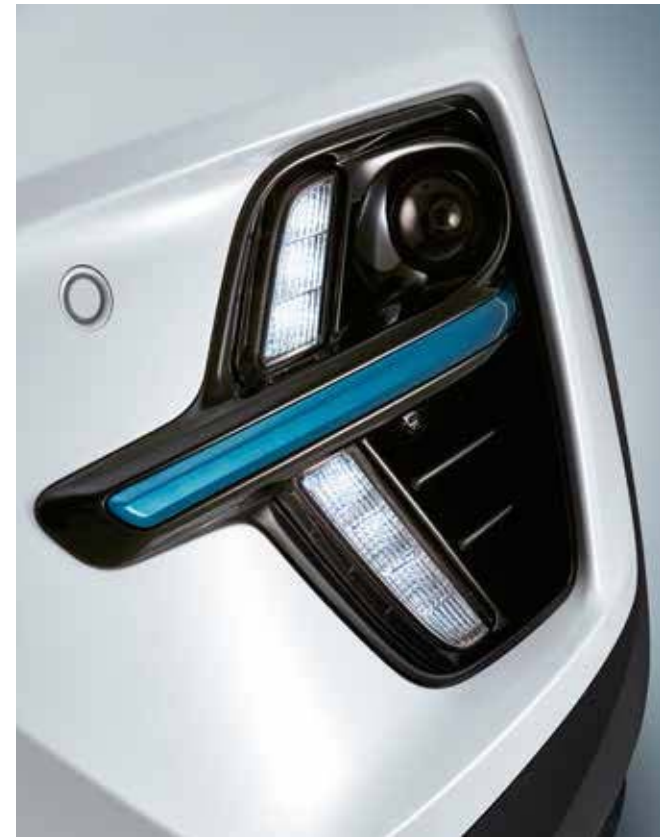
LED DRL & 프로젝션 타입 안개등