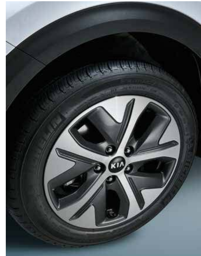
니로 EV 전용 17인치 알루미늄