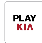
블로그 PLAY KIA