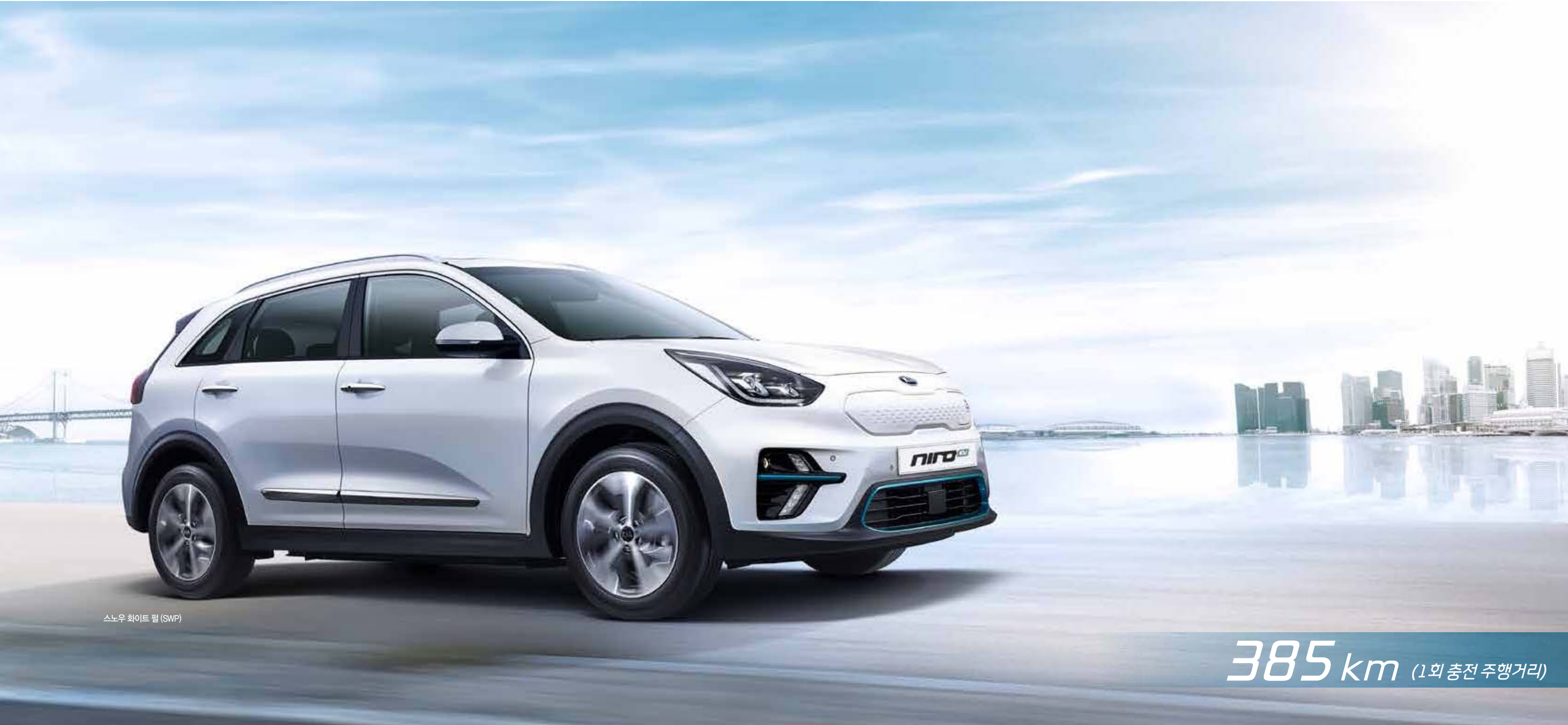
스노우 화이트 펄 (SWP)