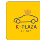
카카오 소통채널 K-PLAZA / King Car