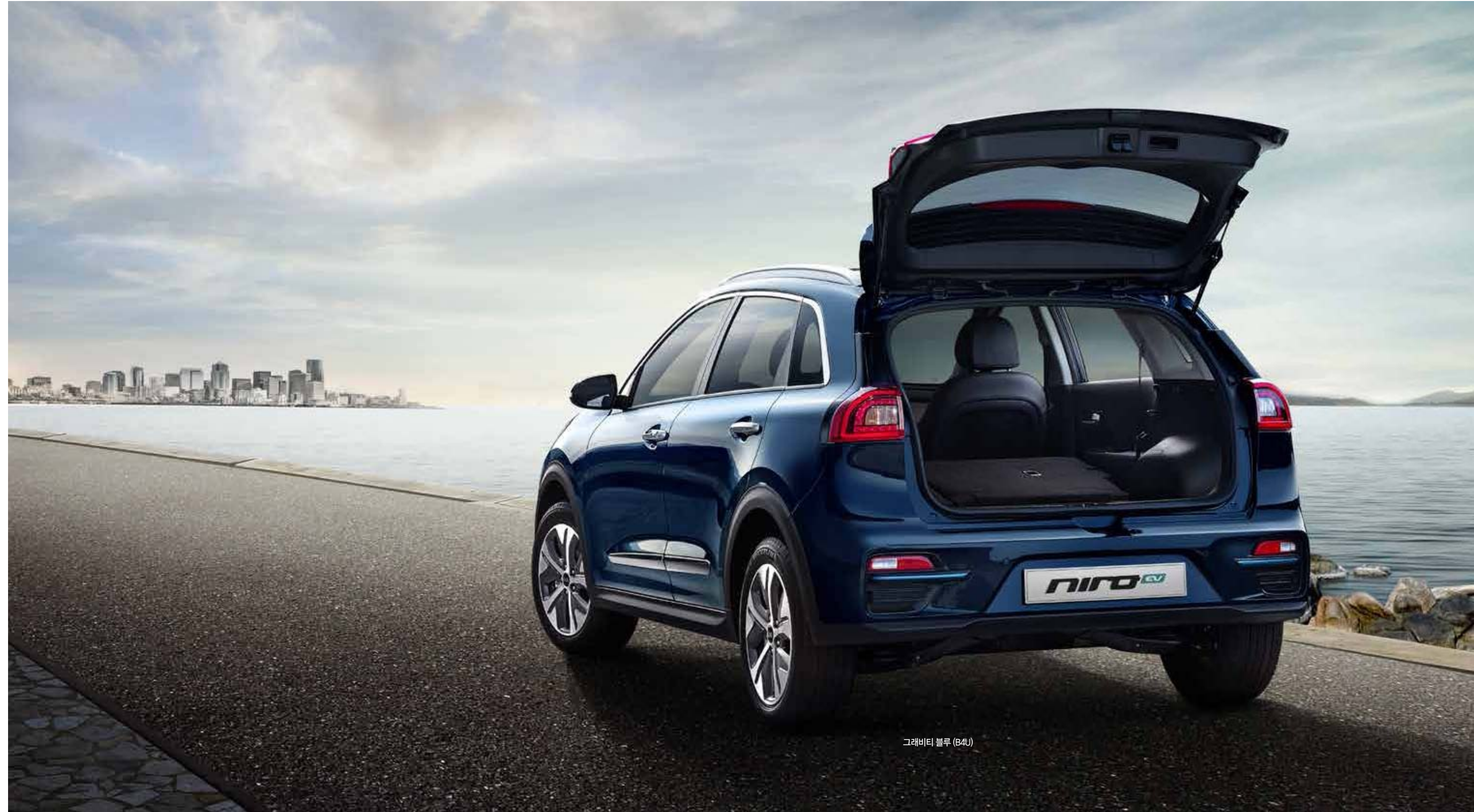
그레비티 블루 (B4U)