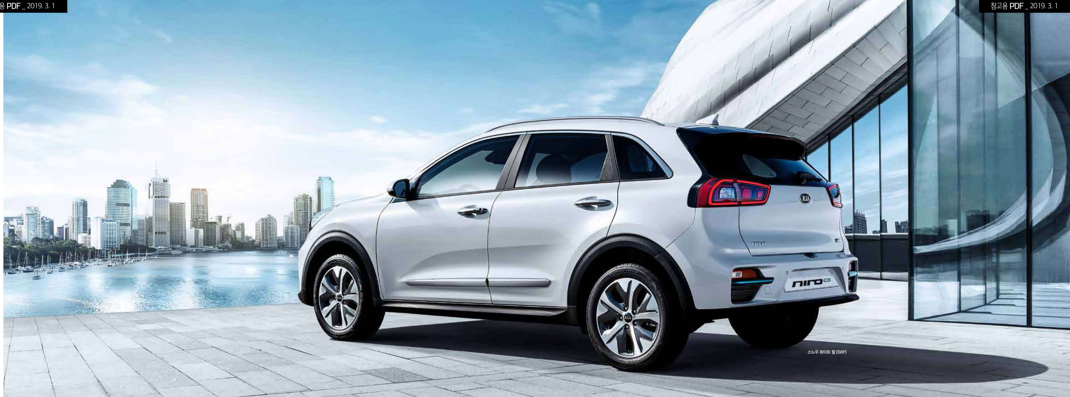
스노우 화이트 펄 (SWP)