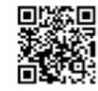
NIRO EV 가격표 다운로드