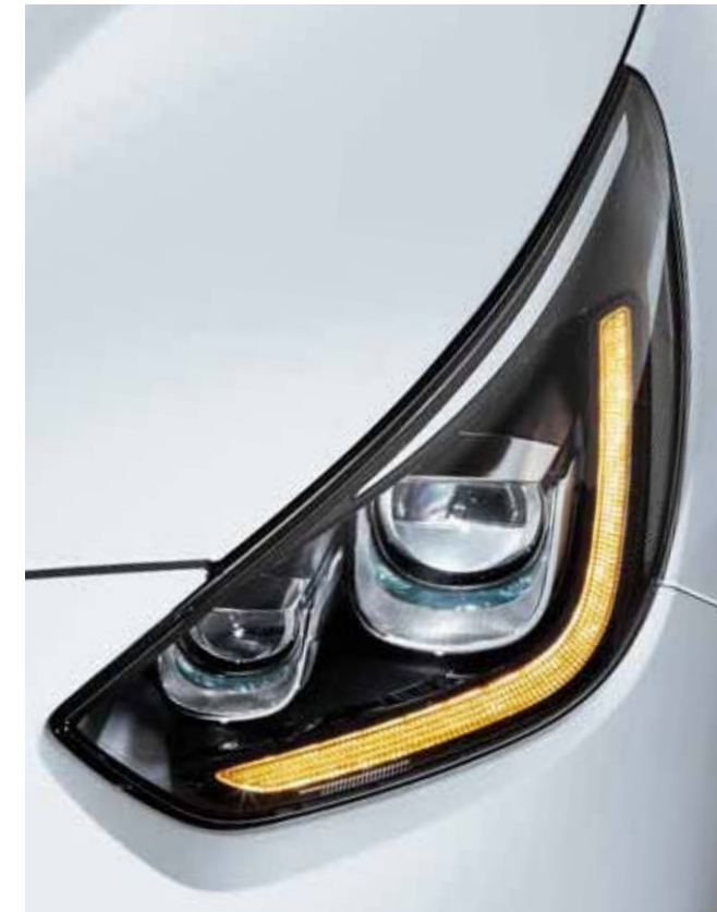
LED 헤드램프 & LED 턴시그널