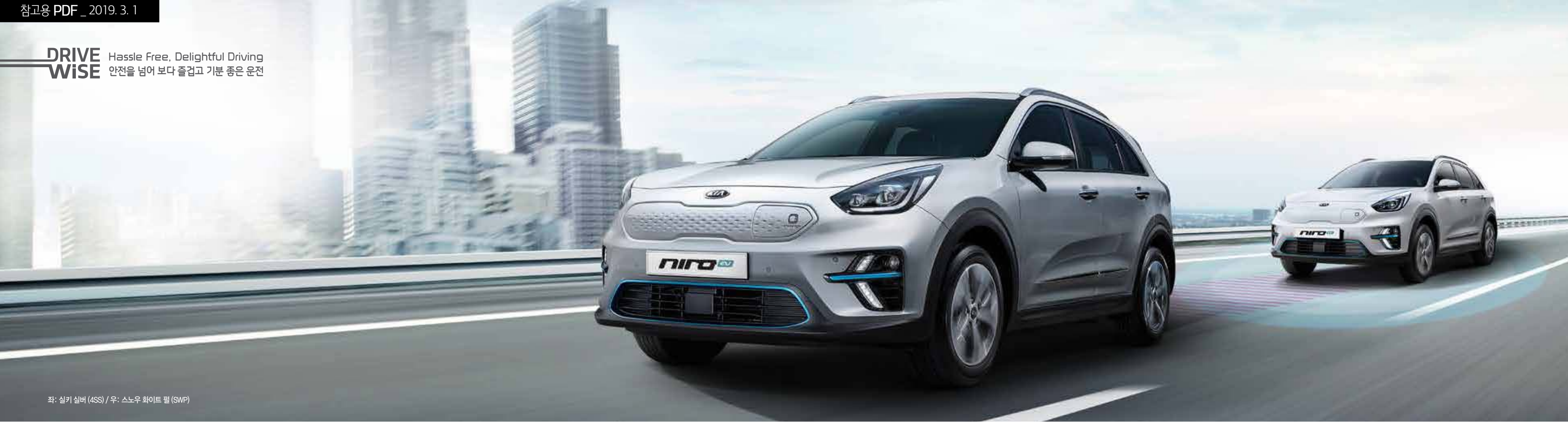
좌: 실키 실버 (4SS) / 우: 스노우 화이트 펄 (SWP)

DRIVE WISE Hassle Free, Delightful Driving 안전을 넘어 보다 즐겁고 기분 좋은 운전