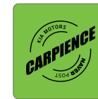
네이버 포스트 카피엔스