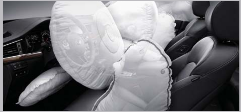
9 에어백* 충돌 시 탑승자의 측면을 보호하는 전복감지 사이드 & 커튼 에어백을 적용하여 더욱 안전한 드라이빙을 제공해 드립니다. ※ 전복감지 사이드 & 커튼 에어백은 옵션 적용

운전자를 위한 무릎 에어백과 개별 타이어 공기압 경보 시스템까지, K7 택시에게 있어 안전은 가장 먼저 고려되어야 할 기본입니다.