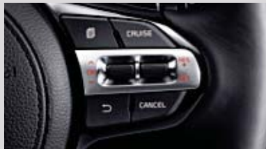
크루즈 컨트롤 (정속주행장치)