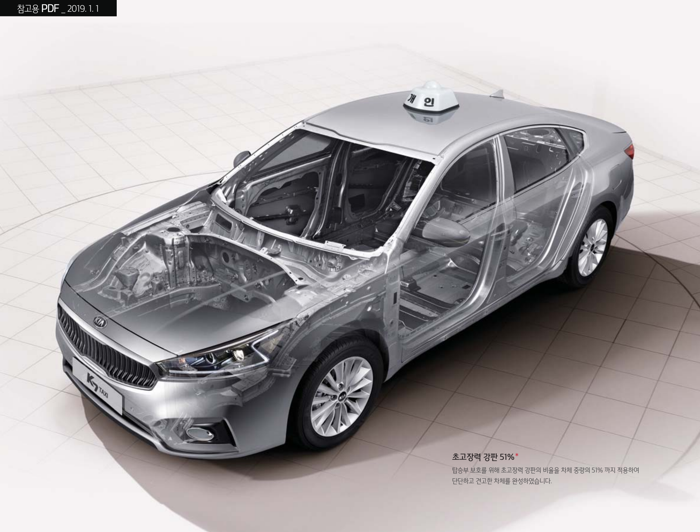
초고장력 강판 51%* 탑승부 보호를 위해 초고장력 강판의 비율을 차체 중량의 51% 까지 적용하여 단단하고 견고한 차체를 완성하였습니다.