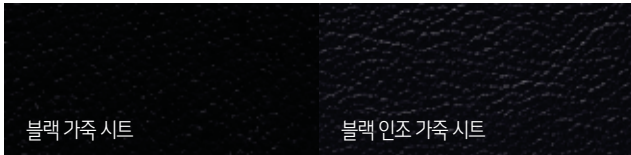
블랙 원톤 인테리어