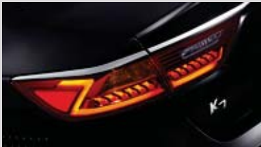
LED 리어 콤비네이션 램프