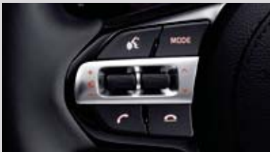
스티어링휠 오디오 리모컨