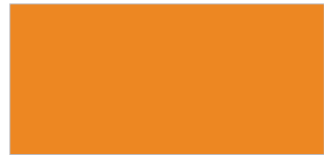
꽃담 황토색 (BHY)