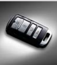
버튼시동 스마트 키