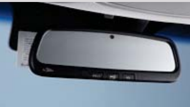
자동 요금정수 시스템 (ETCS)