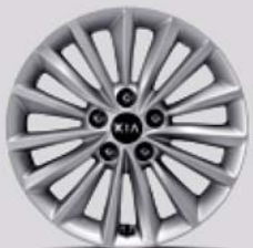
17인치 알로이 휠