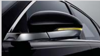
LED 리피터 일체형 아웃사이드 미러