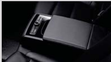
뒷좌석 다기능 센터 암레스트

※에는 이해를 돕기 위한 가상 이미지가 사용되었습니다. / 상기 사양구성은 트림 및 선택 사양에 따라 다르게 적용됩니다.