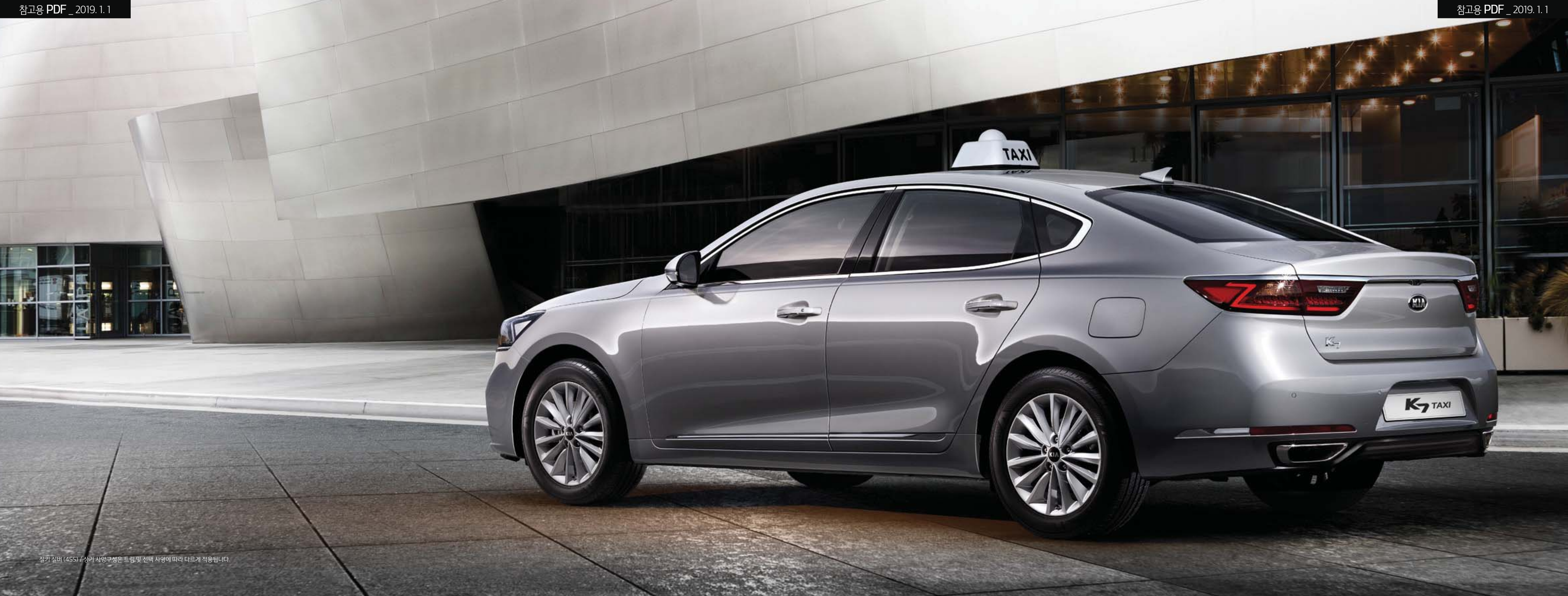
실키 실버 (4SS) / 상기 사양구성은 트림 및 선택 사양에 따라 다르게 적용됩니다.