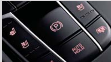
전자식 파킹 브레이크 (EPB)