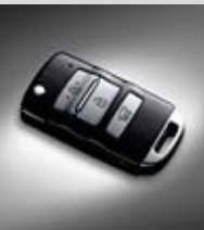
폴딩타입 무선도어 리모컨 키