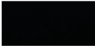
오로라 블랙 펄 (ABP)