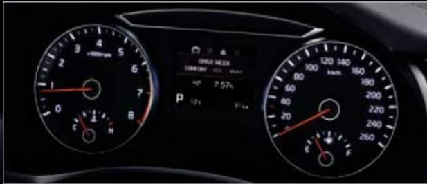
고급형 클러스터 (3.5인치 mono TFT LCD) 세련된 디자인과 그래픽으로 다양한 정보를 제공합니다.