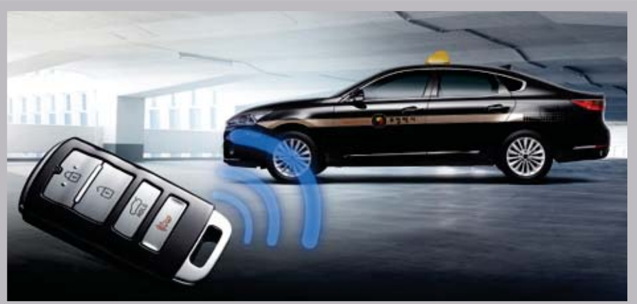
LPI 시동 대기 시간 단축 시스템 (LSTR)* 폴딩 키 또는 스마트 키 연락( ) 버튼 2회 작동 시 연료펌프를 미리 구동시켜, LPI 시동 대기 시간 단축으로 가솔린 엔진 수준의 시동성을 확보합니다. ※ 배터리 방전 방지를 위해 연락 버튼 1회 작동 시에는 (단순 도어 오픈으로 가정) LSTR 미작동

운전의 집중력을 흐트리지 않는 고급형 클러스터, 겨울 이른 시간에도 따뜻함을 전할 히티드 스티어링 휠, 8인치 내비게이션, 독립제어 풀오토 에어컨까지... 운전자의 편안함을 위한 세심한 배려가 깃들어 있습니다.