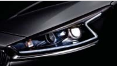
프로젝션 헤드램프 & LED DRL