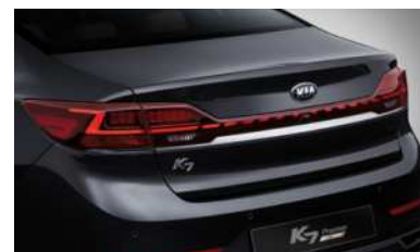
LED 리어 콤비네이션 램프