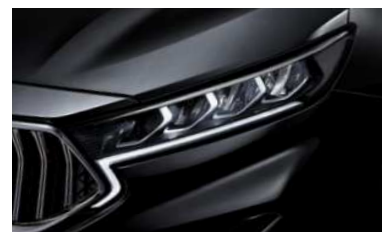
LED 헤드램프 & LED DRL