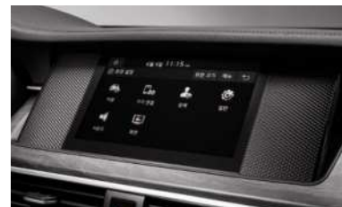
8인치 디스플레이 오디오