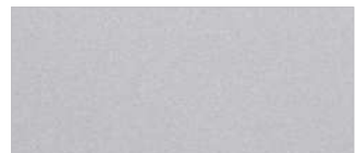
실키 실버 (4SS)