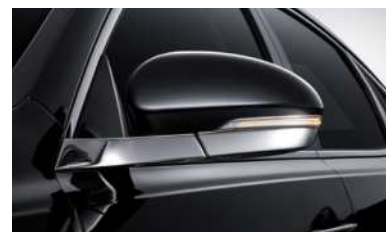
LED 리피터 일체형 크롬 아웃사이드 미러