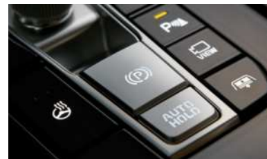
전자식 파킹 브레이크 (EPB)