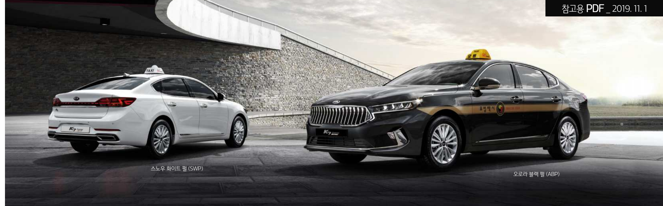
스노우 화이트 펄 (SWP)

*에는 이해를 돕기 위한 가상 이미지가 사용되었습니다. / 상기 사양구성은 트림 및 선택 사양에 따라 다르게 적용됩니다.