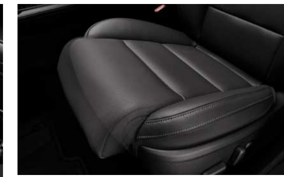
운전석 4WAY 전동식 허리지지대