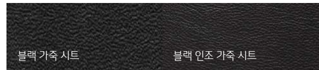
블랙 가죽 시트