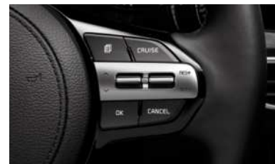
크루즈 컨트롤 (정속주행장치)