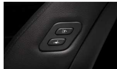
동승석 워크인 디바이스