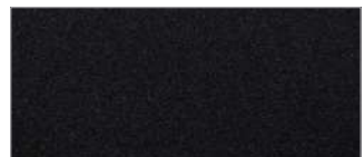
오로라 블랙 펄 (ABP)