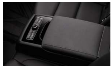
뒷좌석 다기능 센터 암레스트

*에는 이해를 돕기 위한 가상 이미지가 사용되었습니다. / 상기 사양구성은 트림 및 선택 사양에 따라 다르게 적용됩니다.