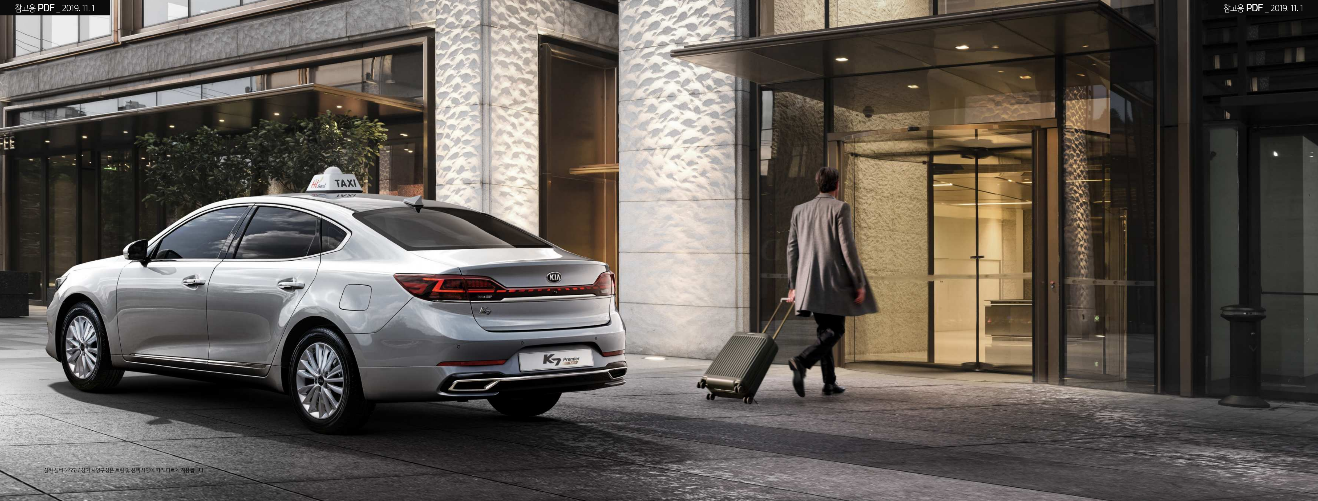
실차 실버 (4SS) / 상기 사양구성은 트림 및 선택 사양에 따라 다르게 적용됩니다.