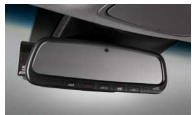
자동 요금징수 시스템 (ETCS)