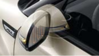
전동접이 아웃사이드 미러 (오토폴딩 기능) *