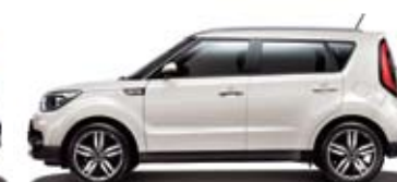
뉴 바닐라 셰이크