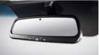
전자식 룸미러 & 자동요금장수시스템 (ECM & ETCS) * 장에인 등 통행료 자동 할인 기능 미적용