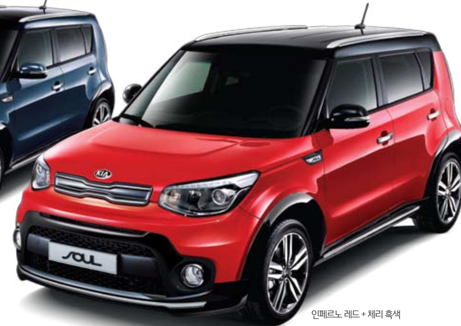
인페르노 레드 + 체리 흑색