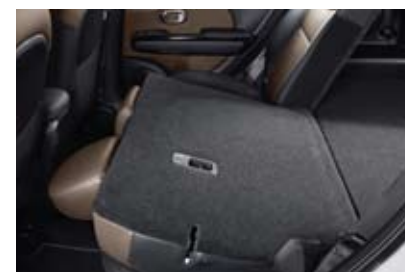
뒷자석 6:4 분할 폴딩시트