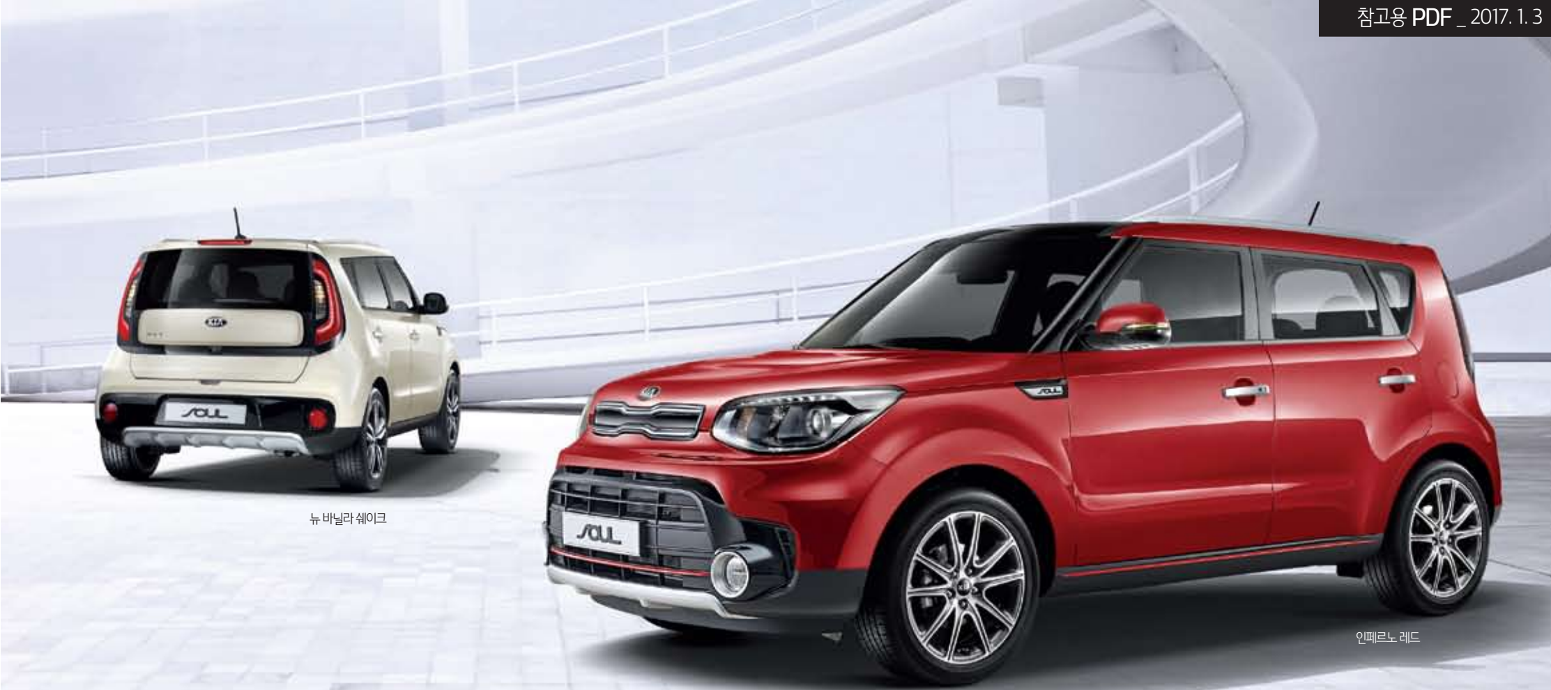
뉴 바닐라 셰이크

* 상기 사양구성은 차급, 차종 및 선택 사양에 따라 다르게 적용됩니다. * 예는 이해를 돕기 위한 가상 이미지가 사용되었습니다.