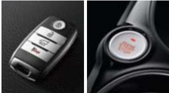
버튼시동 스마트키 시스템