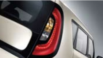
LED 리어 콤비네이션 램프