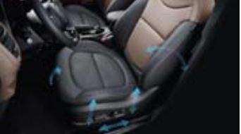
운전석 파워시트 & 전동식 허리지지대 *