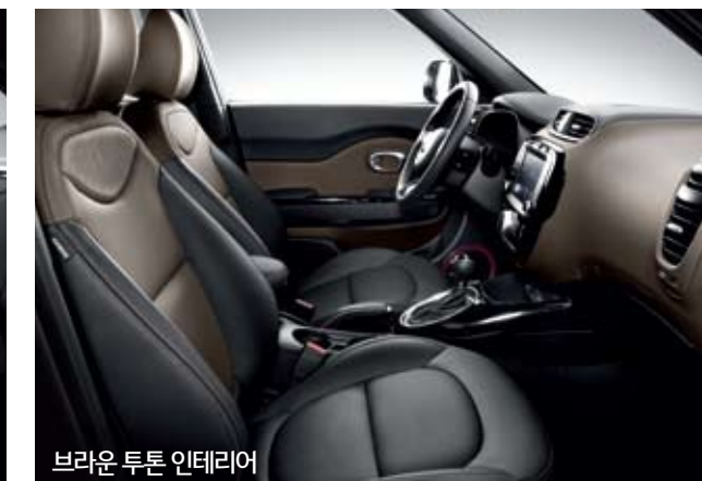
브라운 투톤 인테리어