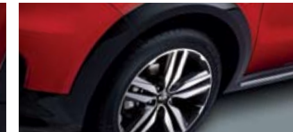
휠 아치 가니쉬

※ 상기 사양구성은 차급, 차종 및 선택 사양에 따라 다르게 적용됩니다.