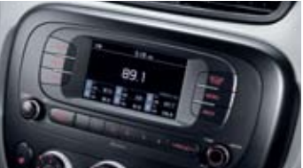
MP3 오디오 * CDP 미적용