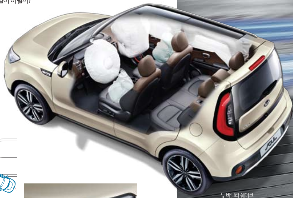
뉴 바닐라 웨이크

전방 시계성 확보를 위한 HID 헤드램프와 주간 사고예방을 위한 안전 등화장치인 LED DRL을 적용하였습니다.