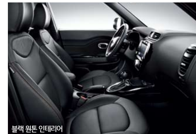
블랙 원톤 인테리어