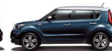
미스테리어스 블루 + 순백색

※ 상기 사양구성은 차급, 차종 및 선택 사양에 따라 다르게 적용됩니다.