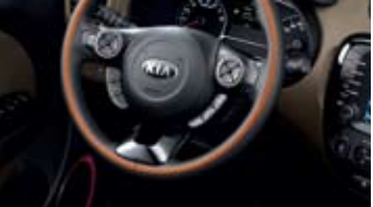
히팅드 스티어링 휠 *