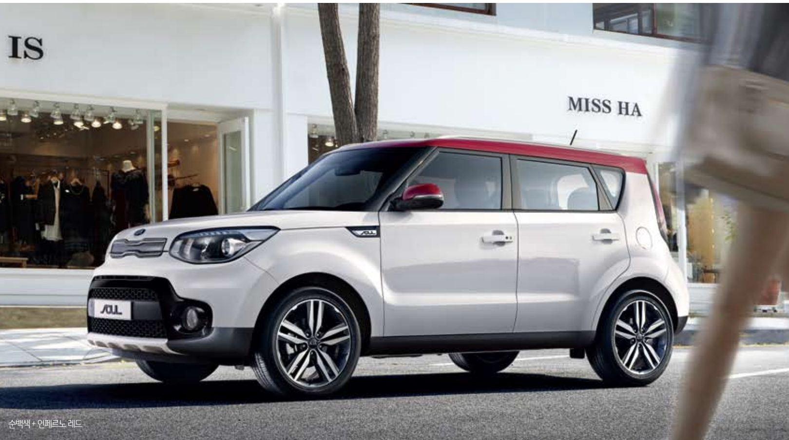
순백색 + 인페르노 레드

이성과 감성 모두를 만족시키는 것, 차가 줄 수 있는 가장 빛나는 가치가 아닐까?