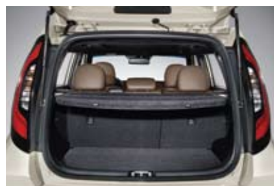
러기지 커버링 셸프