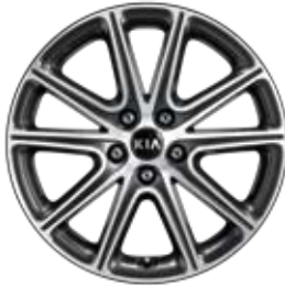
18인치 알로이 휠 (스타일업 패키지 전용)