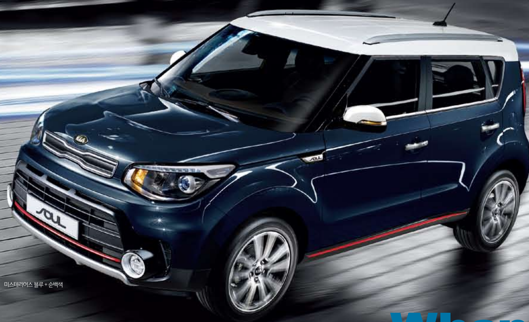
미스터리어스 블루 + 순백색