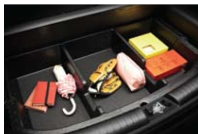
러기지 언더 트레이

※ 상기 사양구성은 차급, 차종 및 선택 사양에 따라 다르게 적용됩니다.