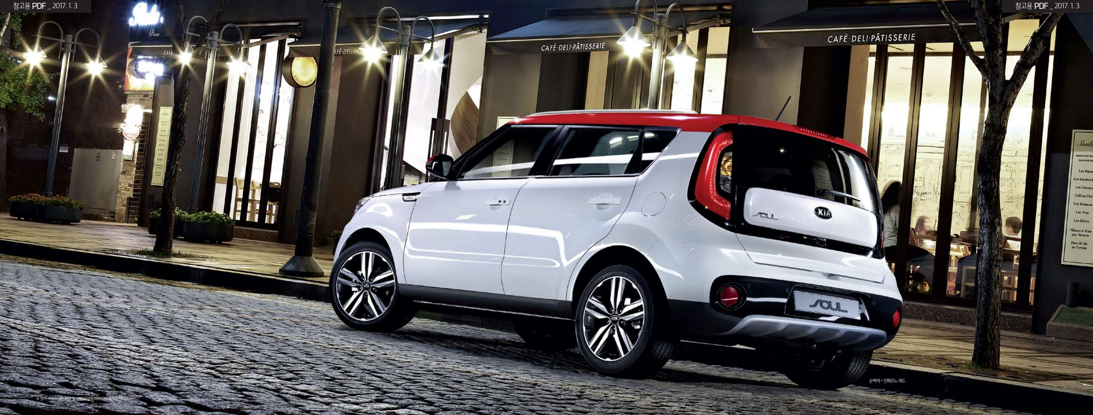
순백색 + 인페르노 레드