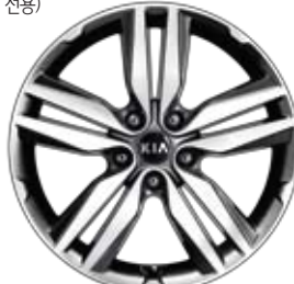
18인치 알로이 휠