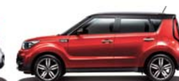
인페르노 레드 + 체리 흑색