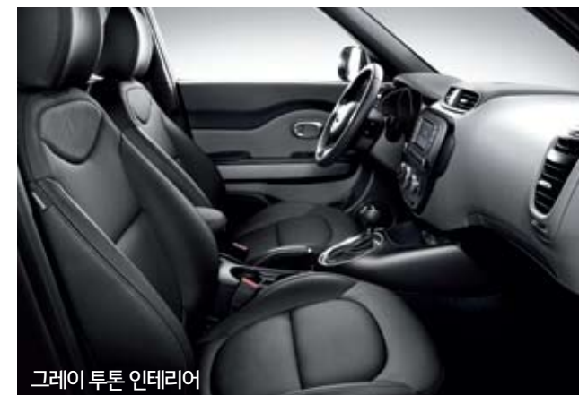
그레이 투톤 인테리어

진정한 나다움은 안에서 우러나는 것! 디테일이 다른 칼라 콤비네이션으로 속부터 다른 감각을 표현한다.