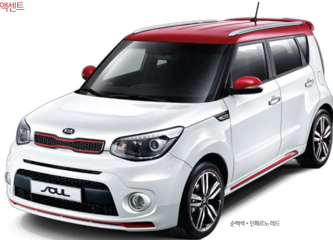
순백색 + 인페르노 레드