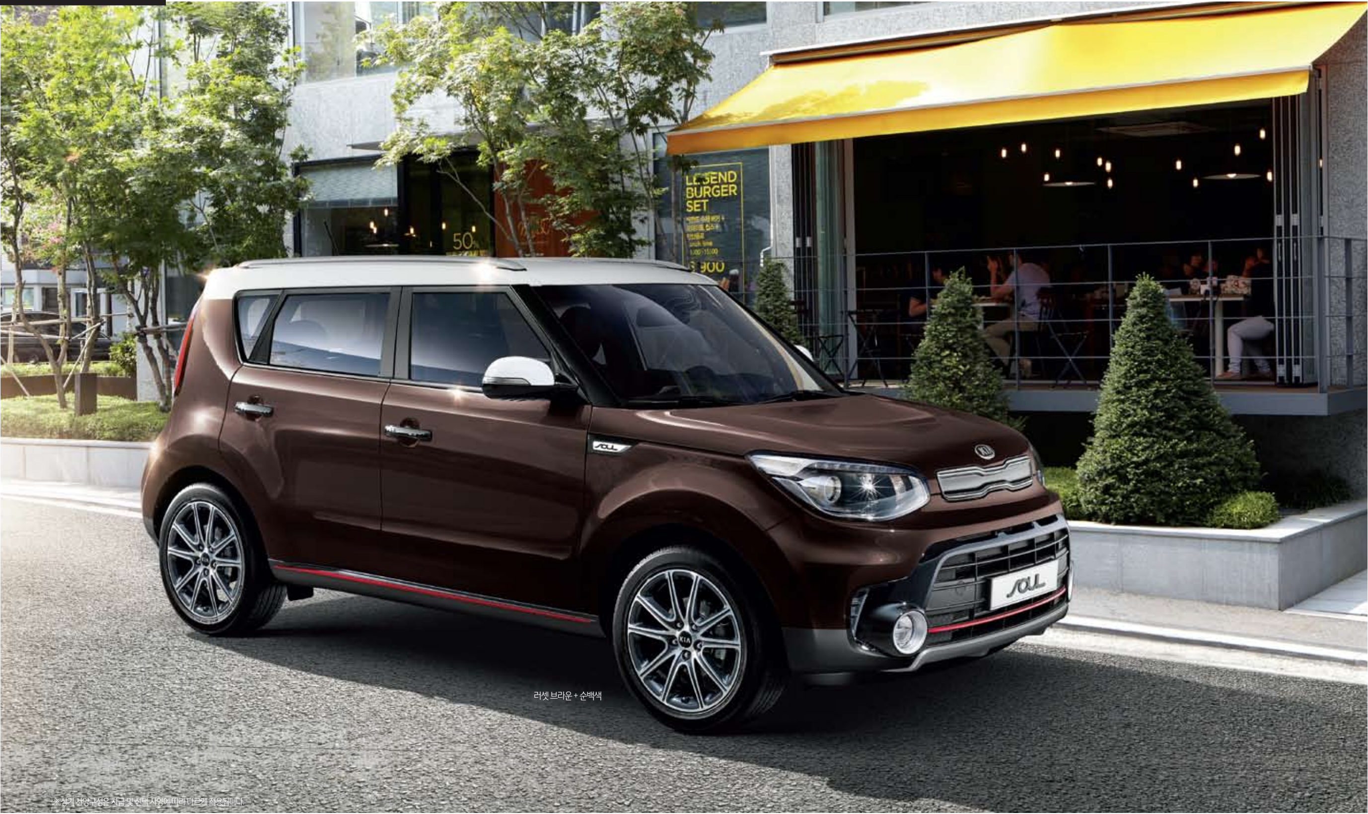
러셋 브라운 + 순백색