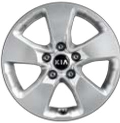
16인치 알로이 휠