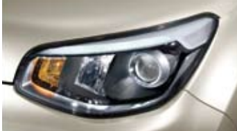
프로젝션 헤드램프 & LED 포지셔닝 램프