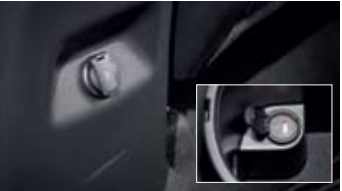
2열 USB 단자 (센터콘솔 후면/내부)