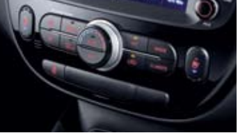
풀 오토 에어컨