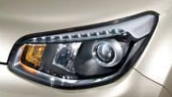
HID 헤드램프 & LED DRL