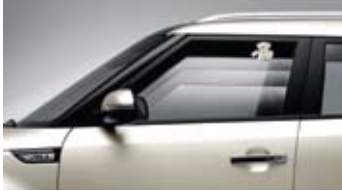
운전석 세이프티 파워윈도우 *