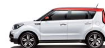
순백색 + 인페르노 레드