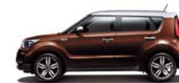
러셋 브라운 + 순백색