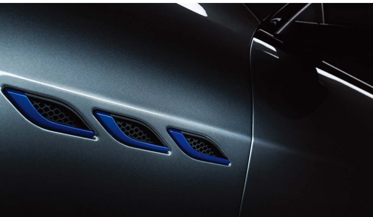
ギブリ ハイブリッド - サイドエアベント