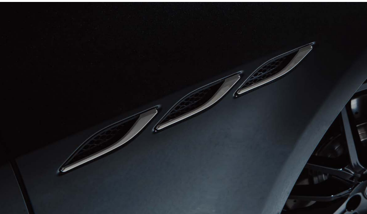
ギブリ - サイドエアベント