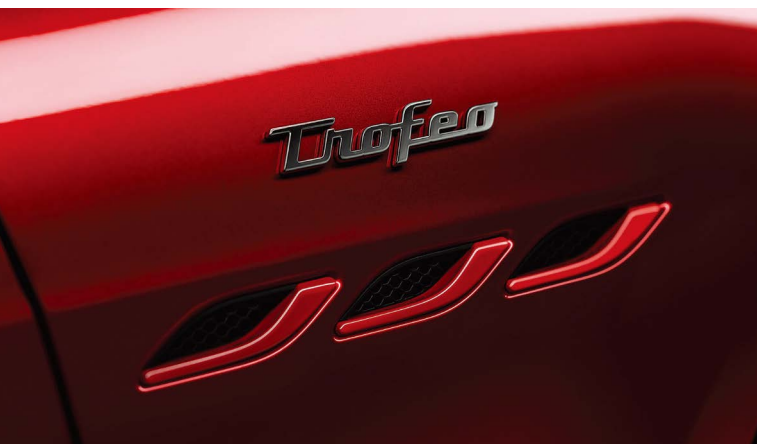
ギブリ トロフェオ - サイドエアベントとトロフェオバッジ