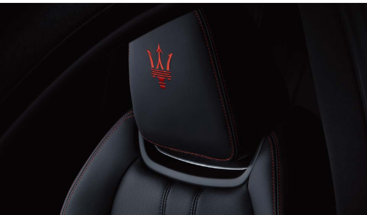
ギブリ - ヘッドレスト