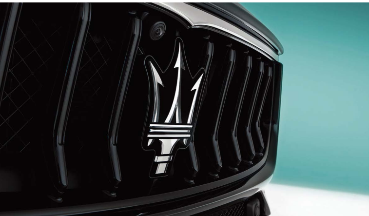
ギブリ - フロントグリル