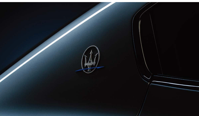
ギブリ ハイブリッド - マセラティを象徴するCピラーのサエッタロゴ