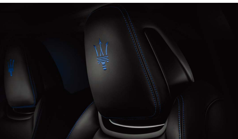
ギブリ ハイブリッド - ヘッドレスト