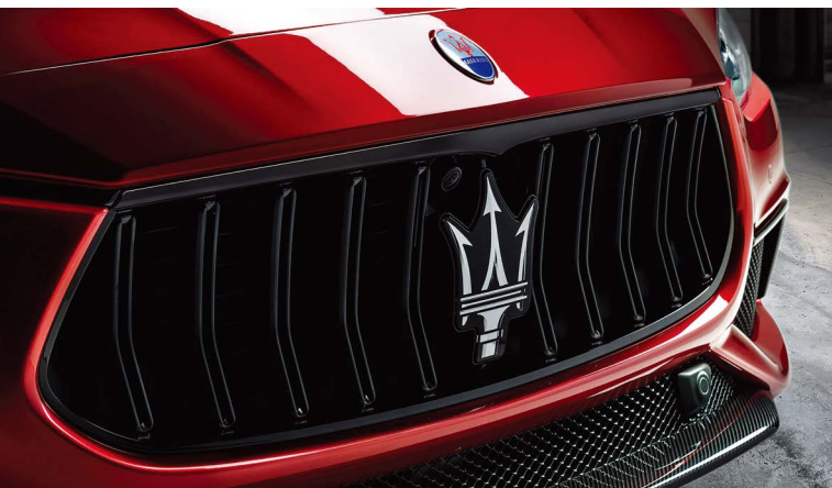
ギブリ トロフェオ - フロントグリル