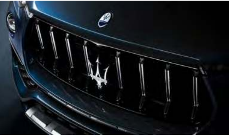
新Levante GT锋芒版 - 格栅

这台玛莎拉蒂SUV，不仅将性能和外观推向全新高度，更显著地提升了效率。独有的标志性声浪，在转瞬间为你迸发灵感、直抵内心盛境。新Levante GT锋芒版所配备的混动技术，为点燃你的肾上腺素而来，为开启你的大胆冒险而生。从此，天性无界，天地无边。玛莎拉蒂将以卓越的性能，带你劲驰无界的未来。新Levante GT锋芒版最高时速可达245公里/小时，百公里加速仅需6秒。轻度混合动力技术，彰显玛莎拉蒂的强劲动力。与拥有相同性能的可提供350马力的V6发动机相比，新Levante GT锋芒版的混合动力系统节省了18%的燃料消耗。