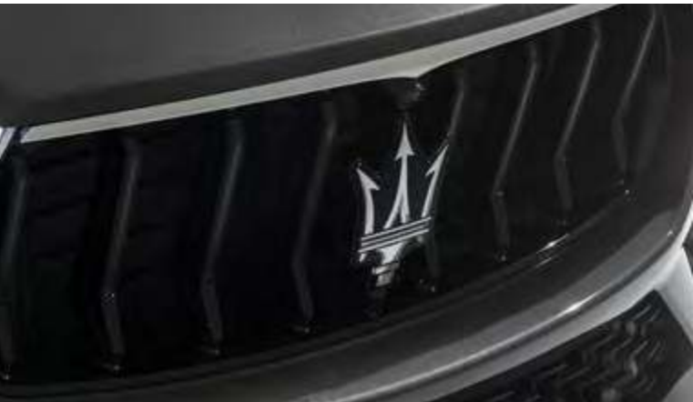
新Levante Modena - 格栅