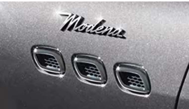
新Levante Modena - 侧通风口和Modena徽标