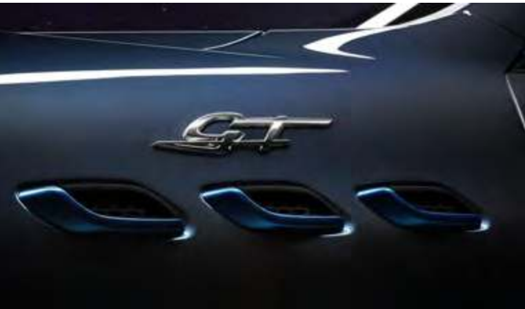
新Levante GT锋芒版 - 侧通风口和GT徽标