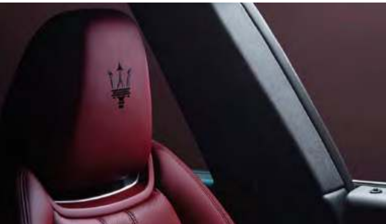
新Levante Modena - 座椅头枕细节