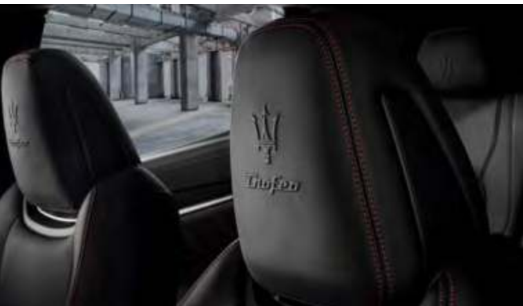
新Levante Trofeo - 座椅头枕细节