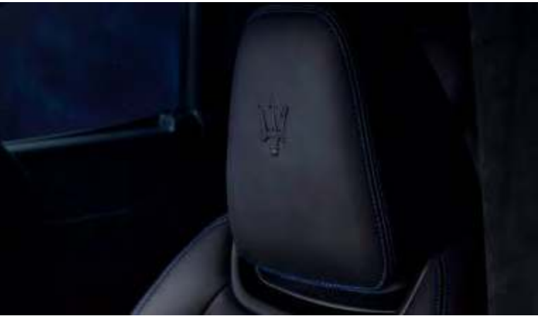
新Levante GT锋芒版 - 座椅头枕细节