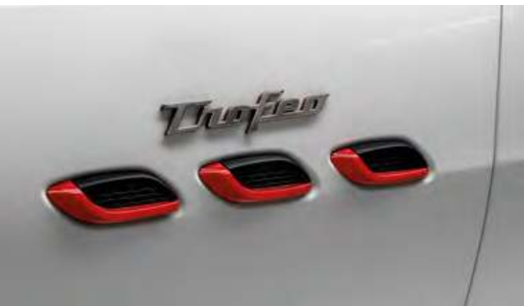
新Levante Trofeo - 侧通风口与Trofeo徽章