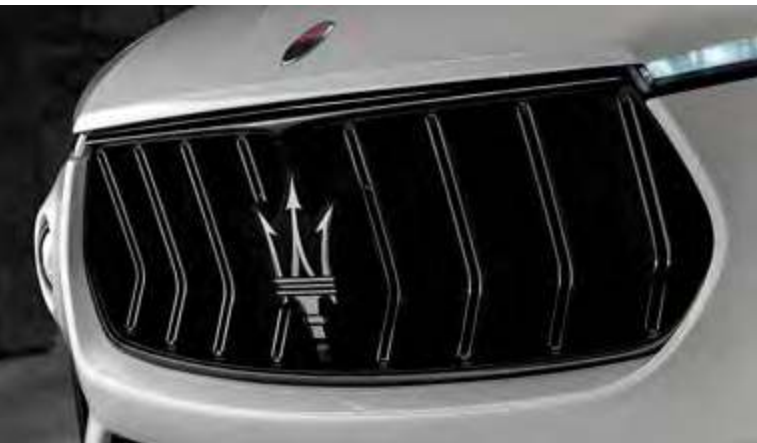
新Levante Trofeo - 格栅

新Levante Trofeo秉承了玛莎拉蒂的赛道激情，无论何种地形，都将带您纵情释放驾驶激情。