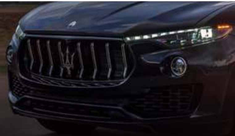
Levante GT Hybrid - Rejilla