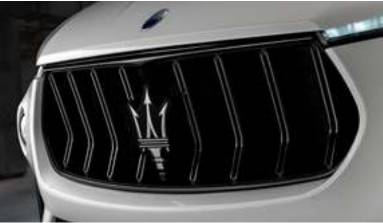
Levante Trofeo - Rejilla

Nacido de la pasión por la pista, Levante Trofeo se ha creado para maximizar las emociones , sin que importe el terreno.