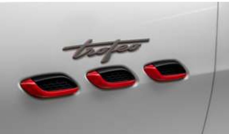
Levante Trofeo - Aperturas laterales y símbolo Trofeo