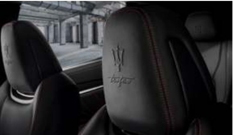
Levante Trofeo - Detalle del reposacabezas