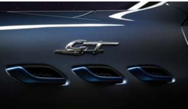
Levante GT Hybrid - Aperturas laterales y símbolo GT