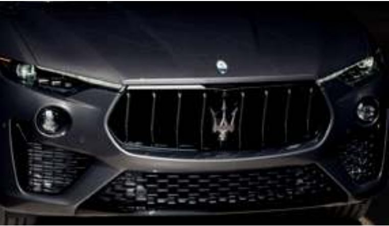
Levante - Rejilla