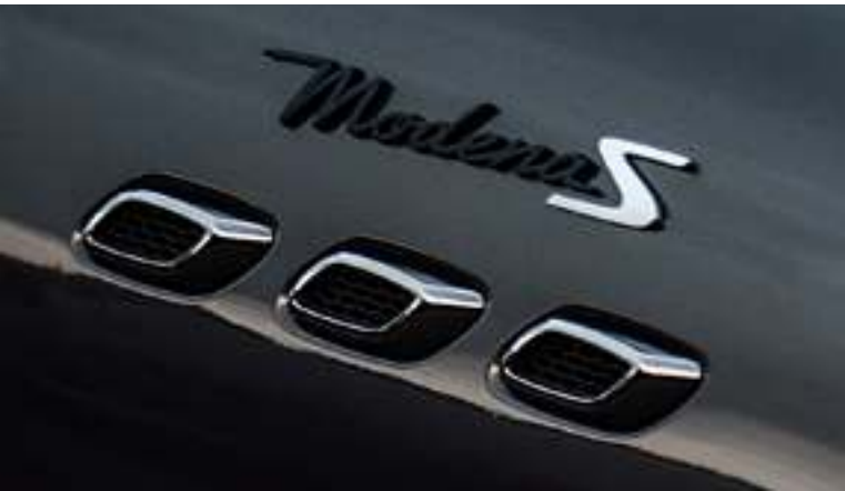
Levante - Aperturas laterales y símbolo Modena

Especificaciones técnicas de la versión Modena S.