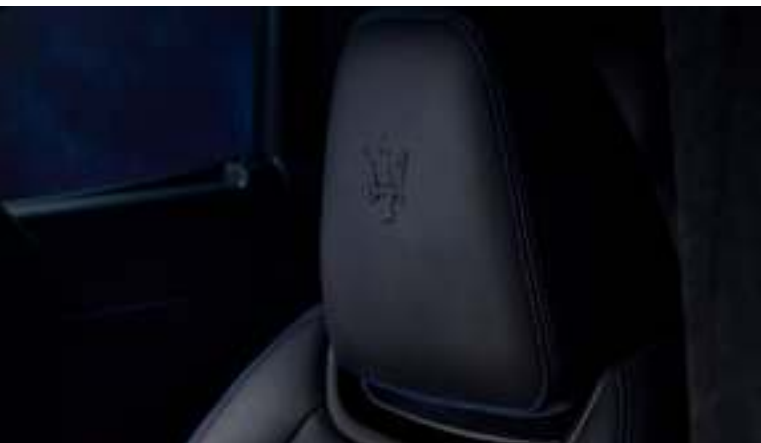
Levante GT Hybrid - Detalle del reposacabezas