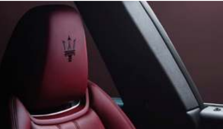
Levante - Detalle del reposacabezas