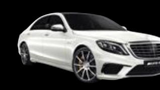
Clase S Mercedes-AMG