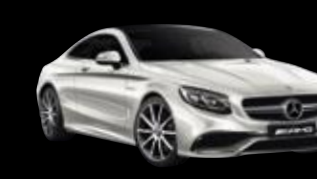
Clase S Mercedes-AMG Coupé