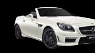
Mercedes-AMG SLK 55

Le invitamos a compartir nuestro entusiasmo por vehículos excepcionales. El mundo de Driving Performance le está esperando.