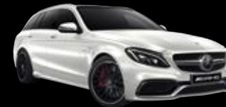
Clase C Mercedes-AMG Estate