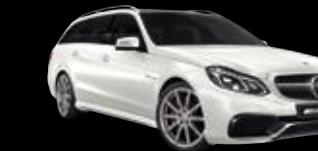
Clase E Mercedes-AMG Estate