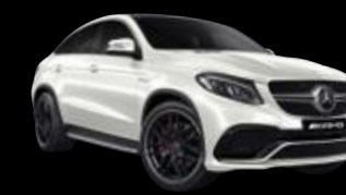
Mercedes-AMG GLE Coupé