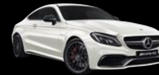
Clase C Mercedes-AMG Coupé