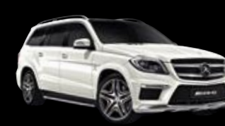
Mercedes-AMG GL 63