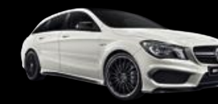
Mercedes-AMG CLA 45 Shooting Brake