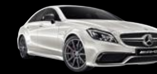
Mercedes-AMG CLS Coupé