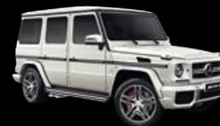
Clase G Mercedes-AMG