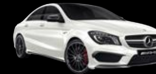
Mercedes-AMG CLA 45 Coupé