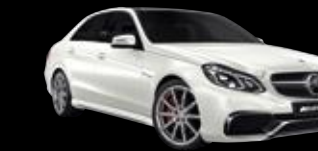
Clase E Mercedes-AMG Berlina