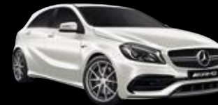
Mercedes-AMG A 45