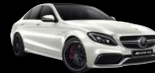
Clase C Mercedes-AMG Berlina