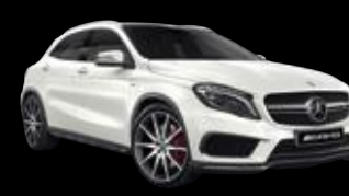
Mercedes-AMG GLA 45