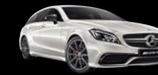
Mercedes-AMG CLS Shooting Brake