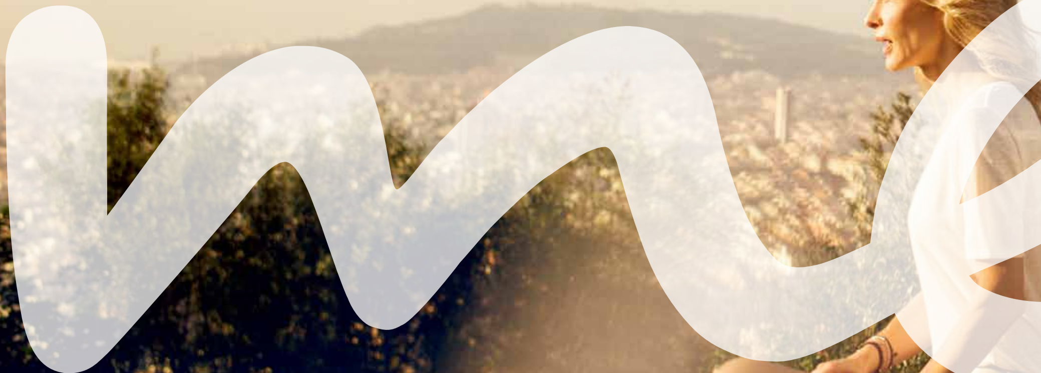
Imagen de un Mercedes: en esta doble página se muestra la nueva Clase C Berlina, consumo de combustible, ciclo mixto: 5,7-3,8 [8,4-3,6] l/100 km; emisiones de CO 2 , ciclo mixto: 132-99 [195-94] g/km.

En www.mercedes.me deseamos entusiasmarle, estimularle y sorprenderle con nuevos servicios, productos y experiencias. Visite también nuestras tiendas en ciudades como Berlín, Hamburgo, Múnich, París o Tokio.