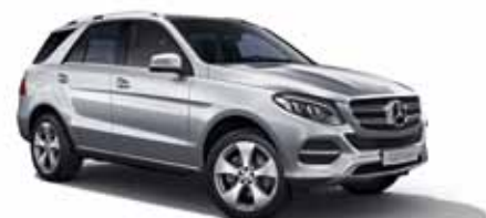
34 | Clase GLE