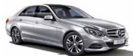
20 | Clase E Berline