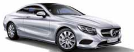
44 | Clase S Coupé