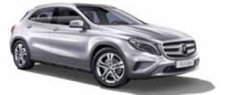
32 | Clase GLA