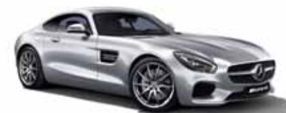
40 | Mercedes-AMG GT