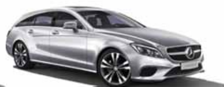
18 | Clase CLS Shooting Brake