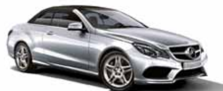
26 | Clase E Cabrio