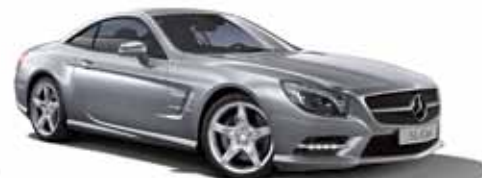
46 | Clase SL