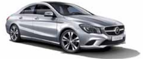
12 | Clase CLA Coupé