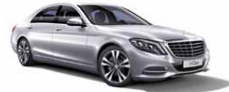
42 | Clase S