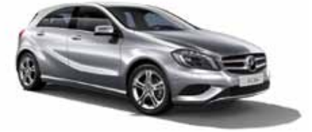
2 | Clase A