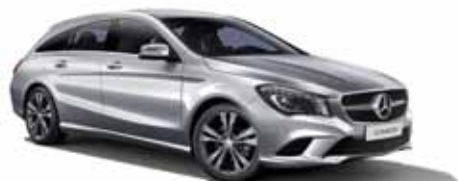
14 | Clase CLA Shooting Brake