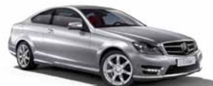
10 | Clase C Coupé