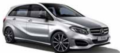
4 | Clase B