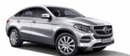
36 | Clase GLE Coupé