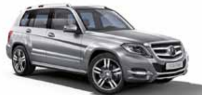
38 | Clase GLK