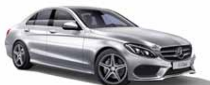
6 | Clase C Berline