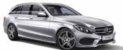
8 | Clase C Estate