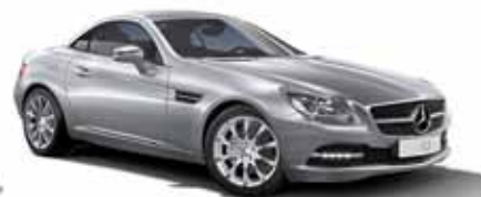
48 | Clase SLK