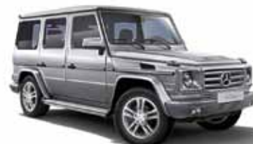
28 | Clase G