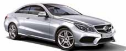
24 | Clase E Coupé