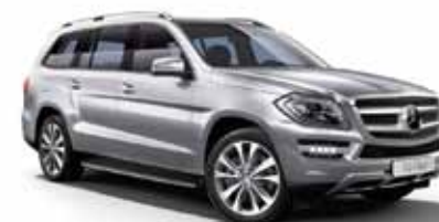
30 | Clase GL