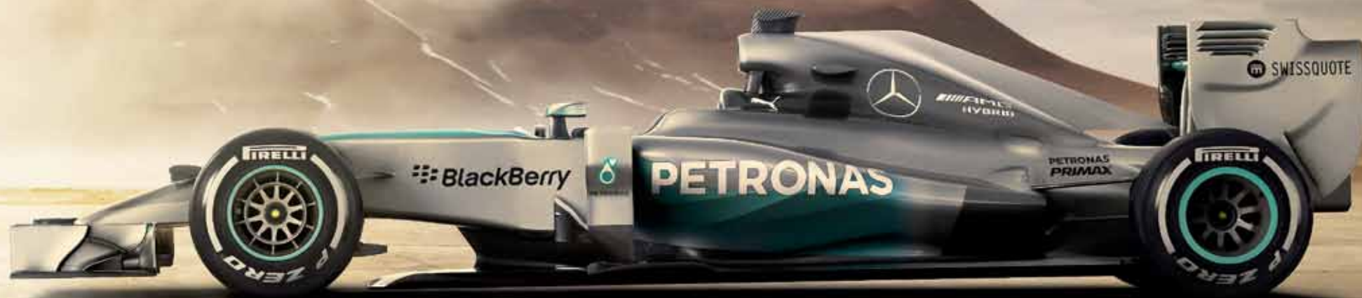
MERCEDES AMG PETRONAS F1 W05 Hybrid, temporada 2014.