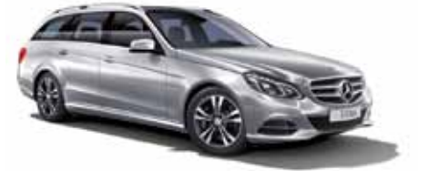
22 | Clase E Estate