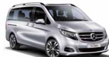
50 | Clase V