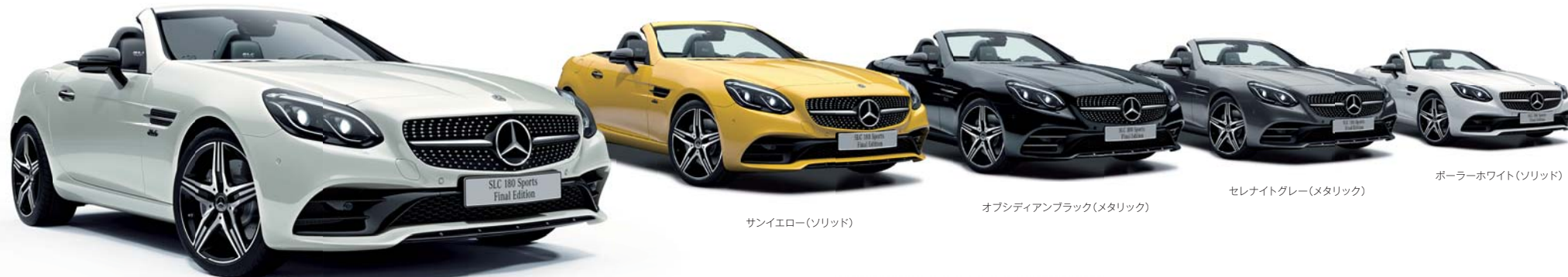
ボディカラー：ダイヤモンドホワイト(メタリック)