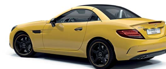
ボディカラー：サンイエロー(ソリッド)