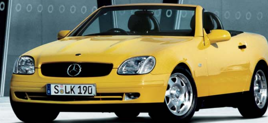
Mercedes-Benz SLK (1996)