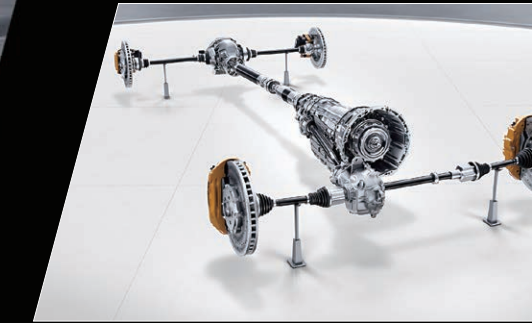
AMG Performance 4MATIC+全轮驱动系统

该系统可在“舒适”、“运动”、“运动+”3种模式间自由调整，以优异的舒适性和敏捷性满足多元化的驾驶需求。