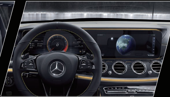
双12.3英寸高清显示屏

AMG高性能座椅的座垫和靠背的侧垫轮廓提供了出色的横向支撑，而充满张力的座椅设计则使内部空间更具运动感和独特感。