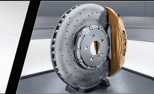
AMG高性能陶瓷复合制动系统

可有效提升车辆的灵敏性，赋予更丰富的驾驶乐趣。除此之外，在冰雪路面或高速换道时，还能确保驾驶稳定性。