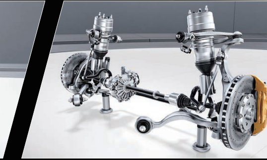
AMG行驶控制运动型悬挂系统

支座在固定发动机的同时将发动机的振动与人体隔离开来，解决了软支架增强舒适性与硬支架提升驾驶动态性之间的矛盾。