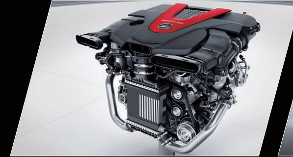
3.0升V6双涡轮增压发动机

专为性能而生，释放每一滴燃油的潜能，经过调校的发动机控制系统与响应灵敏的涡轮增压器完美结合，令每一次加速都乐趣十足。