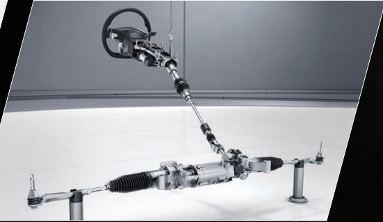
AMG车速感应式运动型转向系统

自动变速箱具有9个前进档，将效率、舒适性和动态性全面提升。其快速的换挡操作同样令人印象深刻，且有助于降低油耗。