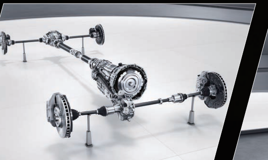
AMG运动型全时四轮驱动系统

不同的驾驶模式产生不一样的声浪特征，无论是轰鸣咆哮还是低声沉吟，发动机声浪让AMG的驾驶体验更为丰富有趣。