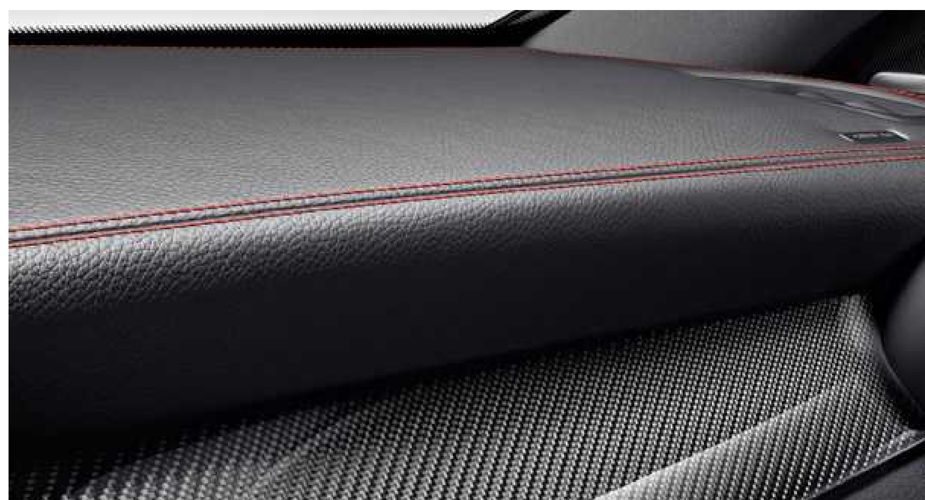
Tableau de bord en cuir ARTICO à surpiqûres rouges contrastantes

Des détails rouges uniques ajoutent un contraste d'allure sportive aux sièges noirs et aux garnitures de l'habitacle. Les sièges et le volant sont rehaussés de surpiqûres rouges alors que les ceintures de sécurité rouges ajoutent une note racée.