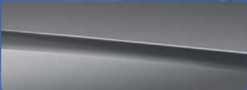
MANUFAKTUR 经典灰色非金属漆