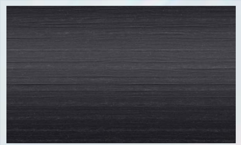
H15 黑色开孔型椴木木饰 1