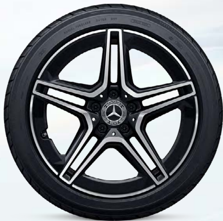
RQT 2 45.7厘米 (18英寸) AMG双5辐轻合金车轮