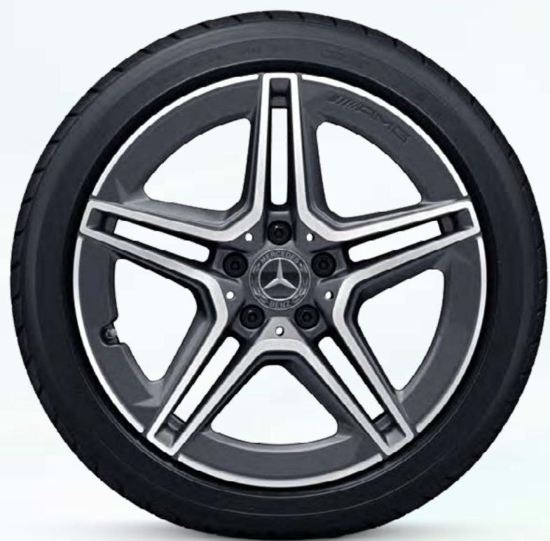
RQS 1 45.7厘米 (18英寸) AMG双5辐轻合金车轮