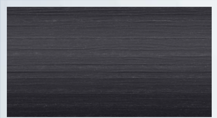
H15 黑色开孔型椴木木饰 1