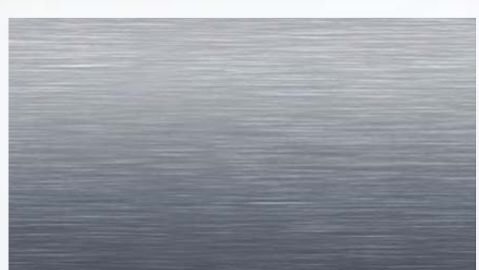
H44 带纵纹的轻质铝质饰件 2