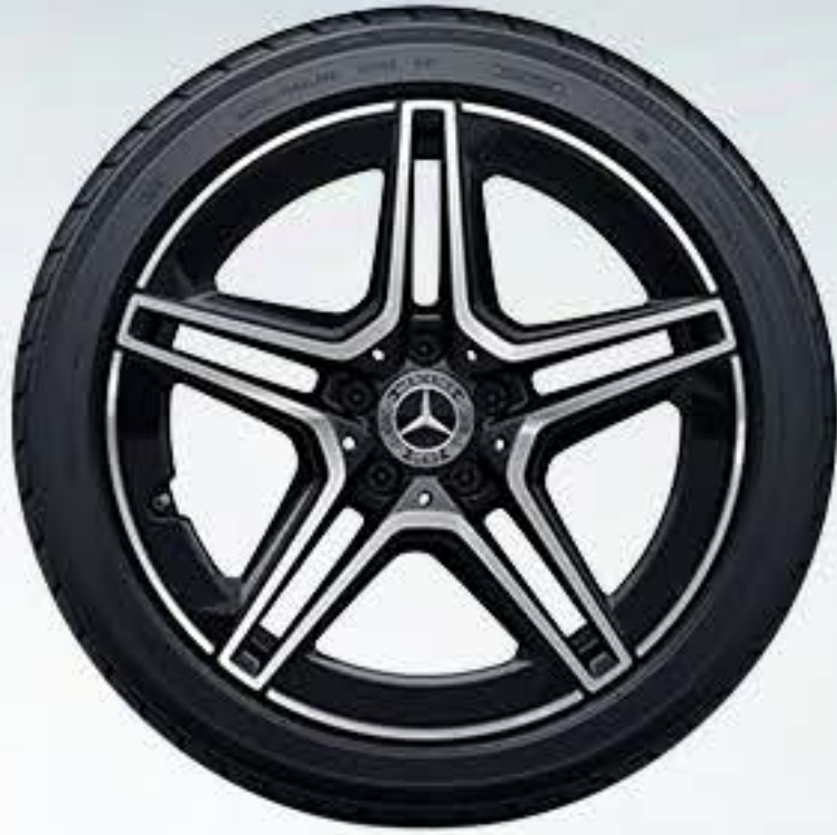
RQT 2 45.7厘米 (18英寸) AMG双5辐轻合金车轮