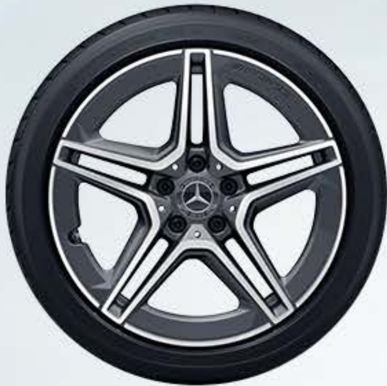
RQS 1 45.7厘米 (18英寸) AMG双5辐轻合金车轮