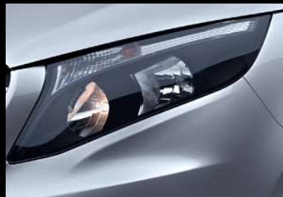
卤素大灯带大灯辅助系统

传承奔驰家族设计，高端奢华、气质优雅。舒展长轴距大车身，仅有0.32极低风阻系数，大幅度提升功效，降低能效，为事业带来更多优势。17英寸双5辐轻合金车轮，彰显高端商务气度，不乏动感。