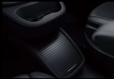
滑盖式中央储物箱

保持（HOLD）功能可在仅轻踩或部分踩下制动踏板时阻止车辆行进。满足短时间驻车停留等候需求，方便您的商务出行。