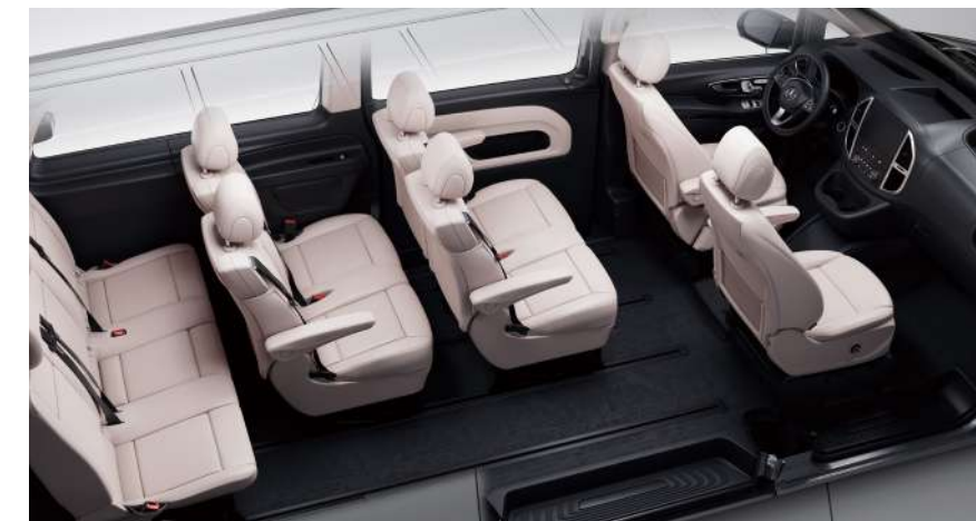
9 座车型标准座椅布局