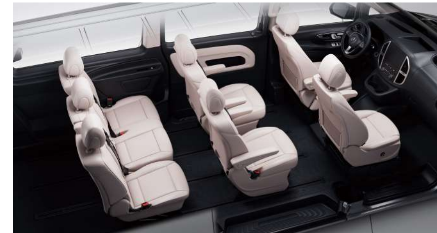
7 座商务版车型标准座椅布局