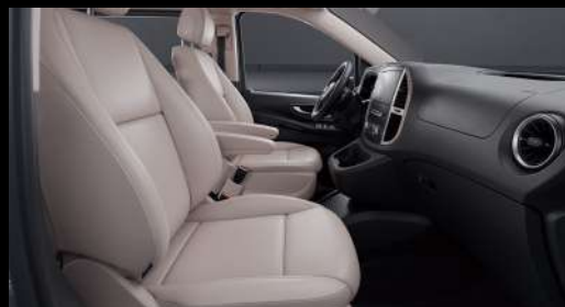
正副驾驶8向电动调节座椅

带伸缩盖的中央控制台，提供额外的储物空间。无论文件、证件、手机，小物件不必东拿西放，集中储存更可快速拿取。独特黑色伸缩盖设计，防止物品散落，更可充分保障隐私，让收纳安心又省心。