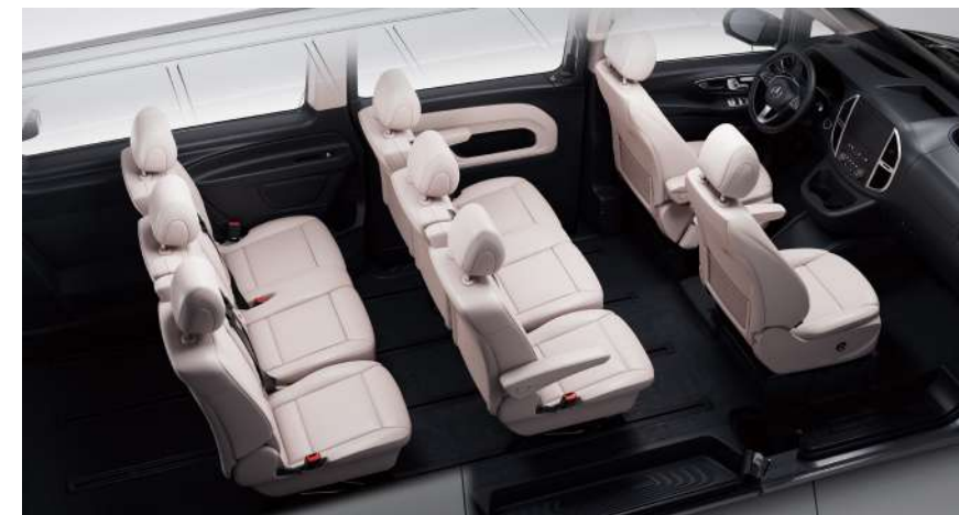
8 座商务版车型标准座椅布局