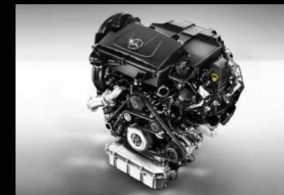
高效能 2.0T 涡轮增压发动机

商业发展中，动力意味着更高效地运转。威霆MPV，配备高效能2.0T涡轮增压发动机，最大350N.m扭矩，配合敏捷操控悬挂系统，化解路途险阻，前进之路挥洒自如。