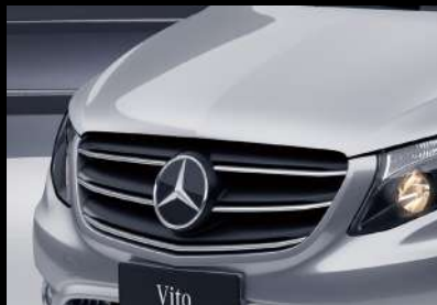
前进气格栅采用镀铬装饰

梅赛德斯-奔驰威霆MPV的卤素大灯集成了远光灯、近光灯、日间行车灯、转向信号灯以及驻车灯，且具有大灯延时关闭功能；行车过程中监控亮度、天气和光线条件，并根据要求切换灯光。