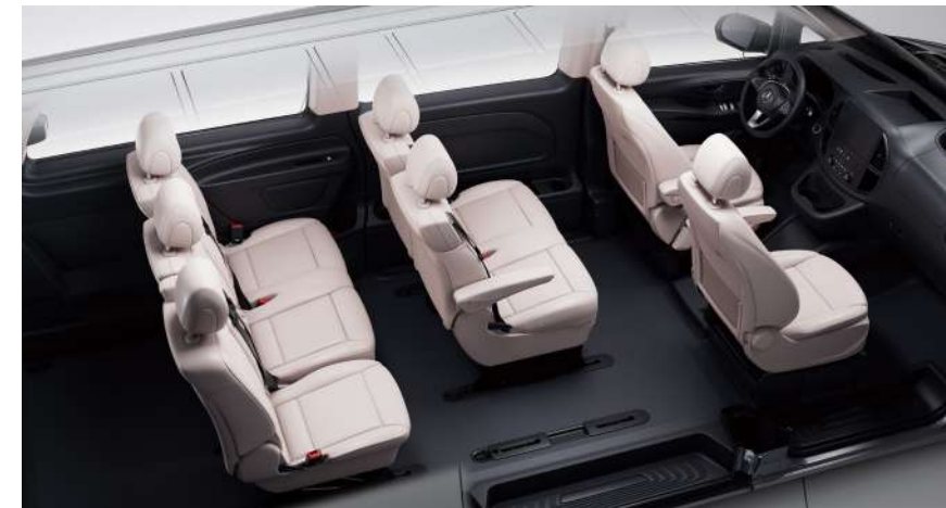
7 座精英版车型标准座椅布局