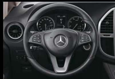
Nappa 皮饰多功能方向盘

3430毫米大轴距，提供超乎所想的内部空间表现，让您从容搏击商海，游刃于事业百态。灵活多变的座椅布局，随心变换的空间组合，大有乾坤，为您承载更多可能。