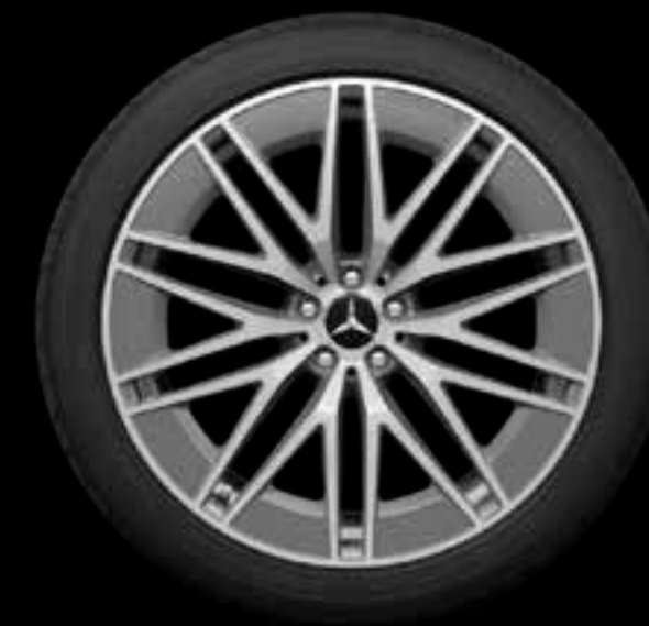
RPG 1 55.9 厘米 (22 英寸) AMG多辐轻合金车轮