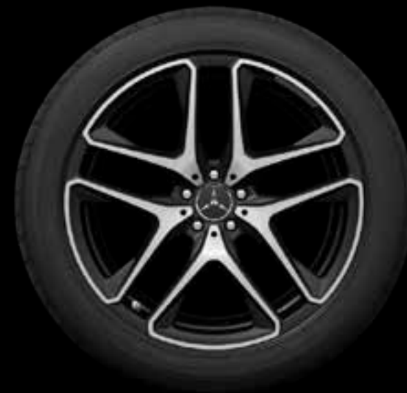
RWE 53.3 厘米 (21 英寸) AMG双5辐轻合金车轮