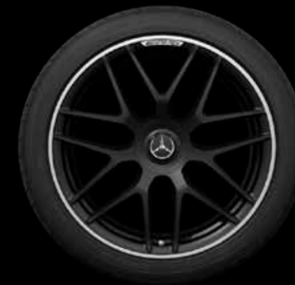
RXV 2 55.9 厘米 (22 英寸) AMG交叉轮辐锻造车轮