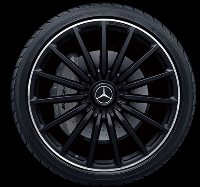
RWY 2 53.3厘米 (21 英寸) AMG 多辐轻合金车轮