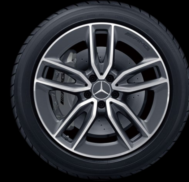
RTH 48.3厘米 (19 英寸) AMG 双5辐轻合金车轮