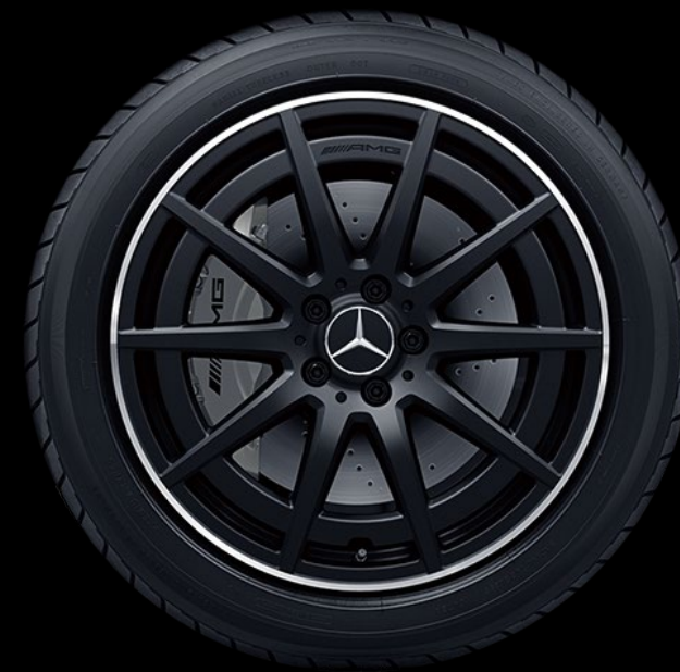
RVZ 1 48.3厘米 (19 英寸) AMG 10 辐轻合金车轮