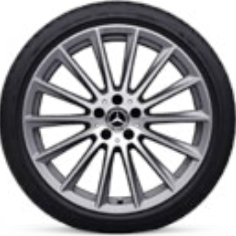
RVQ 4 50.8厘米(20英寸) AMG多辐合金车轮