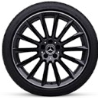
RVP 5 50.8厘米 (20英寸) AMG多辐轻合金车轮