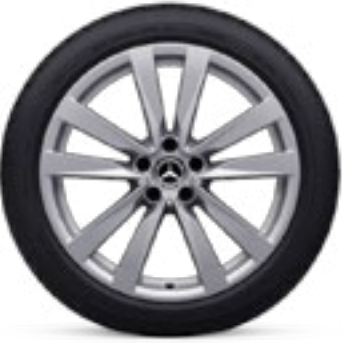
77R 1 48.3厘米 (19英寸) 双5辐轻合金车轮