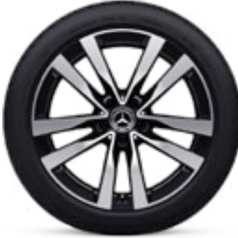
R55 2 48.3厘米 (19英寸) 双5辐轻合金车轮