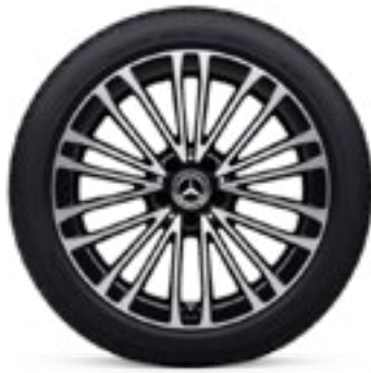
R60 3 48.3厘米 (19英寸) 双多辐轻合金车轮