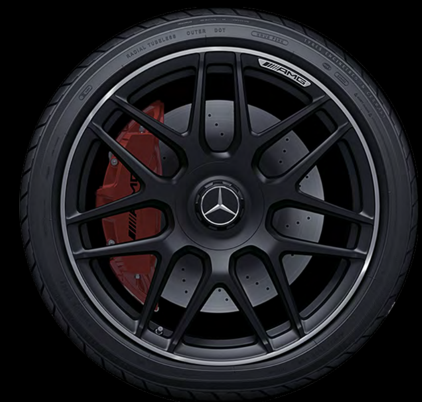
RSZ 2 48.3厘米 (19 英寸) AMG 多辐条轻质合金轮毂 (哑光黑色)