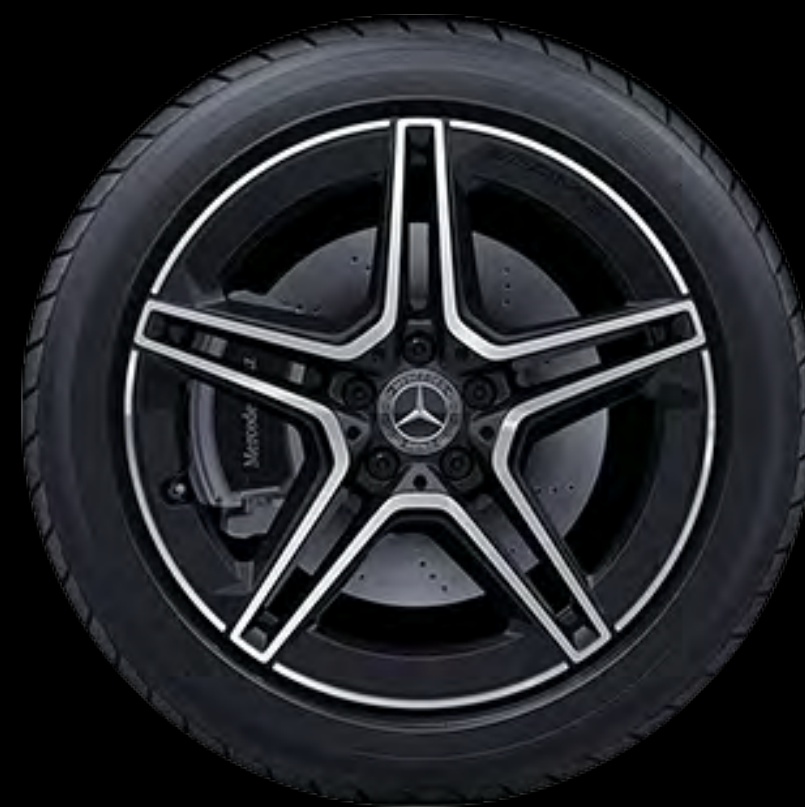
RTG 1 48.3厘米 (19 英寸) AMG 双五辐轻合金车轮