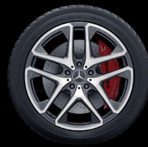
RG2 2 53.3 厘米 (21 英寸) AMG 双 5 辐 轻合金车轮