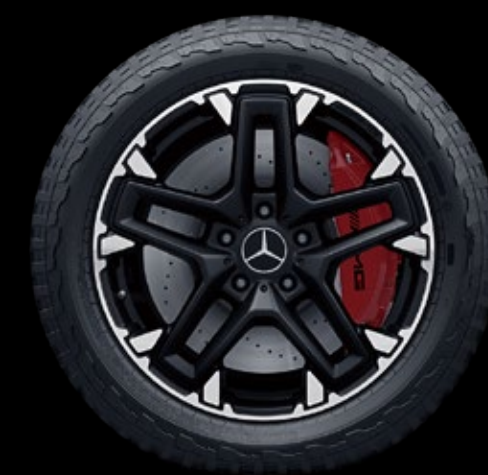
RG7 4 50.8 厘米 (20 英寸) AMG 双 5 辐轻合 金车轮, 喷涂哑光黑色漆, 带高光面饰