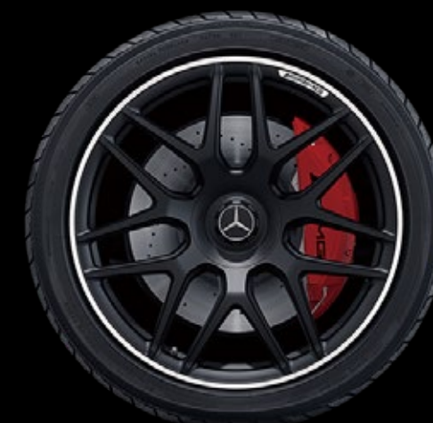
RG4 3 55.9 厘米 (22 英寸) AMG 交叉轮 辐锻造车轮