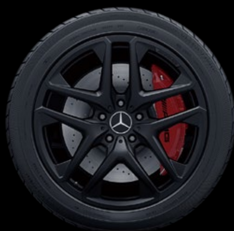
RJ6 2 53.3 厘米 (21 英寸) AMG 双 5 辐 轻合金车轮, 喷涂哑光黑色漆