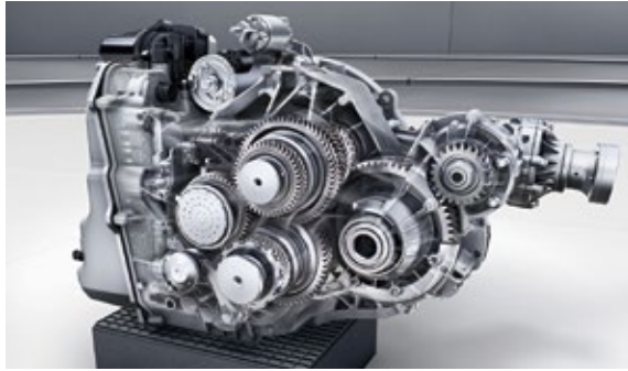
AMG SPEEDSHIFT DCT 7速双离合变速箱

AMG高性能智能适时四轮驱动系统可以根据行驶路况需要,在前后轴之间灵活分配扭矩,从而实现优异的能效和出色的安全操控性。