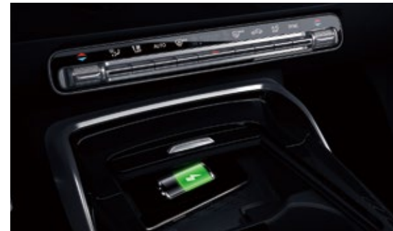
用于移动设备的无线充电功能

该智能手机应用程序堪称专属虚拟赛车工程师。在单圈、分段和加速用时以及选定的实时车载智能信息数据的帮助下,您可以有针对性地分析并改善您在封闭赛道上的驾驶技巧。