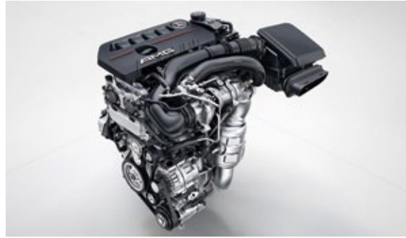
四缸涡轮增压发动机

M260轻量级发动机拥有强劲的牵引力,可根据输出功率灵活调节涡轮增压。CAMTRONIC可变气门升程技术让发动机技术再升级,实现了油耗的显著降低。