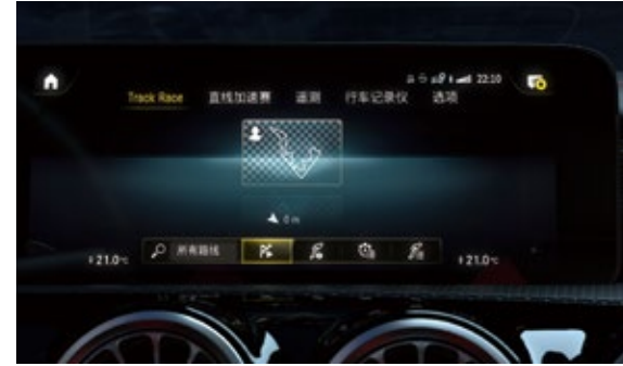
AMG Track Pace

64色环境氛围照明系统拥有10种颜色方案,可根据您的个人喜好或心情营造照明氛围。流光溢彩的车内环境,令人心悦神怡。