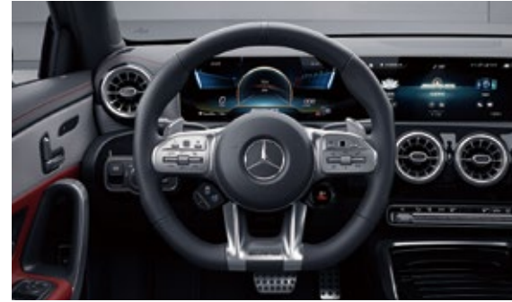
Nappa皮饰AMG高性能方向盘

AMG高性能方向盘采用Nappa皮革包覆,抓握区采用打孔皮。符合人体工程学原理布置的触控键更加直观便捷,使驾驶者能够专注驾驶。