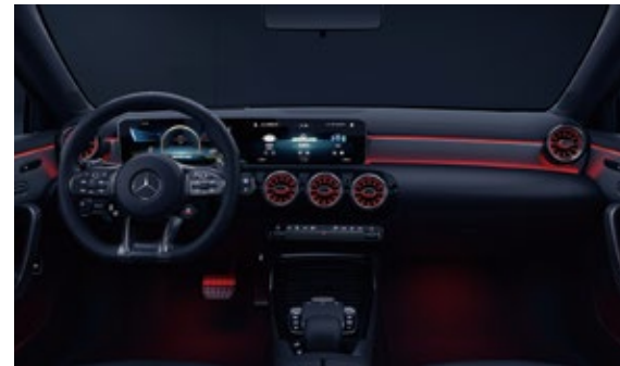
64色环境氛围照明系统

AMG高性能方向盘采用Nappa皮革包覆,抓握区采用打孔皮。符合人体工程学原理布置的触控键更加直观便捷,使驾驶者能够专注驾驶。