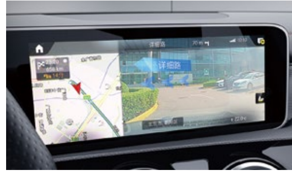
MBUX智能人机交互系统实景穿越导航

无论您的手机是什么型号和品牌,只要它符合Qi标准,仅需一步简单的操作,即可将智能手机固定在中央控制台中进行无线充电。