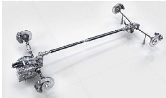
AMG高性能智能适时四轮驱动系统

M260轻量级发动机拥有强劲的牵引力,可根据输出功率灵活调节涡轮增压。CAMTRONIC可变气门升程技术让发动机技术再升级,实现了油耗的显著降低。