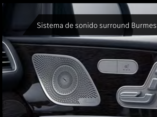
Sistema de sonido surround Burmester®.