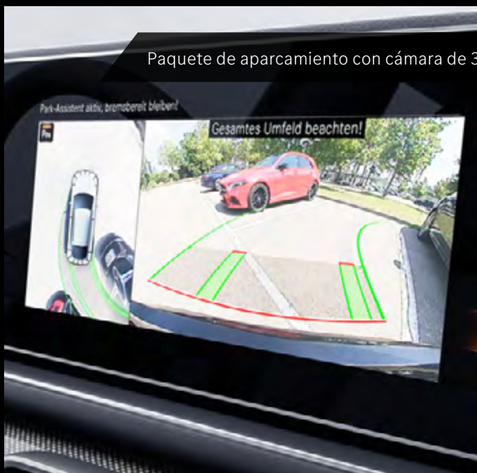
Paquete de aparcamiento con cámara de 360°.