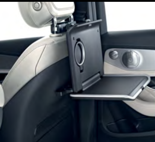
Mesita plegable. Paquete Style & Travel. A000 816 0000