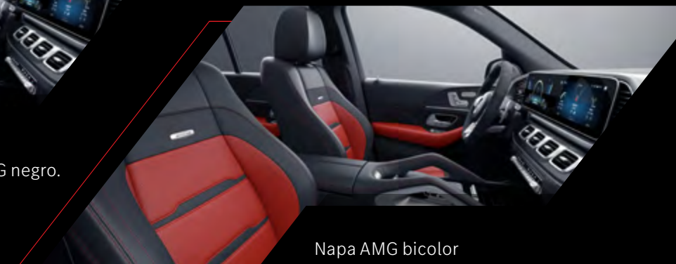
Napa AMG bicolor red pepper/negro.*