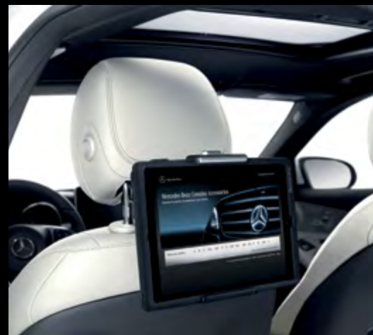
Soporte para tableta. Paquete Style & Travel. A000 827 2000