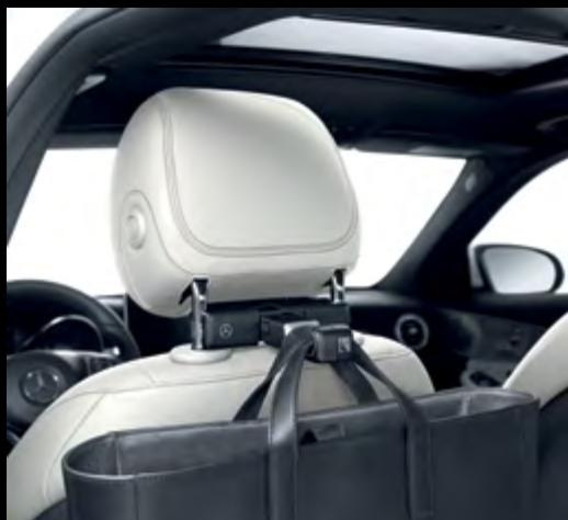
Colgador para bolsos. Paquete Style & Travel. A000 814 0000