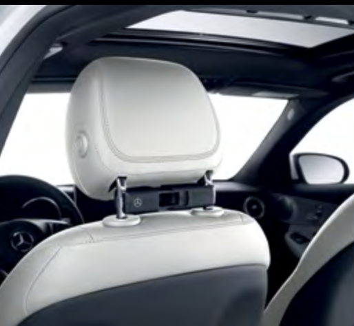
Soporte básico. Paquete Style & Travel. A000 810 3300