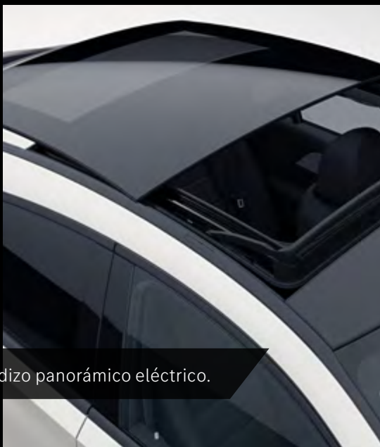
Techo corredizo panorámico eléctrico.