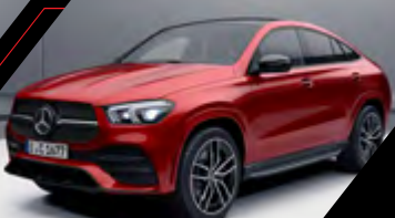
diseño rojo jacinto metalizado*