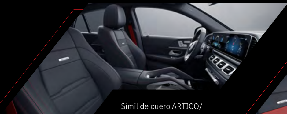
Símil de cuero ARTICO/ microfibra DINAMICA AMG negro.