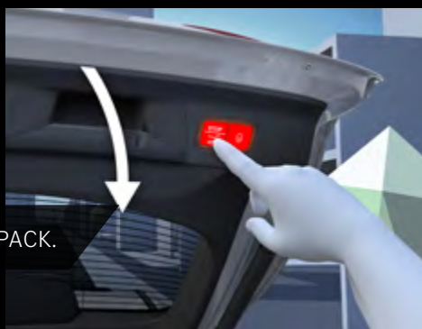
Portón trasero EASY-PACK.