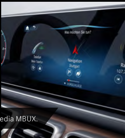
Sistema multimedia MBUX.