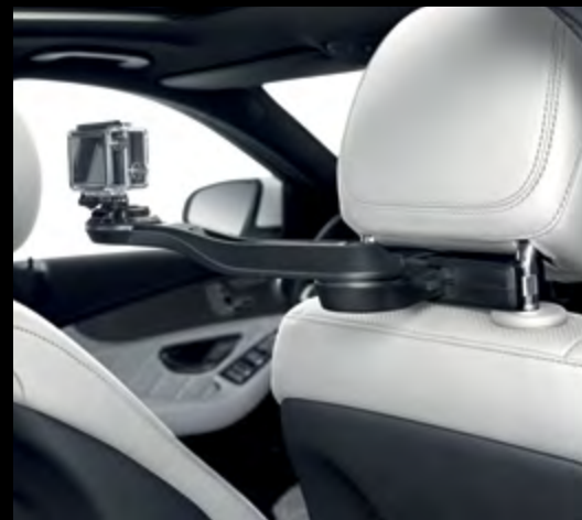
Soporte para cámara action cam. Paquete Style & Travel. A000 827 1900