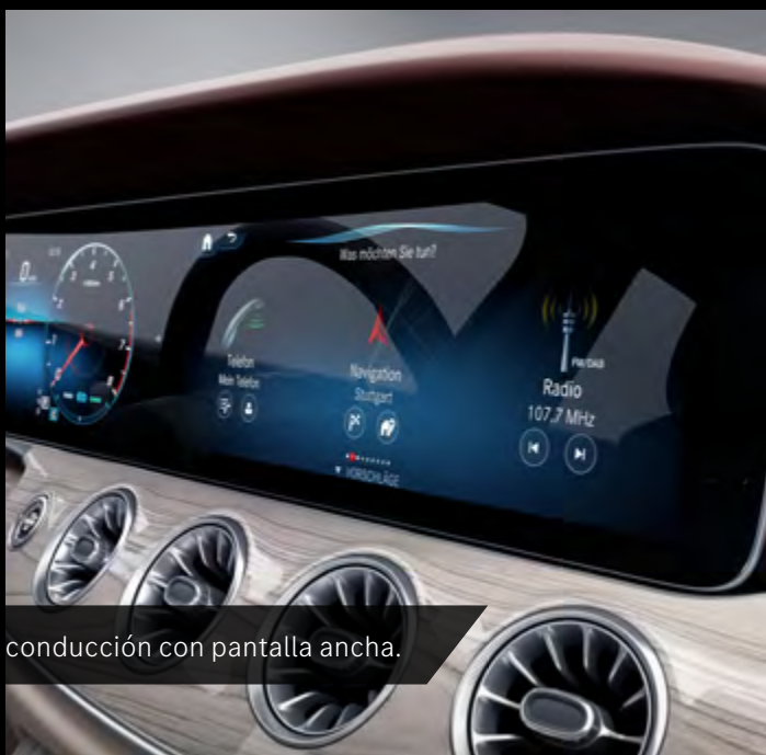
Puesto de conducción con pantalla ancha.