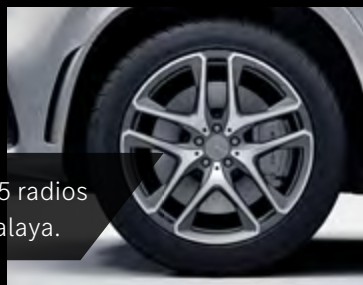
Rin AMG de 21" con 5 radios dobles color gris Himalaya.