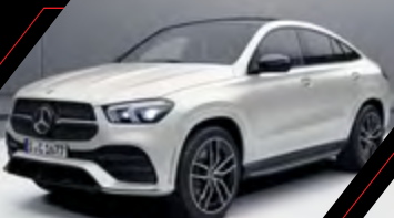
diseño blanco diamante bright*