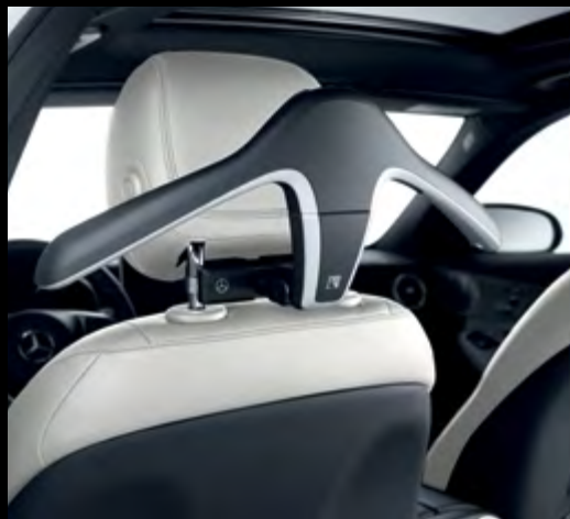
Percha para ropa. Paquete Style & Travel. A000 810 3400