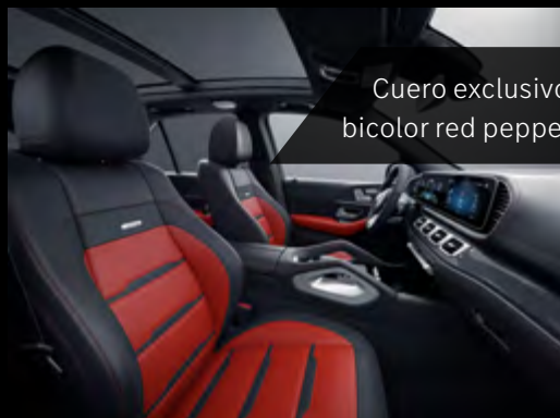
Cuero exclusivo Napa AMG bicolor red pepper/negro.