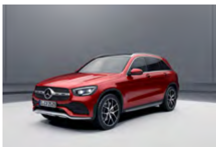
diseño rojo jacinto metalizado*