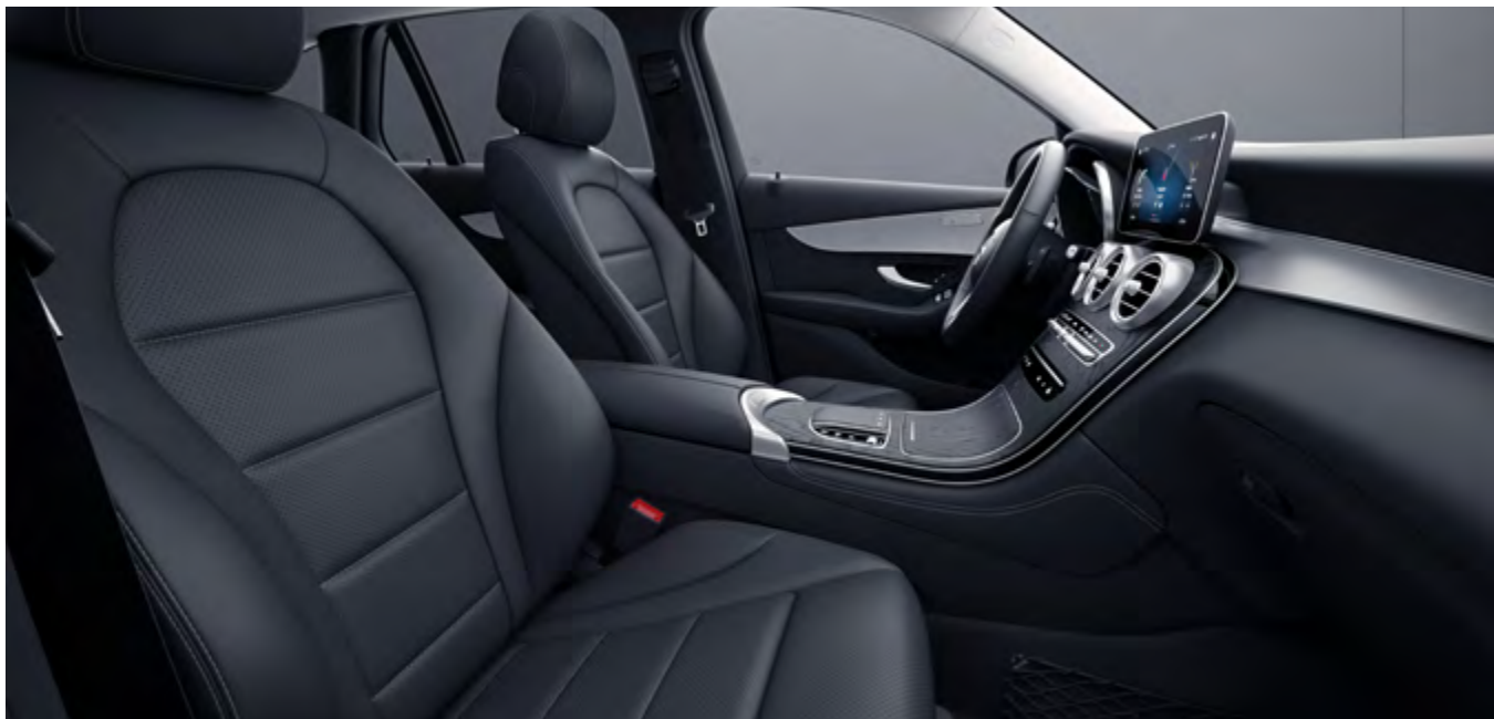
Símil de cuero ARTICO negro.