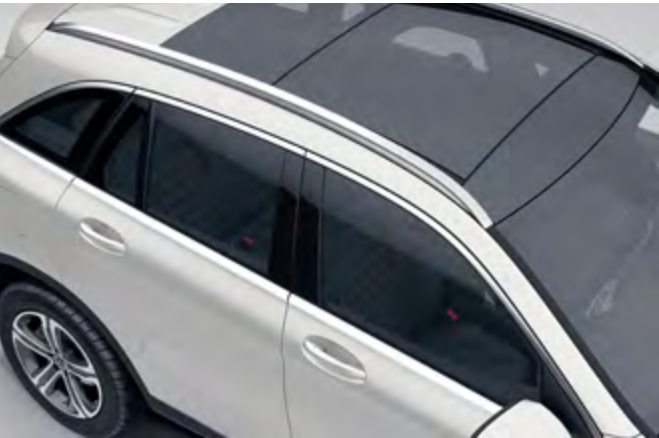
Techo corredizo panorámico eléctrico.