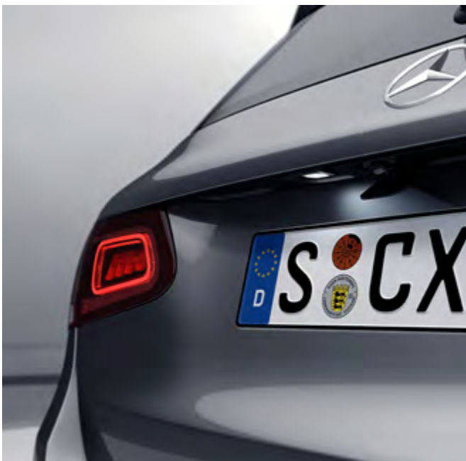
Paquete de aparcamiento con cámara de marcha atrás.