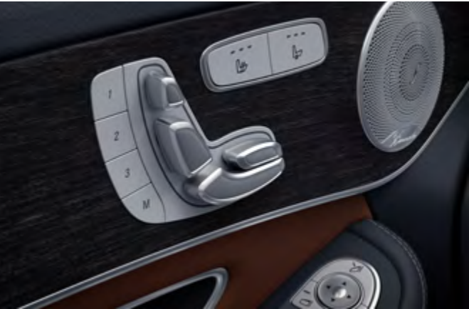
Asiento del conductor de ajuste eléctrico con función de memoria.