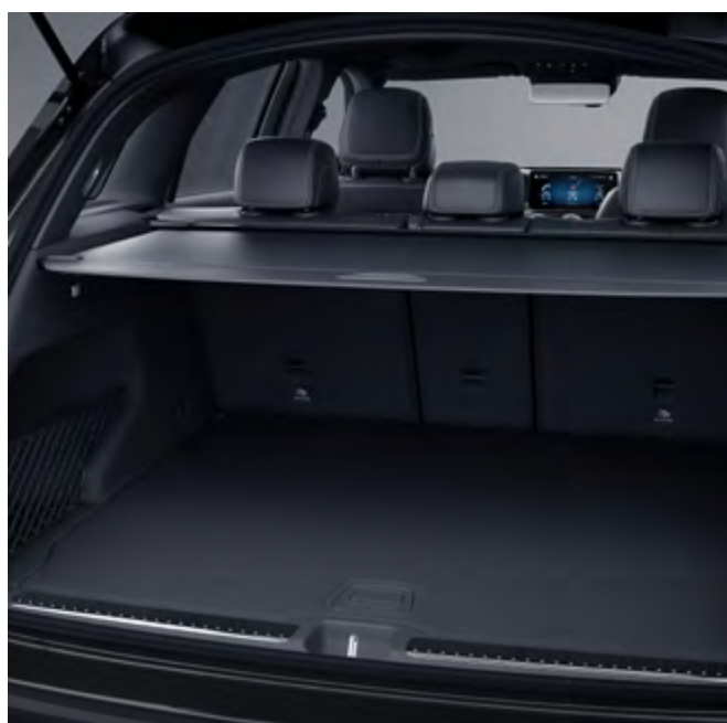
Cubierta del compartimento de carga EASY-PACK extraíble.

Las fotografías que aquí aparecen son usadas como referencia y pueden ser modificadas sin previo aviso.