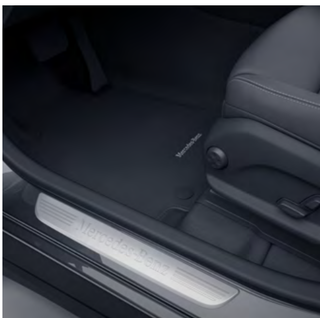
Paquete de confort para los asientos.