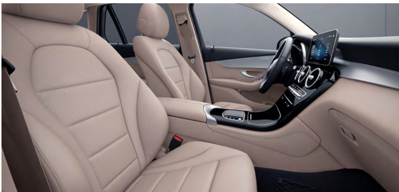
Símil de cuero ARTICO-beige seda/negro.

Las fotografías que aquí aparecen son usadas como referencia y pueden ser modificadas sin previo aviso.