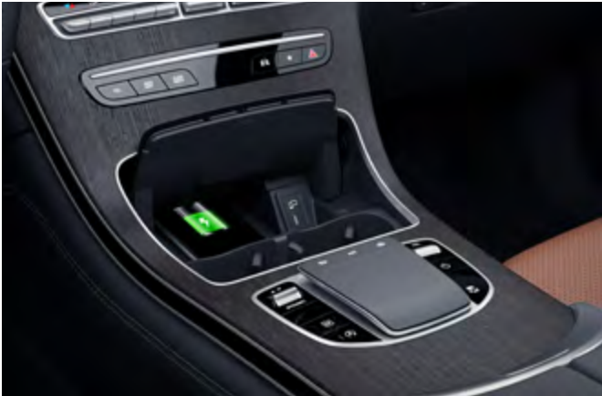
Sistema inalámbrico de carga para dispositivos móviles.

Las fotografías que aquí aparecen son usadas como referencia y pueden ser modificadas sin previo aviso.