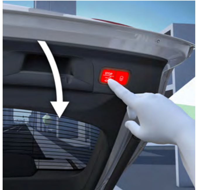
Portón trasero EASY-PACK.