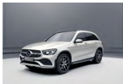
diseño blanco diamante bright*