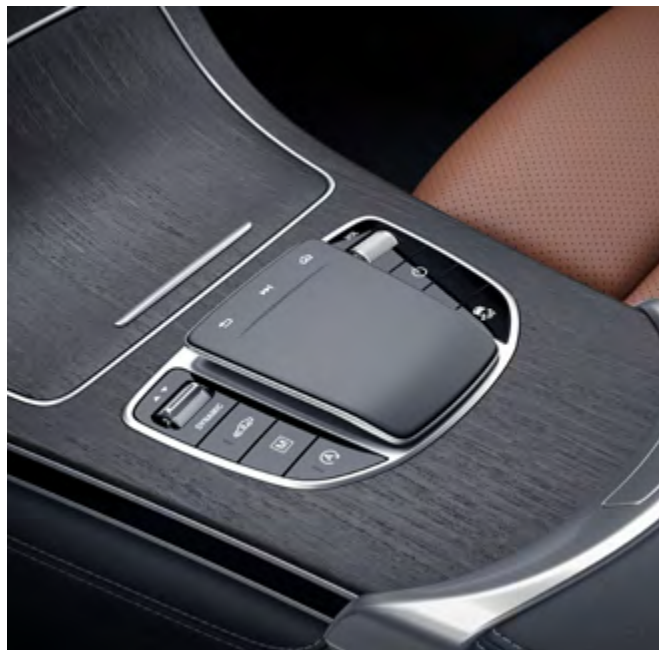
Panel táctil sin controlador.