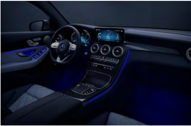
Iluminación de ambiente.