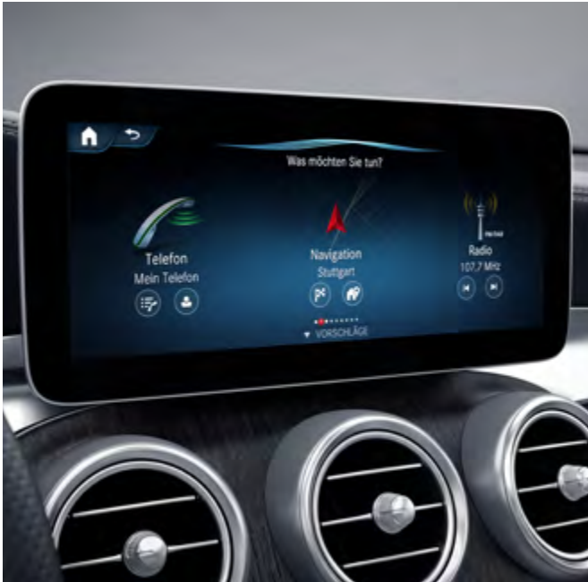
Funciones ampliadas MBUX.

Conozca los aspectos más destacados de la GLC 300 4MATIC Comfort.