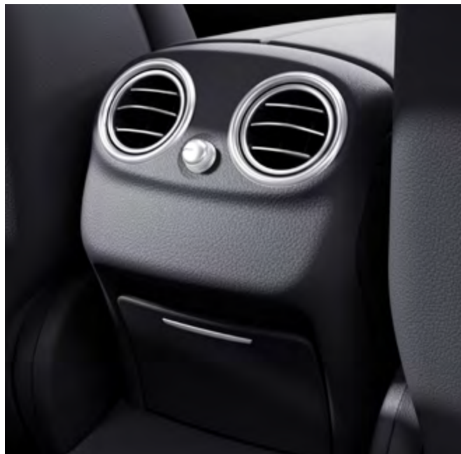
Climatización automática THERMATIC.