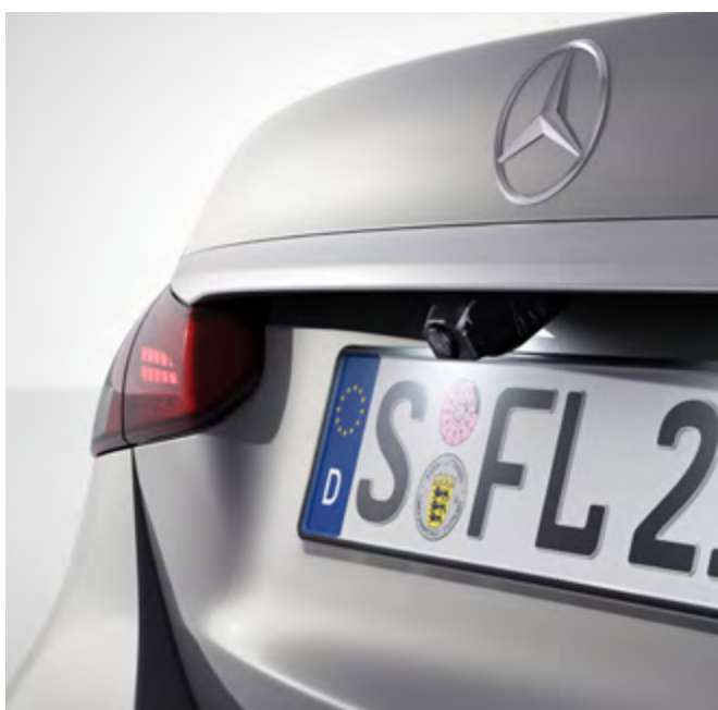
Paquete de aparcamiento con cámara de marcha atrás.