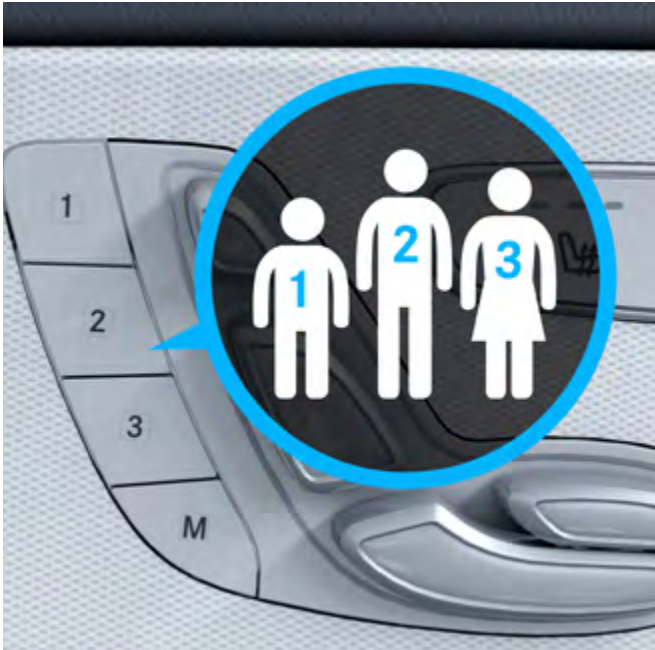
Asientos con memorias.

Conozca los aspectos tecnológicos más destacados del E 200 AVANTGARDE.