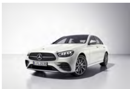
disegno blanco diamante bright*