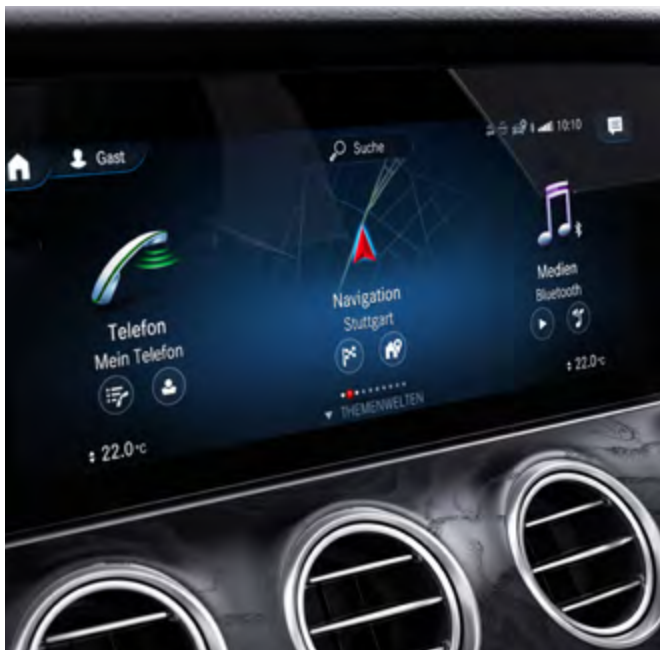
Funciones ampliadas MBUX.

Conozca los aspectos más destacados del E 200 AVANTGARDE.