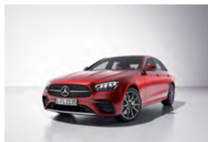
disegno rojo jacinto metalizado*