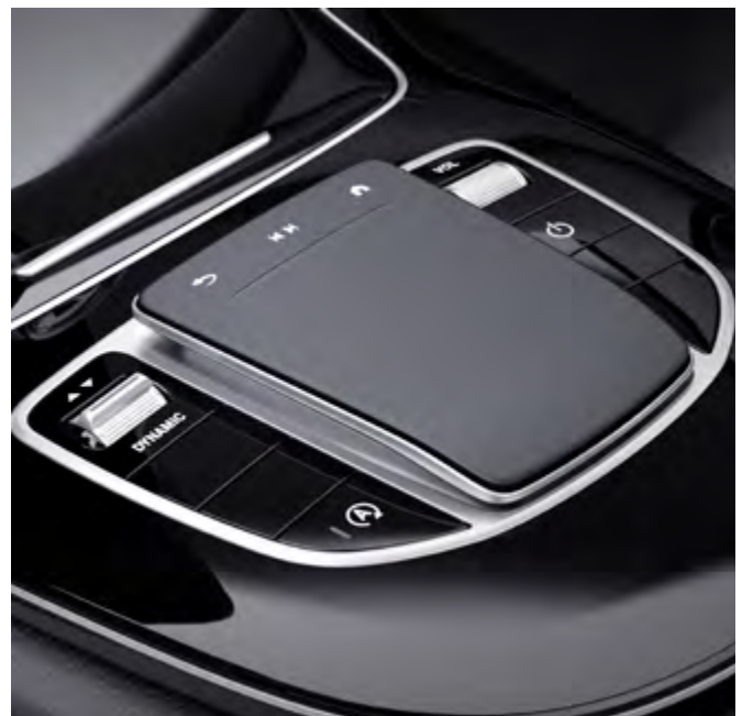
Panel táctil sin controlador.