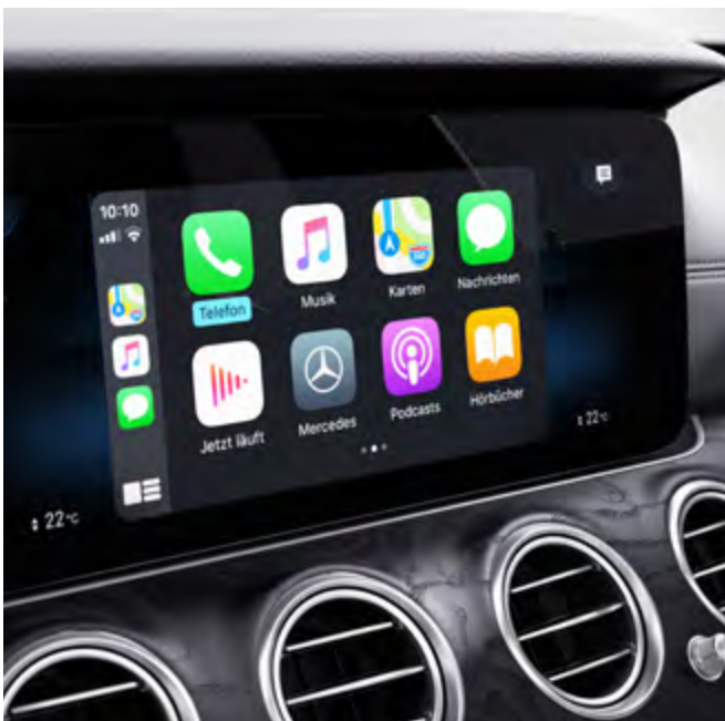
Integración de smartphone.