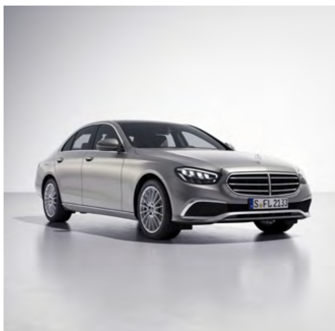
Tren de rodaje AGILITY CONTROL con sistema de amortiguación selectivo.

Las fotografías que aquí aparecen son usadas como referencia y pueden ser modificadas sin previo aviso.