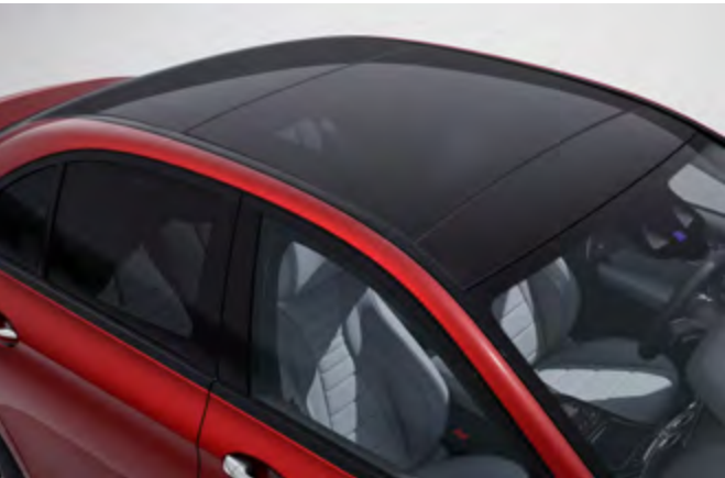
Techo corredizo panorámico eléctrico.