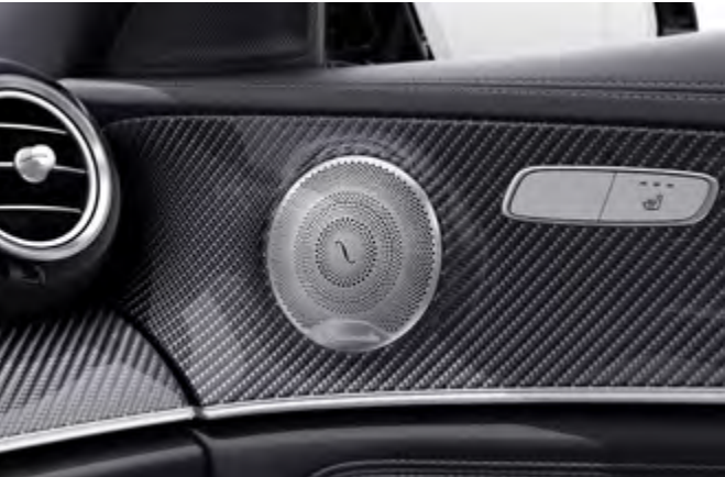
Sistema de sonido surround Burmester®.