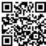
Mercedes-Benz Pass 賓士暢行

為了實踐關懷車主的承諾，台灣賓士提供各項完善的貼心服務來滿足你的需要，包括：轎車三年不限里程保固、非消耗性自費零件一年不限里程零件保固、Mercedes-Benz 24 小時道路救援服務專線 (08000-365-24) 等。此外，為了享受完整的車主禮遇，請你即刻掃描 QR Code，以 Mercedes-Benz 帳號登入「Mercedes-Benz Pass 賓士暢行」，除了整合停車、代駕與充電服務的實用功能以外，更有 24 小時禮賓專線服務、頂級飯店與餐廳優惠、以及各種車主專屬的品牌活動等尊享禮遇，現在就開啟你的賓士世界！