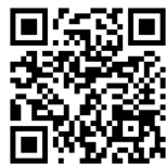
台灣賓士資融官方 LINE 帳號

Mercedes-Benz 不僅於造車工藝追求完美，更期望圓滿所有用車環節。台灣賓士資融提供你多元化的分期專案、彈性的租賃選擇及量身打造的保險方案。請立即掃描 QR Code，了解賓士各車款最新分期購車優惠、試算最適合你的財務規劃，註冊登入 myMBFS 行動查詢，隨時管理你的分期購車/租賃合約！