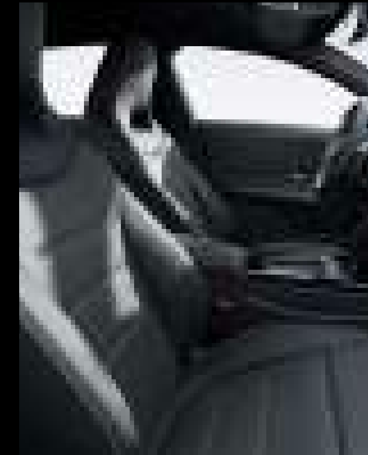
● 259A - 가죽 투톤 레더 티타늄 그레이 펄 / 블랙 및 옐로우스티치 (선택사양)