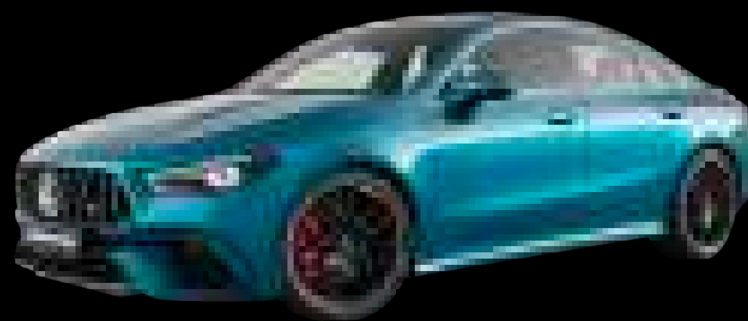
888U - 하이퍼 블루