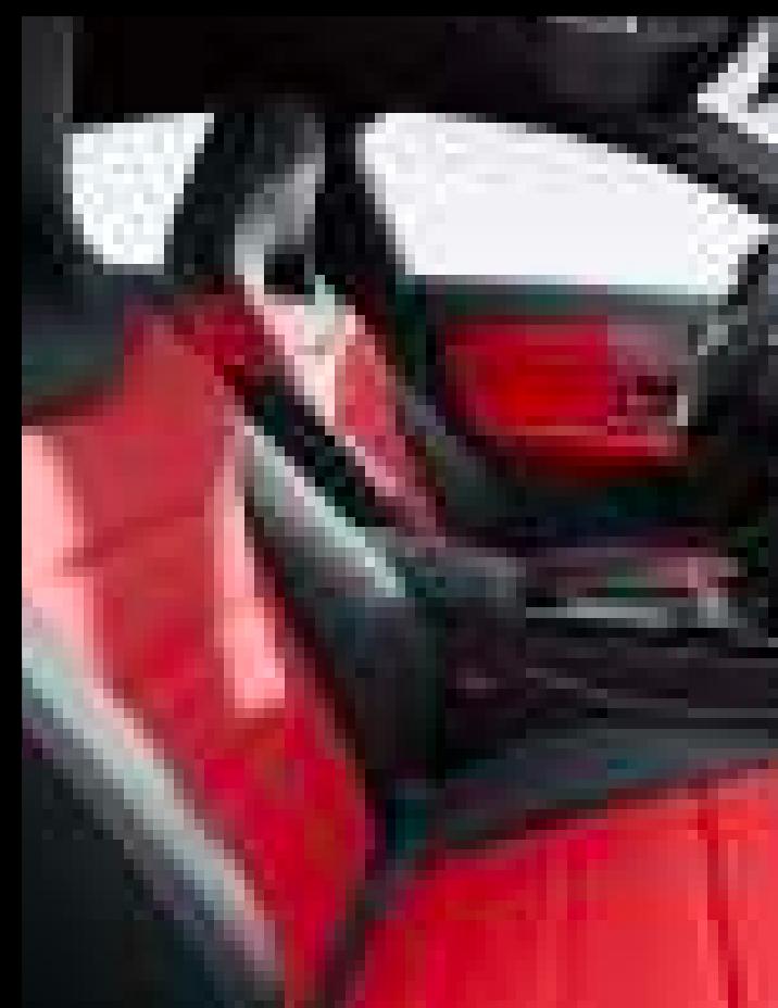
● 277A - 가죽 투톤 레드 페퍼/블랙 (유료옵션)