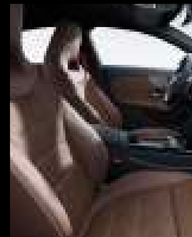
● 654A - 아티코 가죽 마이크로켓 마이크로파이버 바이아 브라운/블랙 (유료옵션)