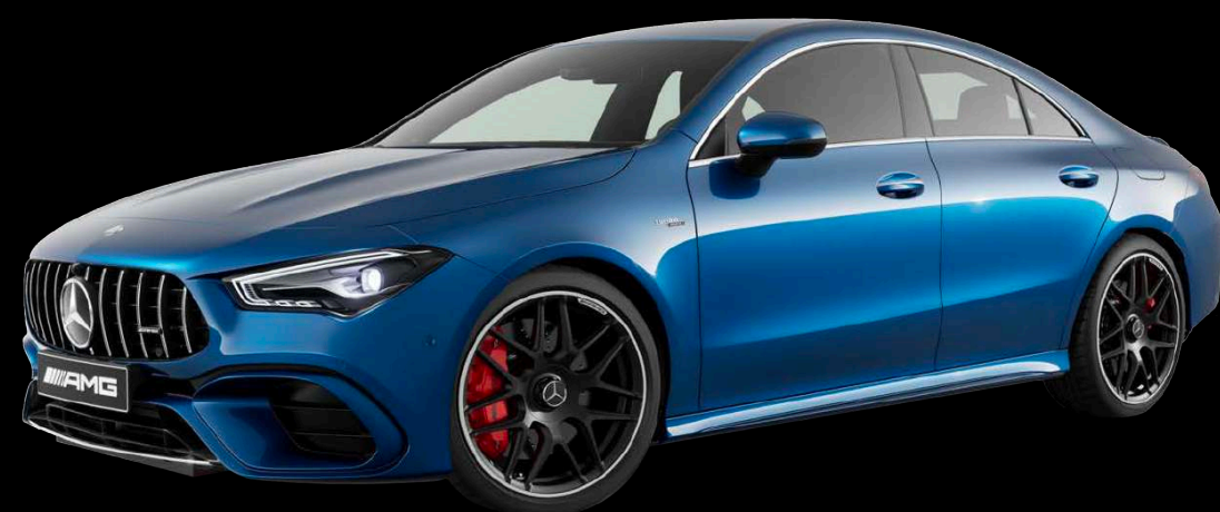
970U - 스펙트럴 블루