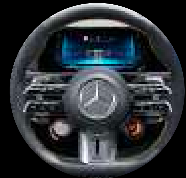
L6K - AMG 퍼포먼스 스티어링 휠, 나파 가죽/마이크로컷 마이크로파이버