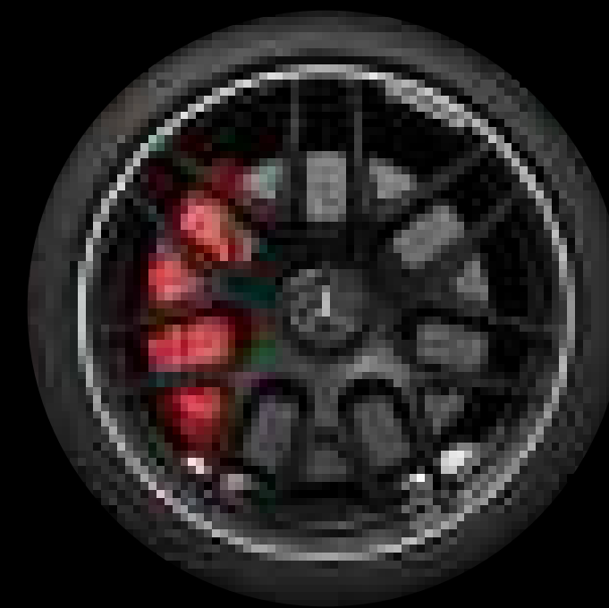
RSZ - 19인치 AMG 크로스 스포크 단조 휠 기본사양