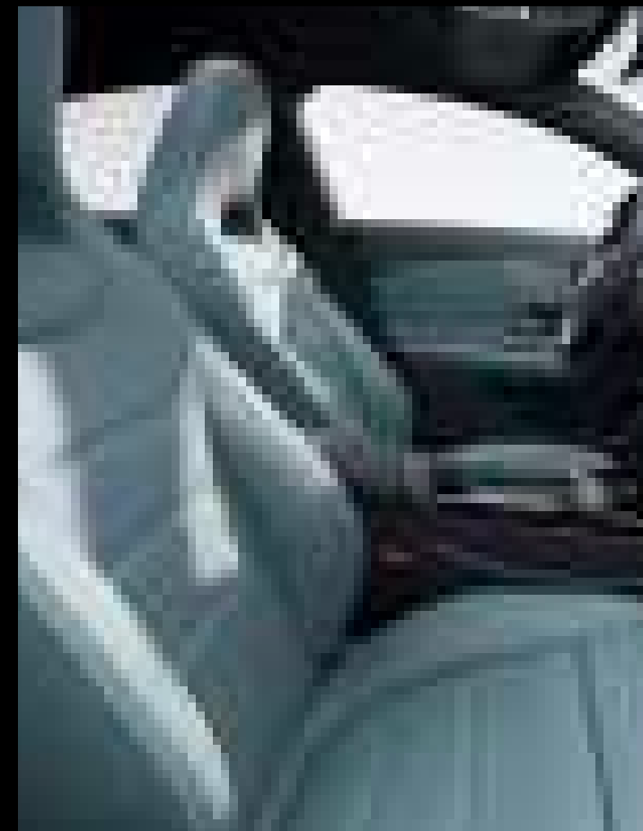
● 158A - 아티코 가죽 세이지 그레이/블랙 (선택사양)