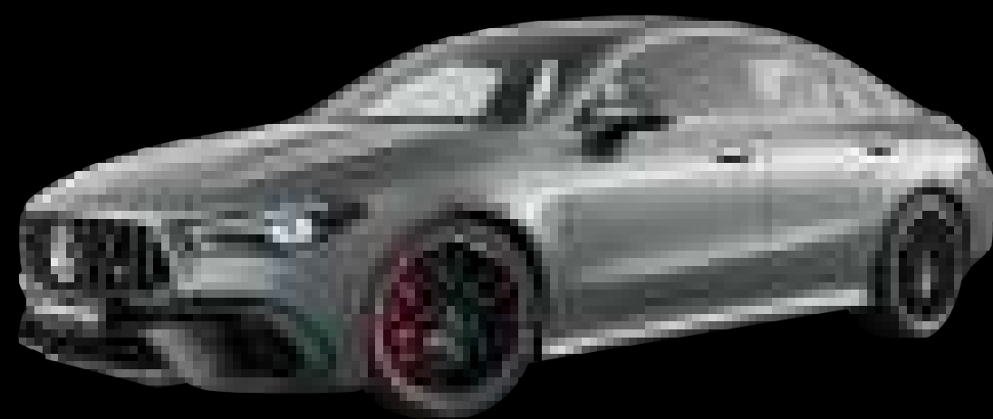
787U - 마운틴 그레이