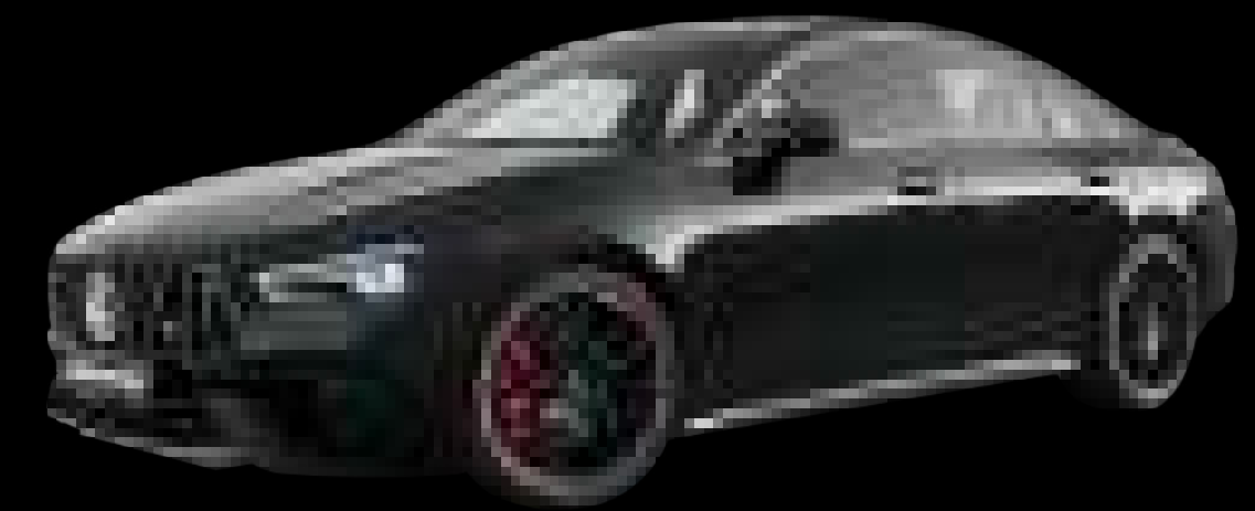
696U - 나이트 블랙