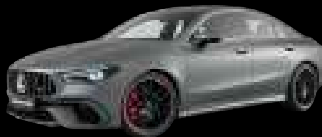
662U - MANUFAKTUR 마운틴 그레이 마그노 (유료옵션)