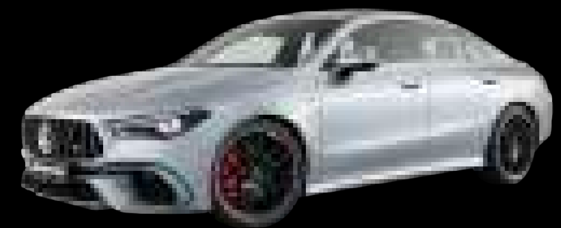
922U - 하이 테크 실버