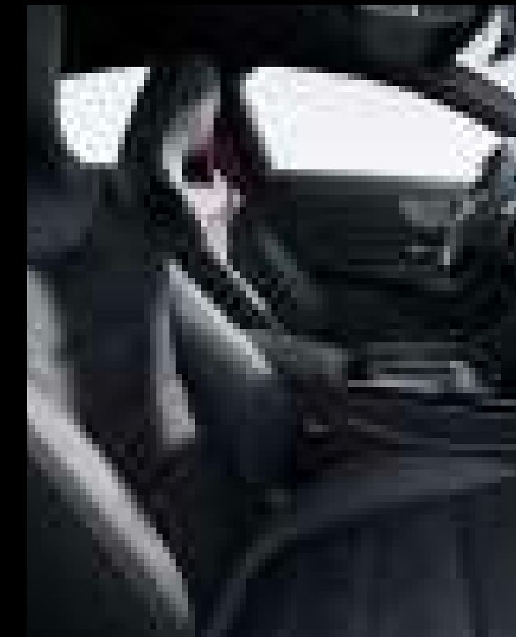
● 651A - 아티코 가죽 마이크로켓 마이크로파이버 블랙 (선택사양)