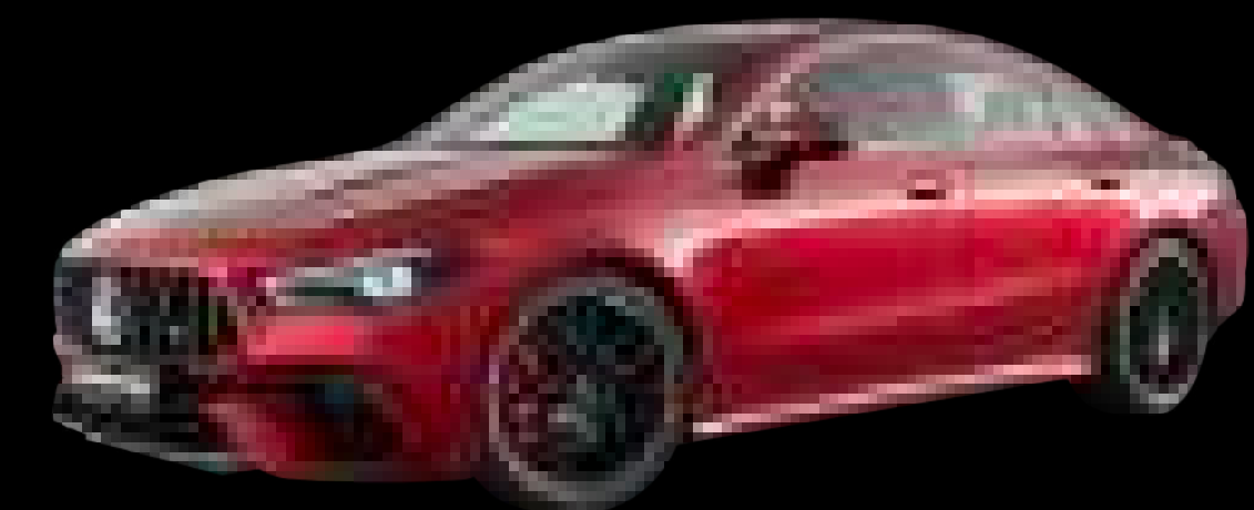
993U - MANUFAKTUR 파타고니아 레드 (유료옵션)