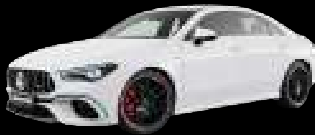
149U - 폴라 화이트