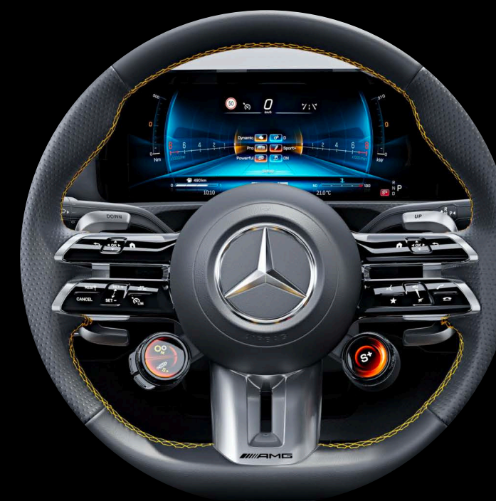
L6J - AMG 퍼포먼스 스티어링 휠, 나파 가죽