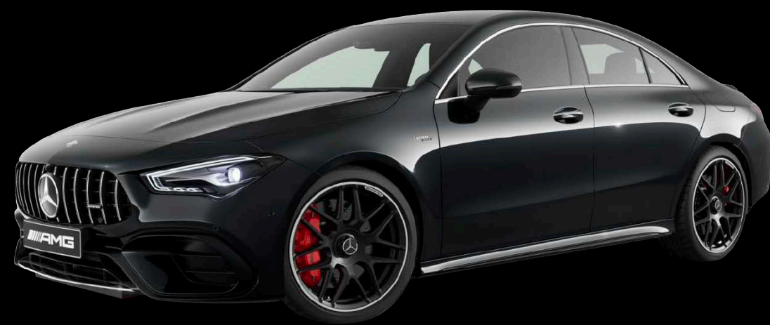
191U - 코스모스 블랙