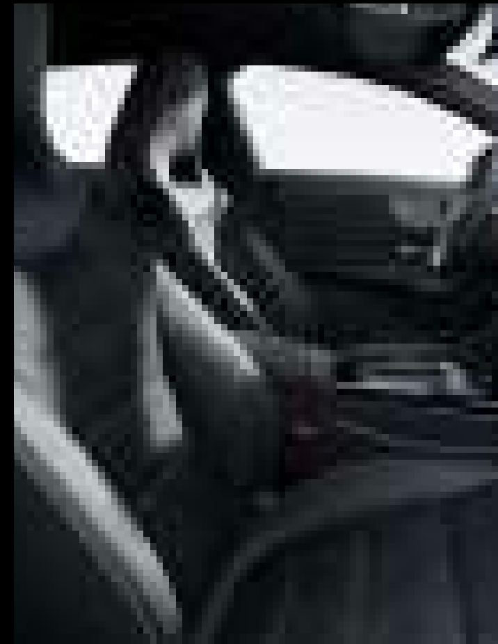
● 671A - 아티코 가죽 마이크로켓 마이크로파이버 AMG 블랙 (기본사양)