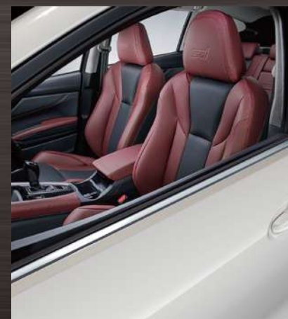
クリスタルホワイト・パール(33,000円高・消費税10%込)