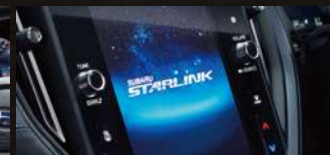
コネクティッドサービス [SUBARU STARLINK]