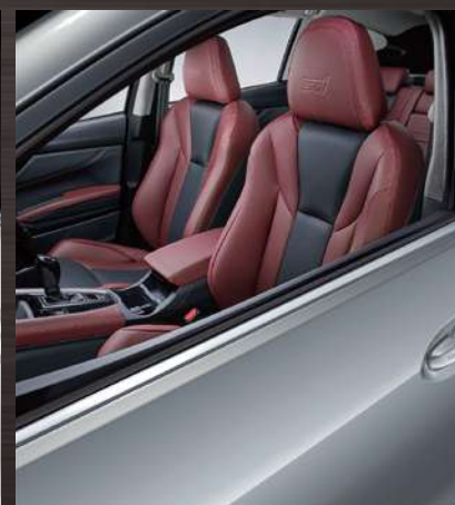
アイスシルバー・メタリック