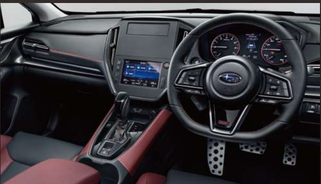
本革シート[ボルドー/ブラック(レッドステッチ)]