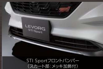
STI Sportフロントバンパー (スカート部：メッキ加飾付)