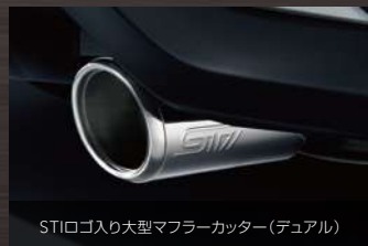
STIロゴ入り大型マフラーカッター(デュアル)