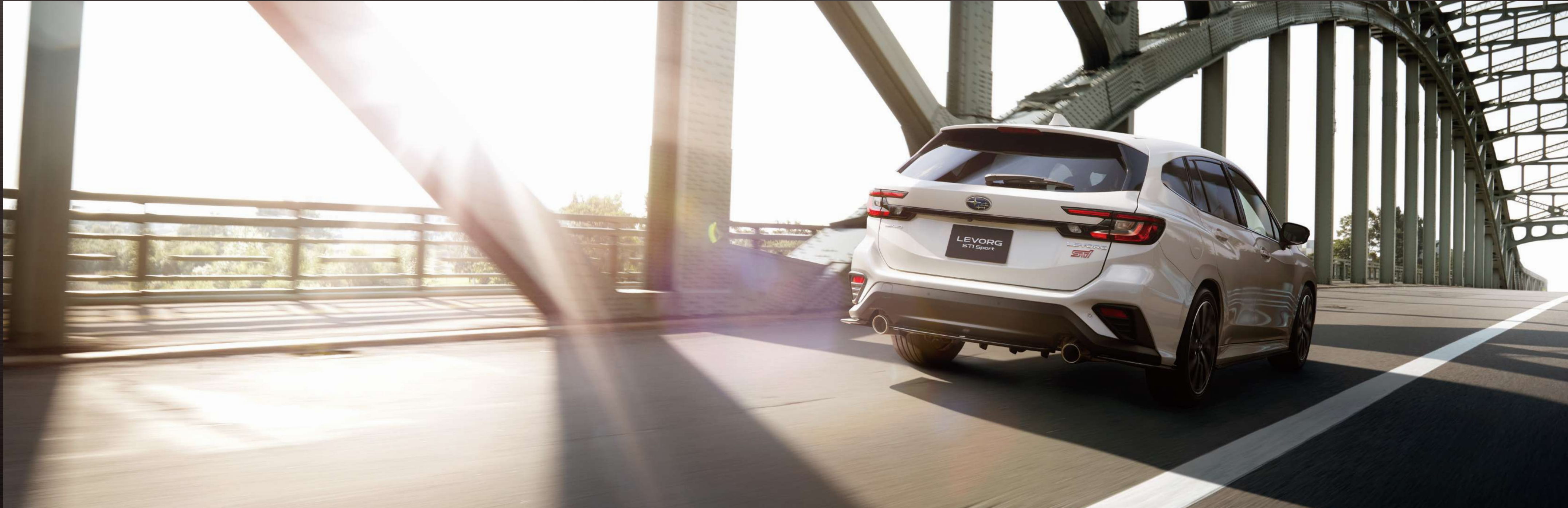
PHOTO:STI Sport EX クリスタルホワイト・パール(33,000円高・消費税10%込) LEDアクセサリライナー、STIフロントアンダースポイラー、STIサイドアンダースポイラー、STIリヤサイドアンダースポイラー、STIリヤアンダースポイラーはディーラー装着オプション 写真はイメージです。