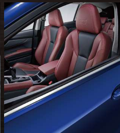
ラビスブルー・パール