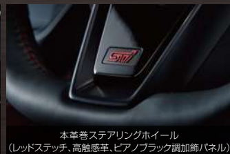
本革巻ステアリングホイール (レッドステッチ、高触感革、ピアノブラック調加飾パネル)