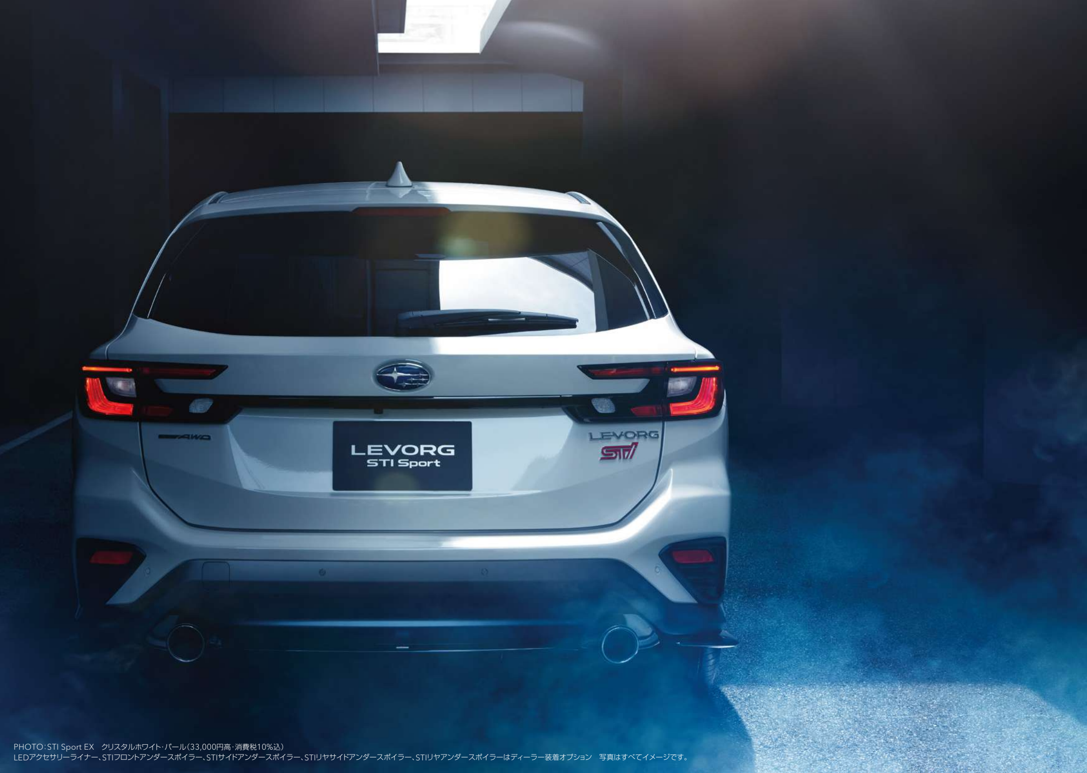
PHOTO: STI Sport EX クリスタルホワイト・パール(33,000円高・消費税10%込) LEDアクセサリライナー、STIフロントアンダースポイラー、STIサイドアンダースポイラー、STIリヤサイドアンダースポイラー、STIリヤアンダースポイラーはディーラー装着オプション 写真はすべてイメージです。