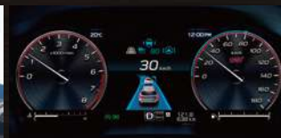
12.3インチフル液晶メーター (レッドリング、STIロゴ入り)