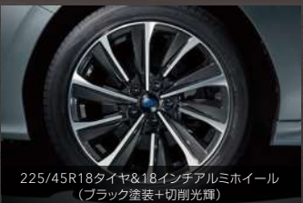
225/45R18タイヤ&18インチアルミホイール (ブラック塗装+切削光輝)