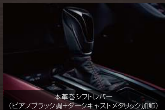
本革巻シフトレバー (ピアノブラック調+ダークキャストメタリック加飾)