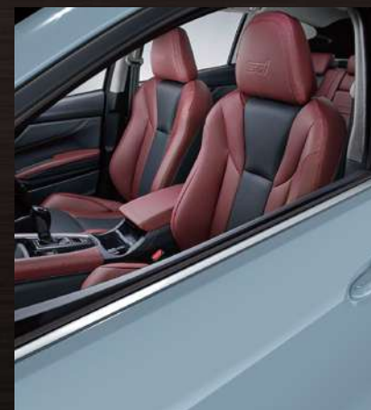
クールグレーカーキ