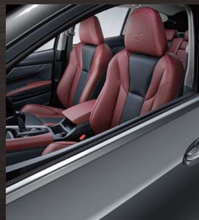
マグネタイトグレー・メタリック