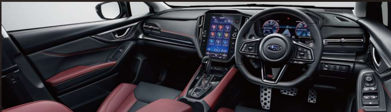
本革シート[ボルドー/ブラック(レッドステッチ)]