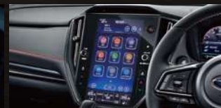
11.6インチセンターインフォメーション ディスプレイ&インフォテインメントシステム