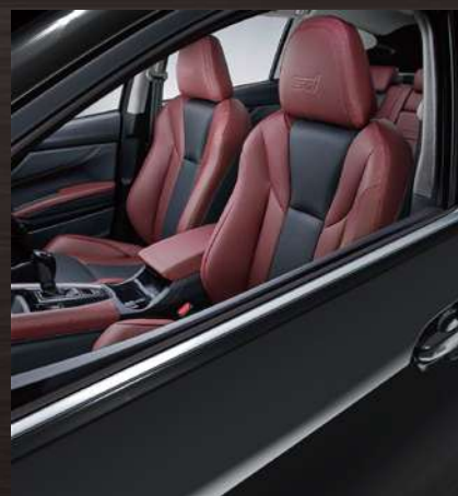
クリスタルブラック・シリカ