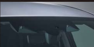
アイサイト コアテクノロジー