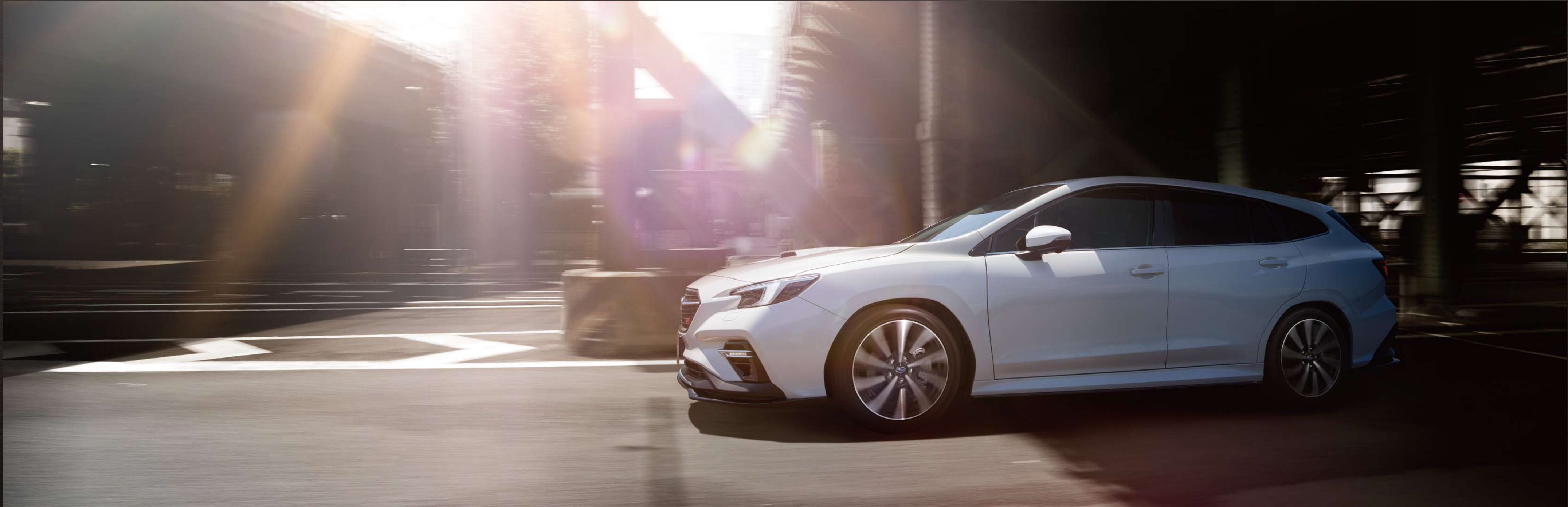
PHOTO:STI Sport EX クリスタルホワイト・パール(33,000円高・消費税10%込) LEDアクセサリライナー、STIフロントアンダースポイラー、STIサイドアンダースポイラー、STIリヤサイドアンダースポイラー、STIリヤアンダースポイラーはディーラー装着オプション 写真はイメージです。