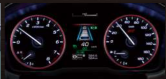
マルチインフォメーションディスプレイ付 ルミネセントメーター (レッドリング照明、STIロゴ入り)