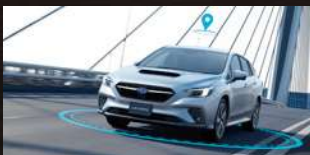
アイサイトX テクノロジー (高度運転支援システム)