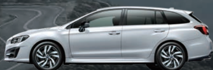
クリスタルホワイトパール(32,400円高・消費税8%込)