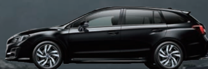
クリスタルブラックシリカ