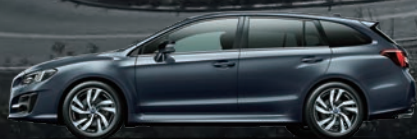
ダークグレー・メタリック