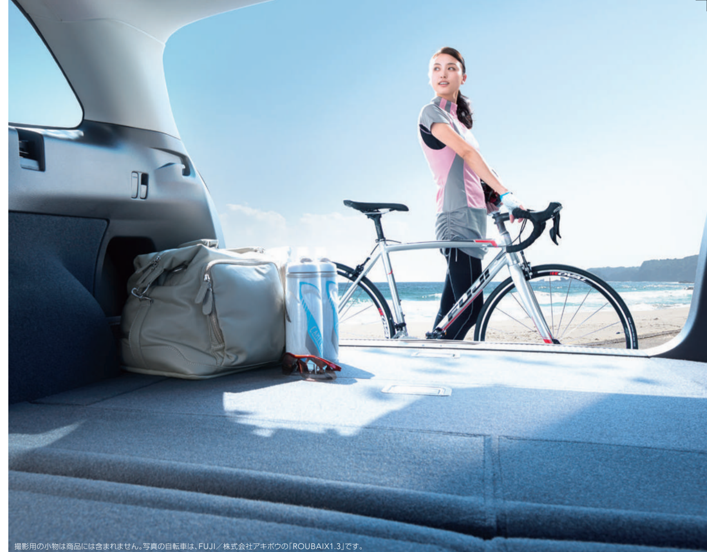
撮影用の小物は商品には含まれません。写真の自転車は、FUJI／株式会社アキボウの「ROUBAIX1.3」です。