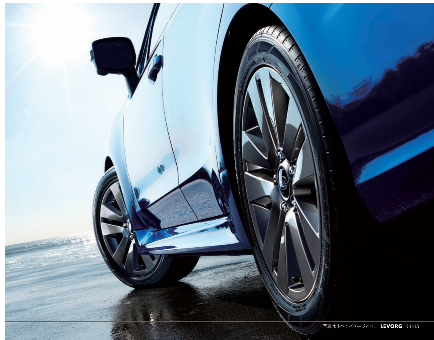
写真はすべてイメージです。 LEVORG 04-05