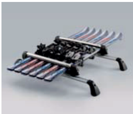
PORTABICICLETAS BAÚL DE CARGA PORTAESQUÍ