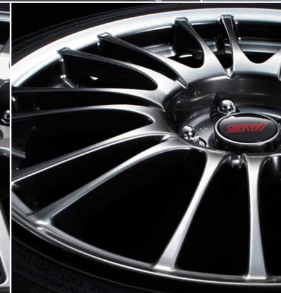
Llantas de aleación de aluminio forjado BBS de 18 pulgadas (Alto lustre, negro)*