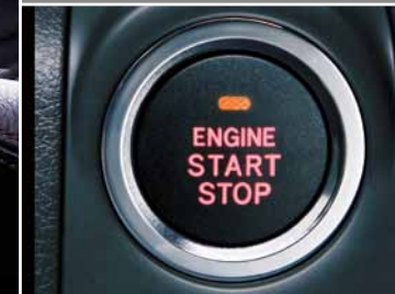
Acceso sin llave y sistema de botón de arranque