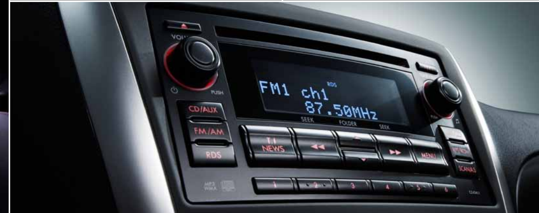
Sistema de audio de primera calidad con 10 altavoces

*1 Bluetooth® es una marca registrada de Bluetooth SIG, Inc. América. *2 Opcional. Alcantara® es una marca registrada de Alcantara S.p.A. *3 Opcional