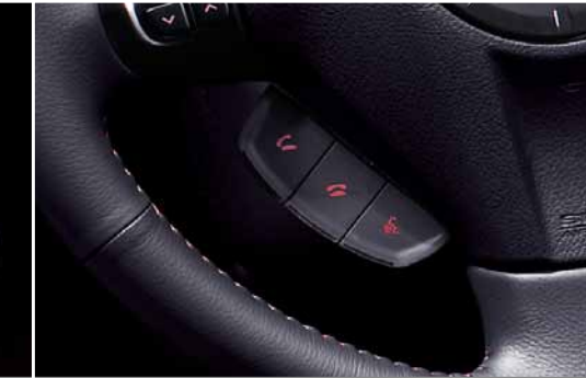
Sistema de manos libres Bluetooth®*1