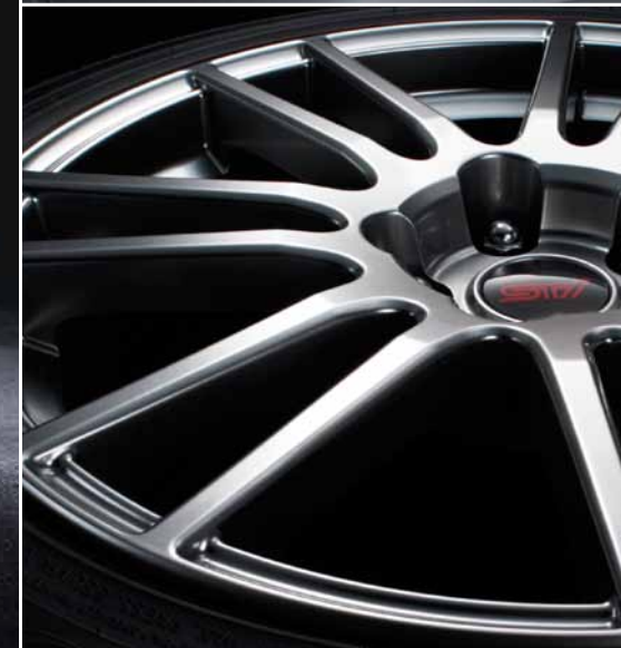
Llantas de aleación de aluminio de 18 pulgadas (Alto lustre)