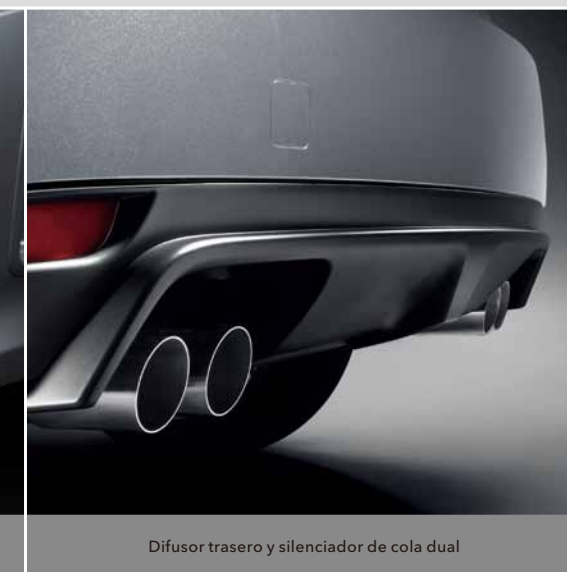
Difusor trasero y silenciador de cola dual