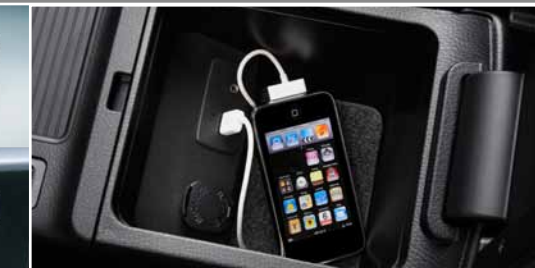
Sistema auxiliar de sonido y entrada USB