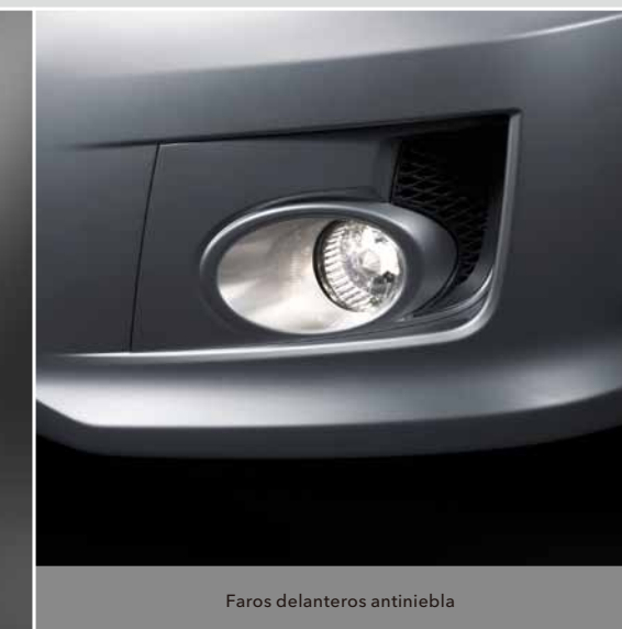
Faros delanteros antiniebla