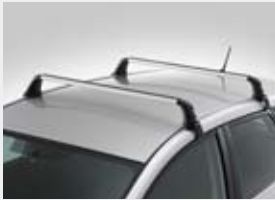
Barres de toit