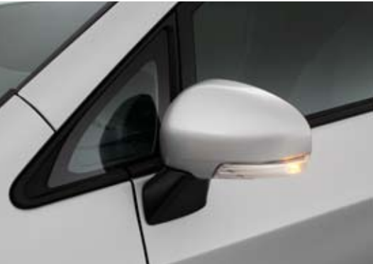
Rétroviseurs électriques chauffants avec clignotants intégrés

La généreuse boîte à gants de la Trezia est complétée par un vaste compartiment supérieur permettant de loger une boîte de mouchoirs en papier. En outre, un grand casier ouvert offre un espace de rangement supplémentaire et très pratique au conducteur et au passager avant.