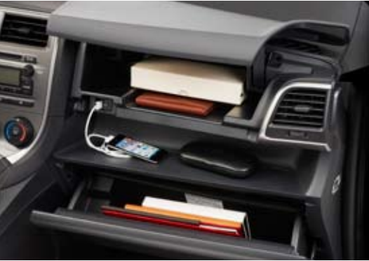
Multiplés rangements de planche de bord

Les lecteurs de musique mobiles peuvent être facilement branchés sur la prise audio auxiliaire disponible à bord de chaque Trezia. La Trezia S offre également une prise USB, une fonction audio streaming sans fil Bluetooth* 2 ainsi que la possibilité d'afficher la couverture de l'album écouté lors du branchement d'un iPod.* 3