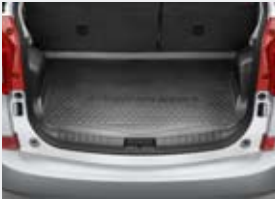
Protection de coffre plastique

Fuji Heavy Industries Ltd se réserve le droit de modifier les caractéristiques techniques et équipements sans préavis. Le détail des caractéristiques techniques et équipements, la disponibilité des coloris et la gamme des accessoires peuvent également varier en fonction des conditions et exigences locales. Veuillez contacter votre distributeur agréé pour obtenir les détails des modifications applicables à votre pays.