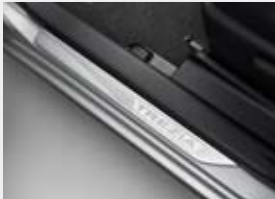
Seuils de portes