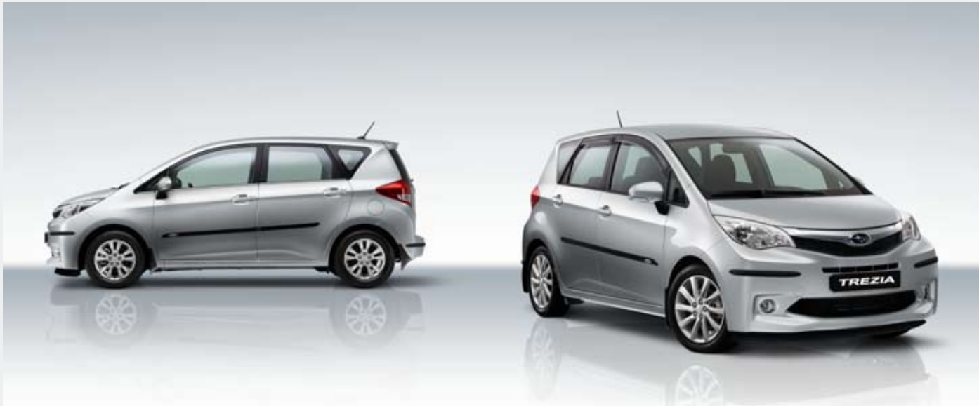
Véhicule de gauche : enjoliveurs de vitres latérales, moulures latérales, protections d'angles de pare-chocs (avant/arrière), jantes alliage (15") et jeu de bavettes. Véhicule de droite : jantes alliage (16"), déflecteurs de vitres latérales, moulures latérales, protections d'angles de pare-chocs (avant/arrière) et jeu de bavettes.

Une importante gamme d'accessoires haute qualité vous permet d'adapter davantage votre Trezia à votre mode de vie. Ces accessoires à la fois élégants, pratiques et intelligents vous apportent encore plus de confort, fonctionnalité et esthétique. Pour de plus amples détails, consultez la brochure accessoires ou adressez-vous à votre distributeur Subaru le plus proche.