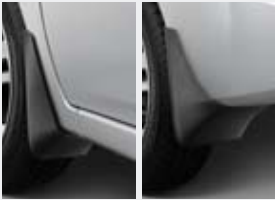
Jeu de bavettes