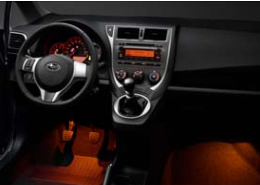
Eclairage du bas habitacle

Chacun des quatre casiers de porte comprend un porte-bouteille de 500 ml et un vaste vide-poche. Les casiers des portes avant de taille A4 sont suffisamment grands pour accueillir des objets tels que le guide d'utilisation du véhicule, un cahier, des cartes routières ou des magazines.