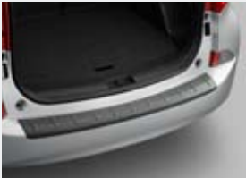
Seuil de coffre