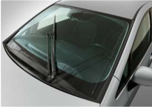
Essuie-glace unique de pare-brise

Les antibrouillards multiréfecteurs émettent un faisceau large et plat qui limite l'éblouissement dans le brouillard pour une sécurité renforcée.