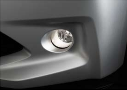
Antibrouillards avant (modèles L)

La Trezia maintient quelques instants ses phares allumés après le verrouillage de ses portes.