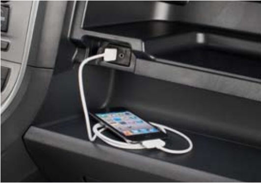
Prises audio USB et auxiliaire

Pour vous permettre de trouver votre position de conduite optimale, le volant des Trezia L et S est réglable en hauteur et en profondeur.