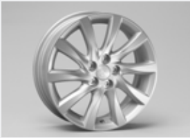
Jantes alliage (16 pouces)