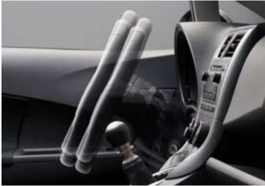
Colonne de direction réglable

Un essuie-glace unique et léger à éléments multiples balaie une large portion du pare-brise, avant de regagner son logement, garantissant une meilleure protection des piétons en cas de choc.