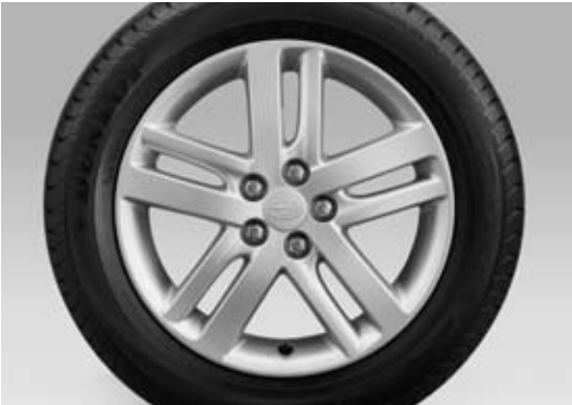
Jantes en alliage 16"

Les rétroviseurs extérieurs électriques implantés dans les portes offrent un large champ de vision grâce à leur forme compacte et aérodynamique. Ils sont dotés de série de répéteurs latéraux de clignotants et de miroirs chauffants.