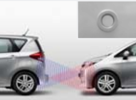
Aide au stationnement (avant/arrière)