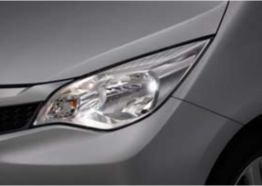
Projecteurs à extinction différée

La Trezia maintient quelques instants ses phares allumés après le verrouillage de ses portes.