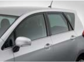
Enjoliveurs de vitres latérales effet chrome