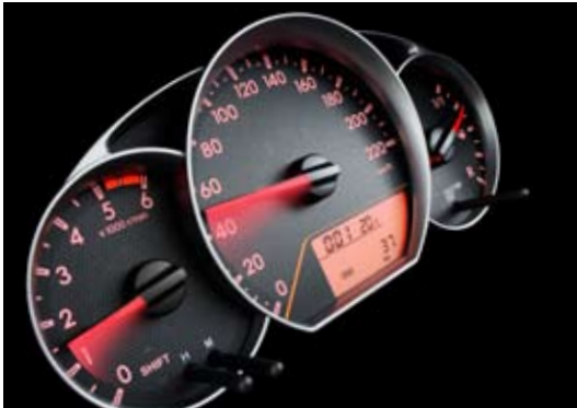
Combiné des instruments haute qualité à trois cadrans indépendants

Disponibles de série sur les modèles Trezia L, ces jantes en alliage à 5 rayons doubles rehaussent tant l'esthétique que la tenue de route du véhicule.