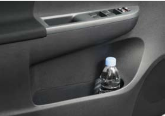
Casiers de porte avec porte-bouteilles

La console centrale intègre deux porte-gobelets avant très facilement accessibles tout en étant suffisamment éloignés des commandes et des vêtements du conducteur et du passager avant. Un troisième porte-gobelet très pratique implanté à l'arrière de la console est également prévu pour les passagers des sièges arrière.