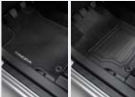
Tapis de sol (moquette/caoutchouc)