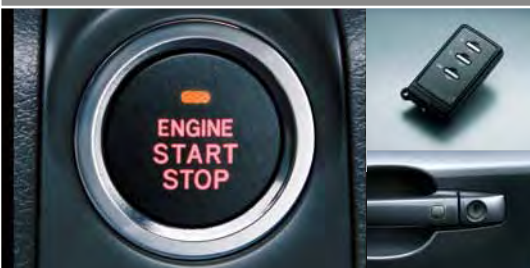
Dostęp bez kluczyka, rozruch przy użyciu przycisku