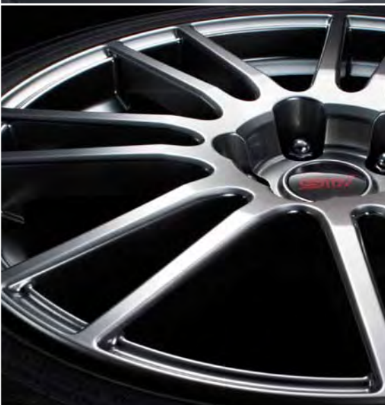
18-calowe, polerowane felgi aluminiowe.