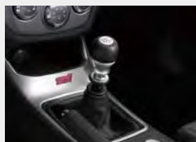
Aluminiowo-skórzana końcówka drążka zmiany biegów (6MT)