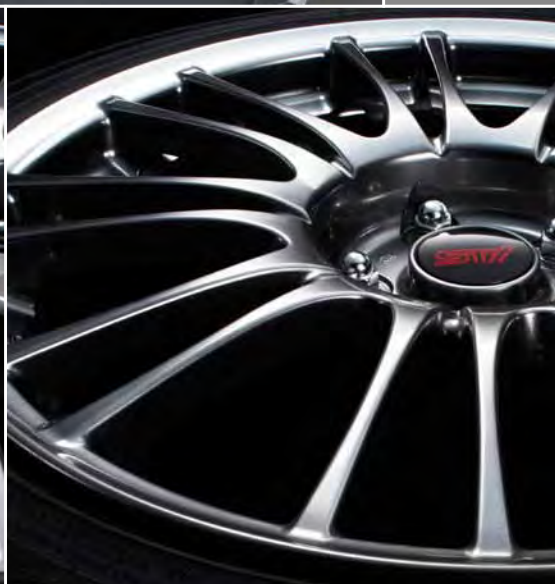
18-calowe, czarne, polerowane felgi aluminiowe firmy BBS*, z prasowanego lekkiego stopu.