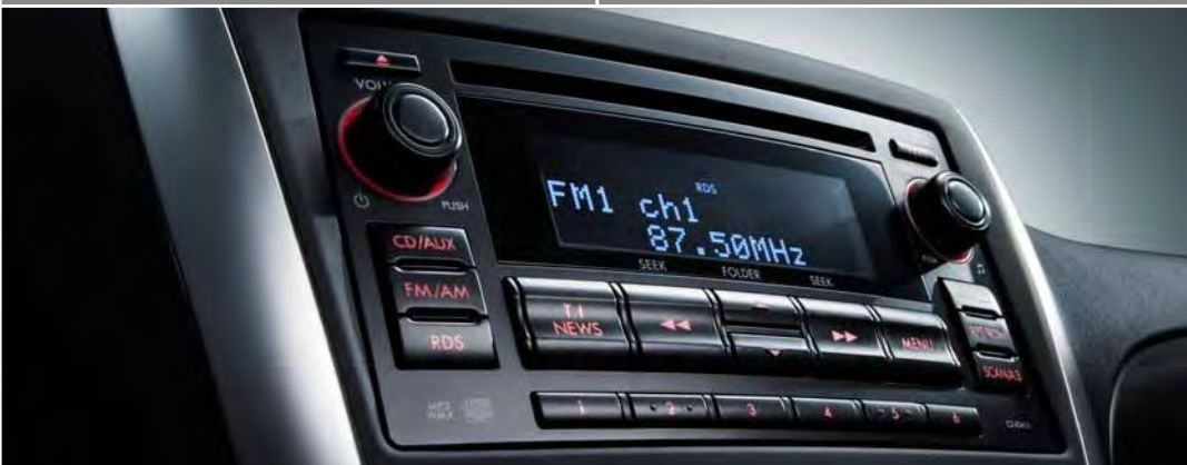
Wysokiej jakości, 10-głośnikowy system audio