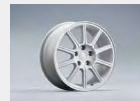
17-calowe, 10-ramienne felgi aluminiowe

Fuji Heavy Industries Ltd. podjęło wszelkie środki, aby zawarte w niniejszej broszurze informacje były dokładne i aktualne w chwili oddania do druku. W ramach polityki stałego ulepszania swoich produktów Fuji Heavy Industries Ltd. zastrzega sobie prawo do zmiany specyfikacji i wyposażenia opisanych i przedstawionych pojazdów bez uprzedzenia. O zmianach tych autoryzowani partnerzy Subaru będą powiadamiani w możliwie najkrótszym terminie. Pokazane przykłady wyposażenia mogą się różnić w zależności od lokalnych warunków rynkowych danego państwa. Dokładna i najbardziej aktualna lista specyfikacji i wyposażenia poszczególnych wersji jest dostępna u lokalnego autoryzowanego partnera Subaru. Zdjęcia znajdujące się w tej broszurze zostały zamieszczone tylko dla celów ilustracyjnych. Ze względu na ograniczenia techniczne druku kolory widoczne na ilustracjach mogą się różnić od rzeczywistych kolorów lakierów lub materiałów wykończenia wnętrza. Wszelkie prawa zastrzeżone. Powielanie w jakiegokolwiek postaci, jakiegokolwiek techniką, w całości lub we fragmentach bez pisemnego zezwolenia Subaru jest zabronione. Niniejsza broszura nie stanowi oferty sprzedaży w rozumieniu prawa.