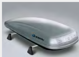
Bagażnik dachowy (boks, długi)