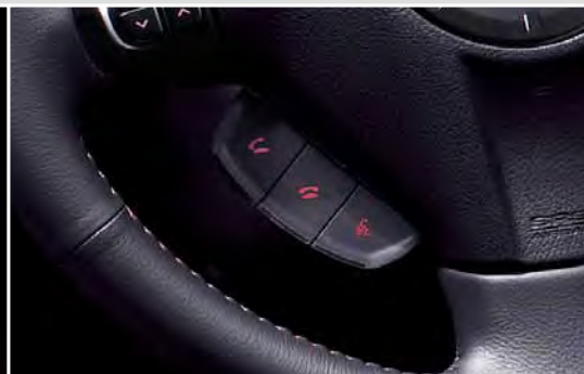
System głośnomówiący oparty na technologii Bluetooth®*1