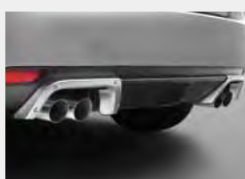
Ozdobne wykończenie układu wydechowego