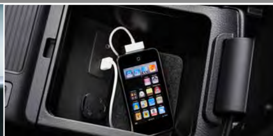
Dodatkowe złącze USB audio