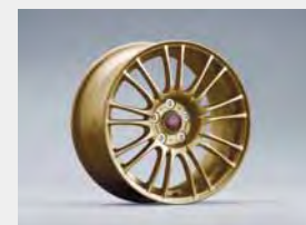
18-calowe, 9-ramienne złote felgi aluminiowe