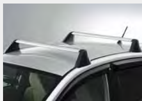
Aluminiowe uchwyty do montażu bagażnika dachowego