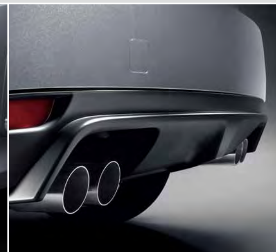
Tylny dyfuzor i układ wydechowy z czterema końcówkami.