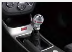
Aluminiowa końcówka drążka zmiany biegów