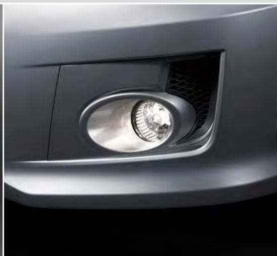
Przednie światła przeciwmgłowe.