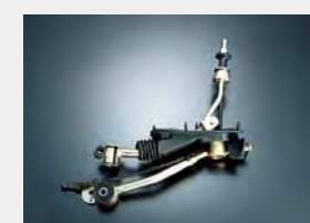
Sportowa dźwignia zmiany biegów