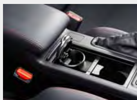
Popielniczka w konsoli środkowej