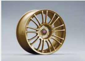
Jante aluminium 9 double branches, Or (18")