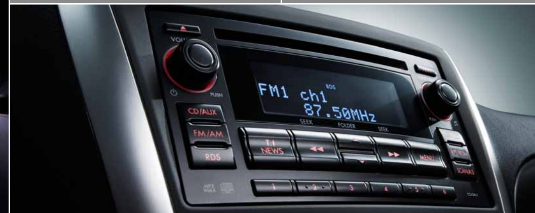
Système audio haut de gamme à 10 haut-parleurs