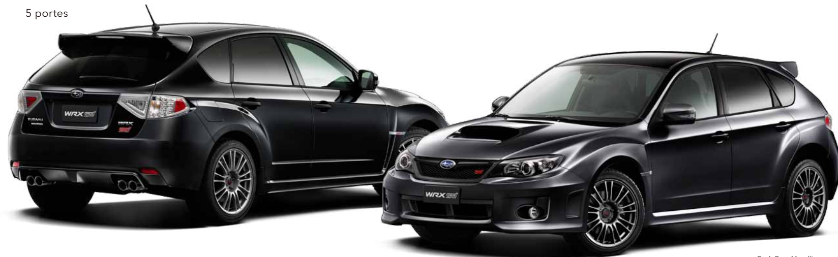
Dark Grey Metallic