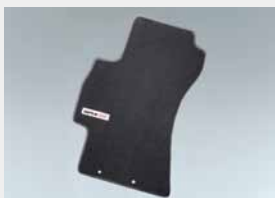
Jeu de tapis