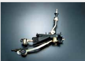
Levier de vitesses rapide (BVM6)