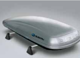
Coffre de toit (grand modèle)