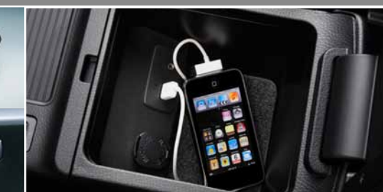
Prise audio auxiliaire et prise USB