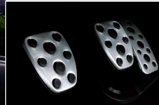
Pédalier en aluminium