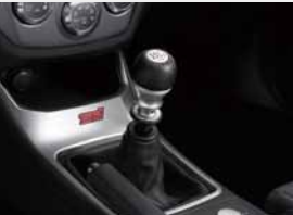
Pommeau de levier de vitesse aluminium et cuir (BVM6)