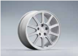
Jante aluminium 10 Blanc, blanche (17")