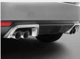
Entourages sorties d'échappements