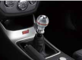
Pommeau de levier de vitesse sport rouge (BVM6)