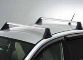
Jeu de barres de toit aluminium