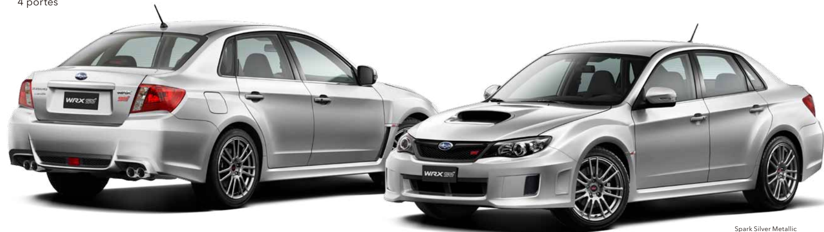
Spark Silver Metallic