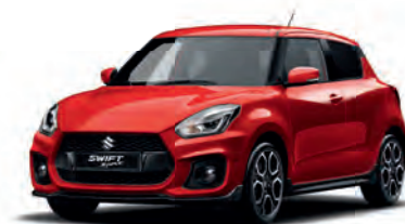
Burning Red Pearl Metallic