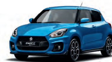
Speedy Blue Metallic