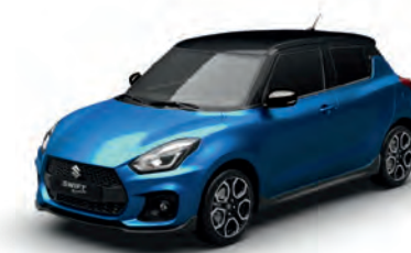
Speedy Blue Metallic/ Super Black Pearl Metallic

Metallic-Lackierung und Zweifarben-Lackierung nur gegen Aufpreis. Die abgebildeten Farben können aus drucktechnischen Gründen nur Anhaltspunkte für die Lackierung sein.