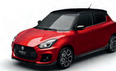
Burning Red Pearl Metallic/ Super Black Pearl Metallic