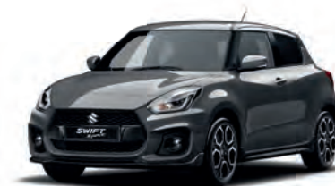
Mineral Gray Metallic