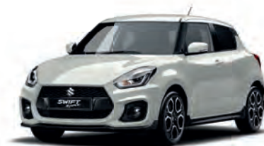
Pure White Pearl Metallic