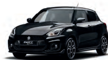
Super Black Pearl Metallic