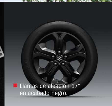
■ Llantas de aleación 17" en acabado negro.

Una delantera finamente cincelada, proyectores LED con protectores en rojo, llantas de aleación negras, interior con detalles en rojo y pedales en acabado aluminio. Un diseño exterior audaz, un interior deportivo y un motor turbo de inyección directa bajo el capó. Todo ofrece una experiencia de conducción de gran alcance. La versión S del Suzuki Vitara hace honor a todas sus expectativas.