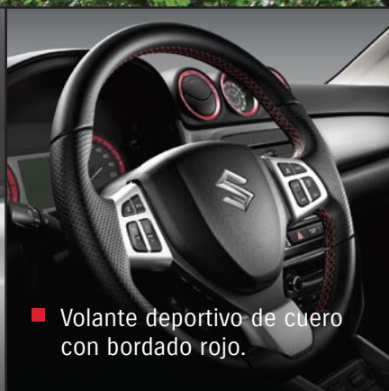
■ Volante deportivo de cuero con bordado rojo.