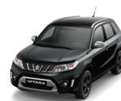
Negro Cósmico Perlado Metalizado (ZCE)