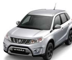
Plata Seda Metalizado 2 (ZCC)