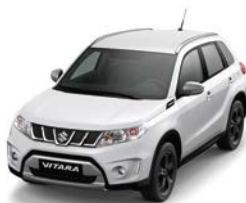
Blanco Perlado (ZNL)