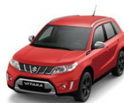
Rojo Bright (ZCF)