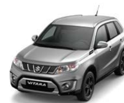
Gris Galáctico Metalizado (ZCD)