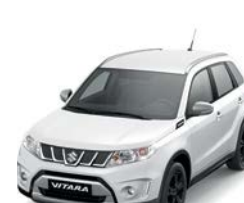
Blanco Superior (26U)