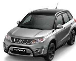
Gris Galáctico Metalizado / Negro Cósmico Perlado Metalizado (A9G)