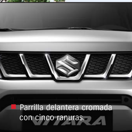
■ Parrilla delantera cromada con cinco ranuras.