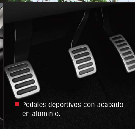
■ Pedales deportivos con acabado en aluminio.