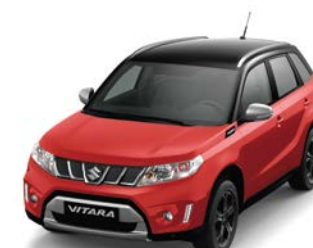
Rojo Bright / Negro Cósmico Perlado Metalizado (A9H)