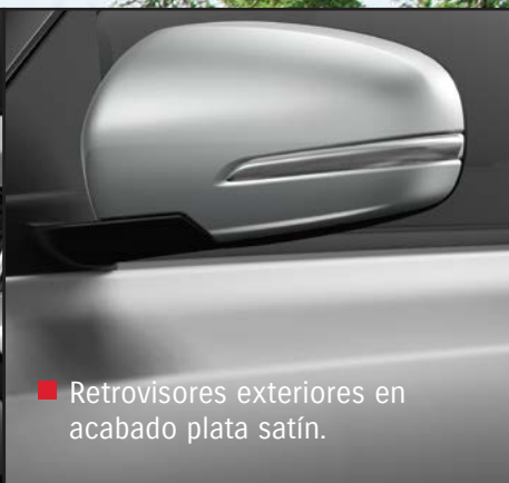
■ Retrovisores exteriores en acabado plata satín.