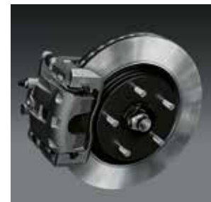
Disques avant 16" ventilés

Les projecteurs à LED intelligents dont est dotée la nouvelle Swift Sport, garantissent une sécurité optimale de jour comme de nuit. Enfin, avec sa double sortie d'échappement, la Swift Sport est une berline unique, combinaison d'élégance et de performance.