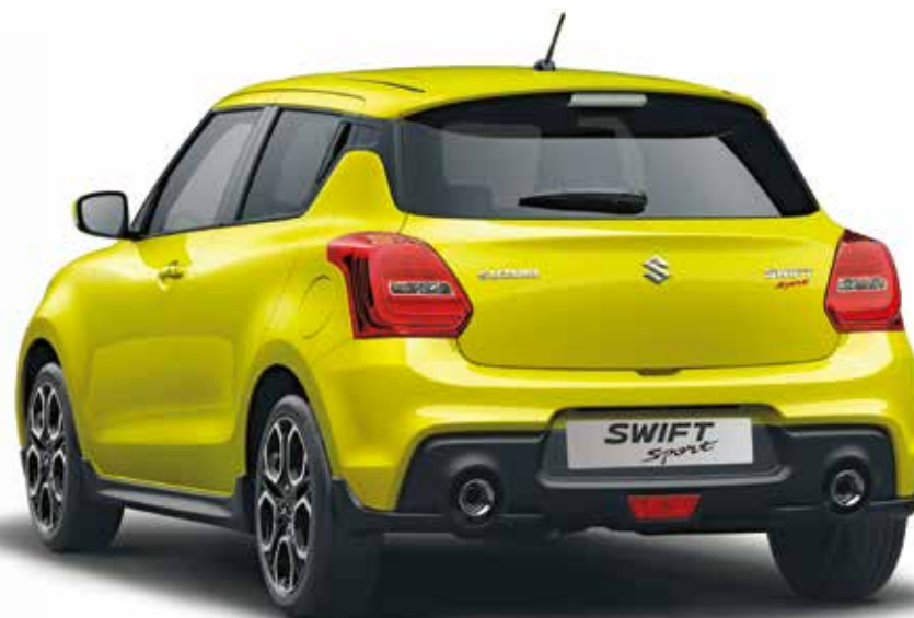
Champion Yellow (ZFT)