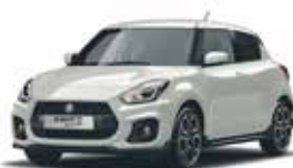
Pure White Pearl (ZVR)