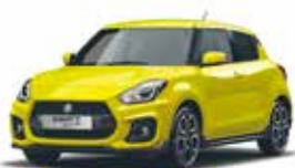
Champion Yellow (ZFT)