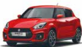
Burning Red Pearl Metallic (ZWP)