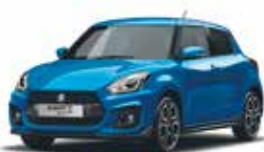
Speedy Blue Metallic (ZWG)