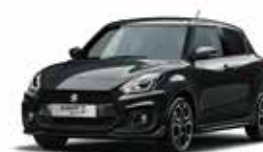
Super Black Pearl (ZMV)