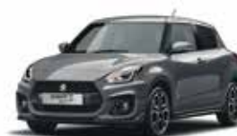
Mineral Gray Metallic (ZMW)