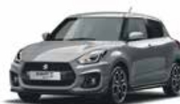
Premium Silver Metallic (ZNC)