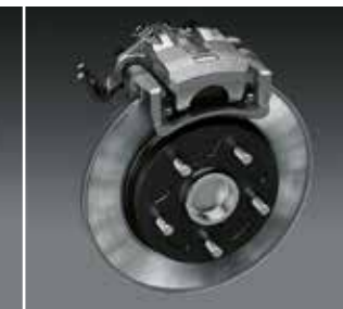
Disques arrière 15"