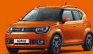
FLAME ORANGE PEARL MÉTALLISÉE