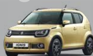
HELIOS GOLD PEARL MÉTALLISÉE