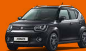
SUPER BLACK PEARL MÉTALLISÉE