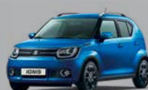
SPEEDY BLUE MÉTALLISÉE