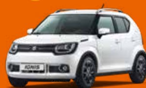
PURE WHITE PEARL MÉTALLISÉE