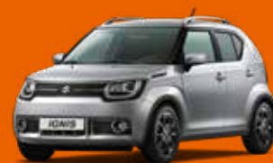
PREMIUM SILVER MÉTALLISÉE