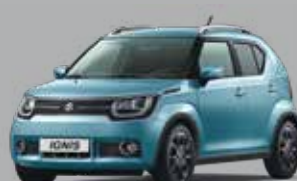
NEON BLUE MÉTALLISÉE