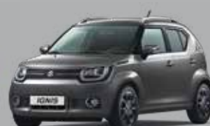
MINERAL GRAY MÉTALLISÉE