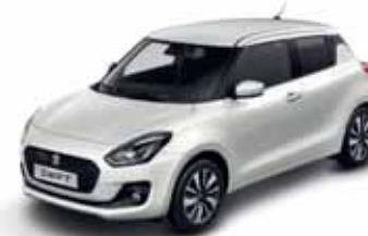
PURE WHITE PEARL MÉTALLISÉE