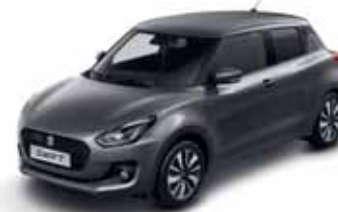
MINERAL GREY MÉTALLISÉE