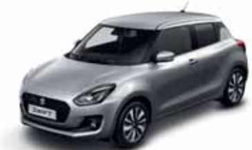
PREMIUM SILVER MÉTALLISÉE