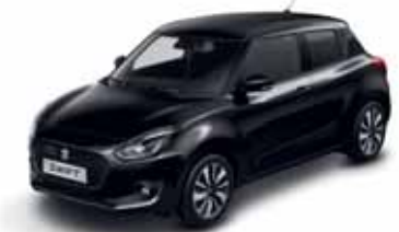
SUPER BLACK PEARL MÉTALLISÉE