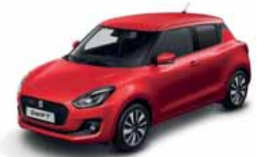
BURNING RED PEARL MÉTALLISÉE