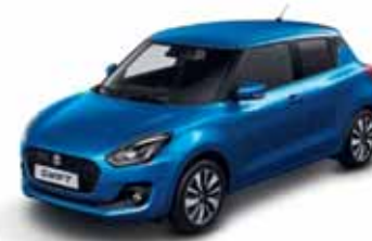
SPEEDY BLUE MÉTALLISÉE