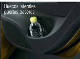
Huecos laterales puertas traseras