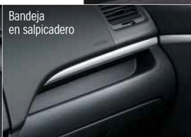
Bandeja en salpicadero