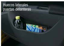
Huecos laterales puertas delanteras