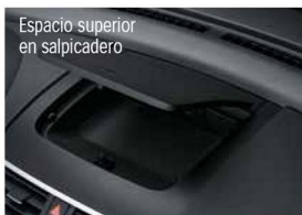
Espacio superior en salpicadero