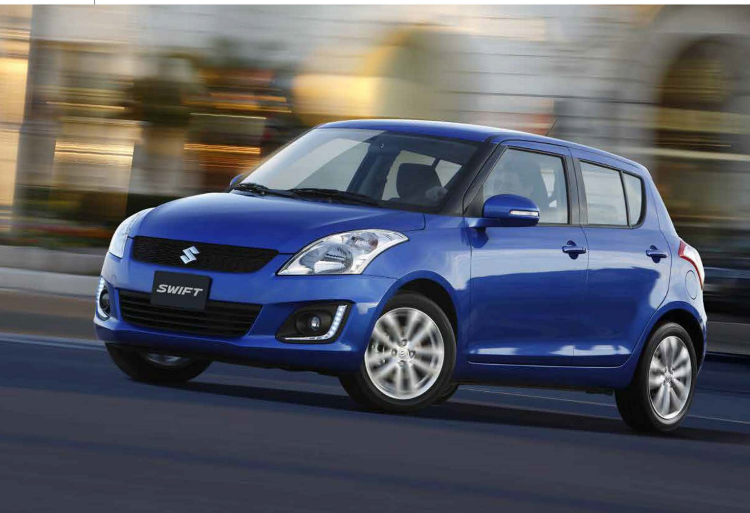
K12B Motor de gasolina 1.2 l.