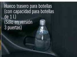
Hueco trasero para botellas (con capacidad para botellas de 1 l) (Sólo en versión 3 puertas)