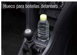
Hueco para botellas delantero