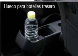
Hueco para botellas trasero