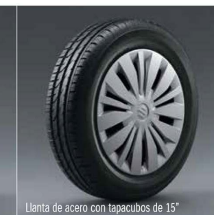
Llanta de acero con tapacubos de 15"