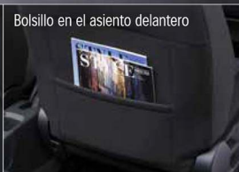
Bolsillo en el asiento delantero