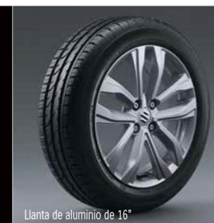
Llanta de aluminio de 16"