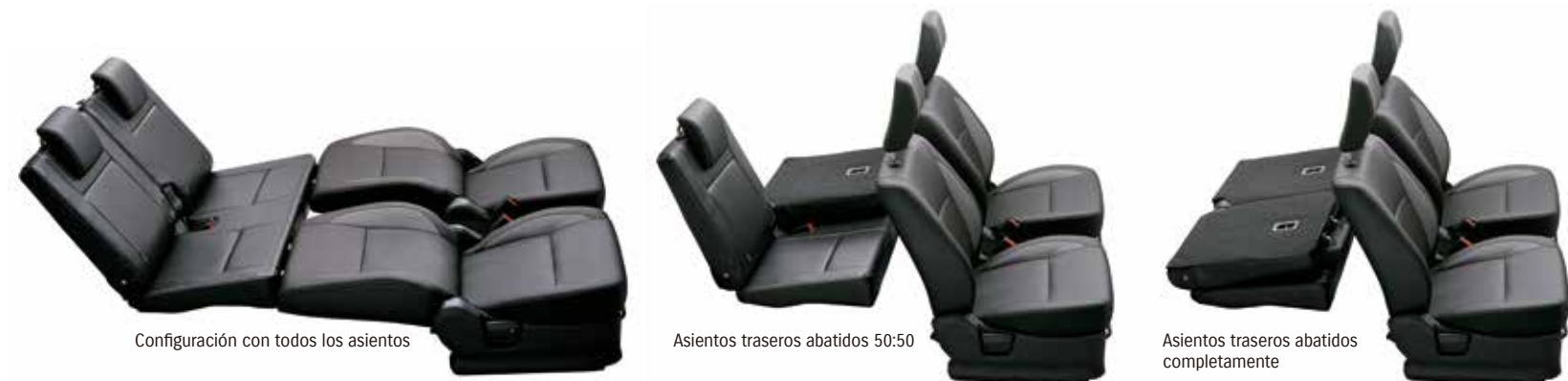
Configuración con todos los asientos

El Suzuki Jimny cuenta con un completo equipamiento que incluye, según versiones: aire acondicionado, asientos en cuero sintético, elevalunas eléctricos, radio CD con puerto USB, bluetooth, faros antiniebla, cristales tintados, rueda de repuesto, etc.