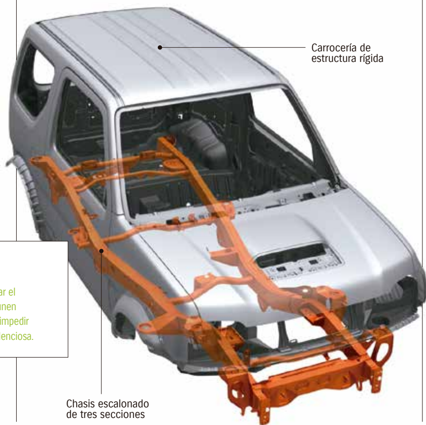
Chasis escalonado de tres secciones

A 34° Ángulo de ataque B 31° Ángulo ventral C 46° Ángulo de salida