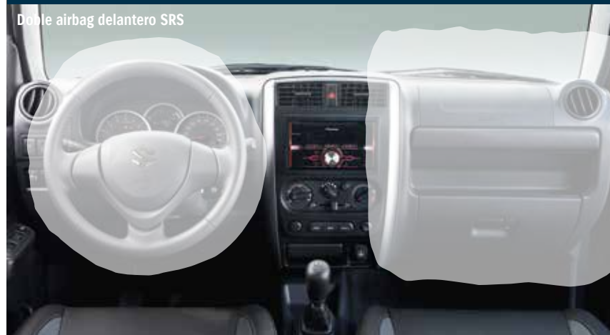
Doble airbag delantero SRS

Las puertas cuentan con barras laterales de absorción de impactos; la carrocería y el bastidor están diseñados para absorber la fuerza de un choque frontal y propagarla lejos de los ocupantes gracias al uso de tecnología CAE (Computer-Aided Engineering).