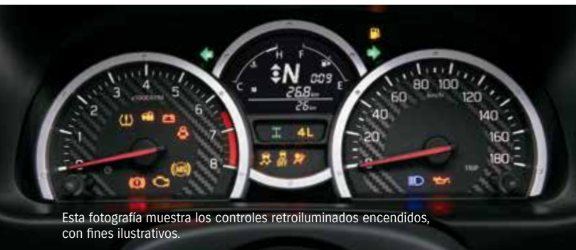
Esta fotografía muestra los controles retroiluminados encendidos, con fines ilustrativos.