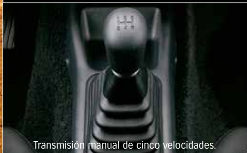
Transmisión manual de cinco velocidades.