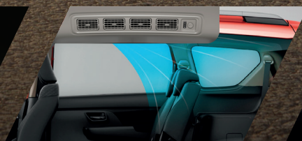
SALIDA DE AIRE ACONDICIONADO POSTERIOR