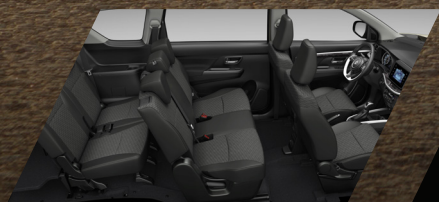
7 PASAJEROS TERCERA FILA DE ASIENTOS