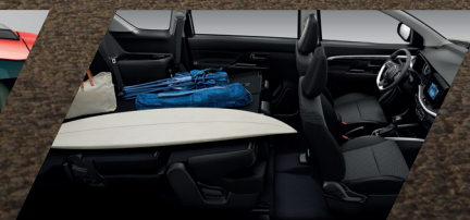
CAPACIDAD DE MALETERO DE HASTA 803 LTS