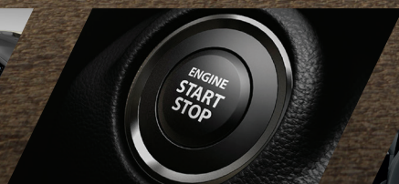
LLAVE INTELIGENTE CON BOTÓN DE ENCENDIDO