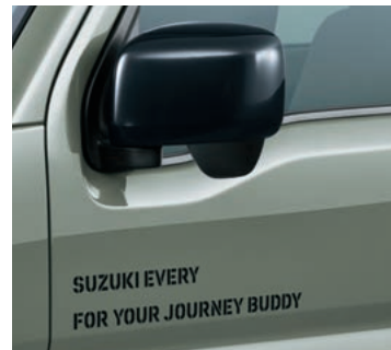
■ドアミラー[ブラック塗装]/専用デカール