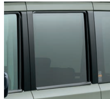
■B/Cピラーブラックアウト