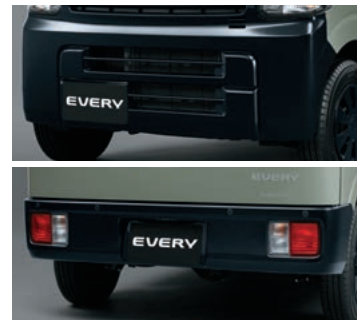
■バンパー[ブラック塗装](フロント、リヤ)