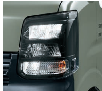
■専用LEDヘッドランプ[ブラック塗装]