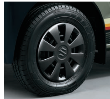
■フルホイールキャップ[ガンメタリック塗装]