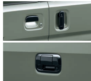
■ドアハンドル[ブラック塗装](フロント、リヤ、バック)