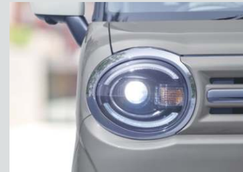
■LEDヘッドランプ [ハイ/ロービーム、オートレベリング機構付]