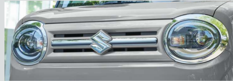
■専用フロントグリル[車体色&メッキ]