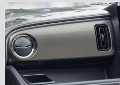
■インパネカラーパネル [チタニウムグレー] ■インパネカラーパネルガーニッシュ[サテndaークシルバー]