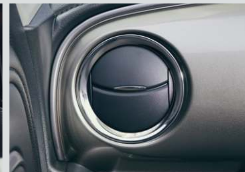
■エアコンサイドルーバーガーニッシュ [ダーククロームメッキ調]