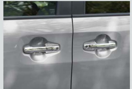
■メッキドアハンドル