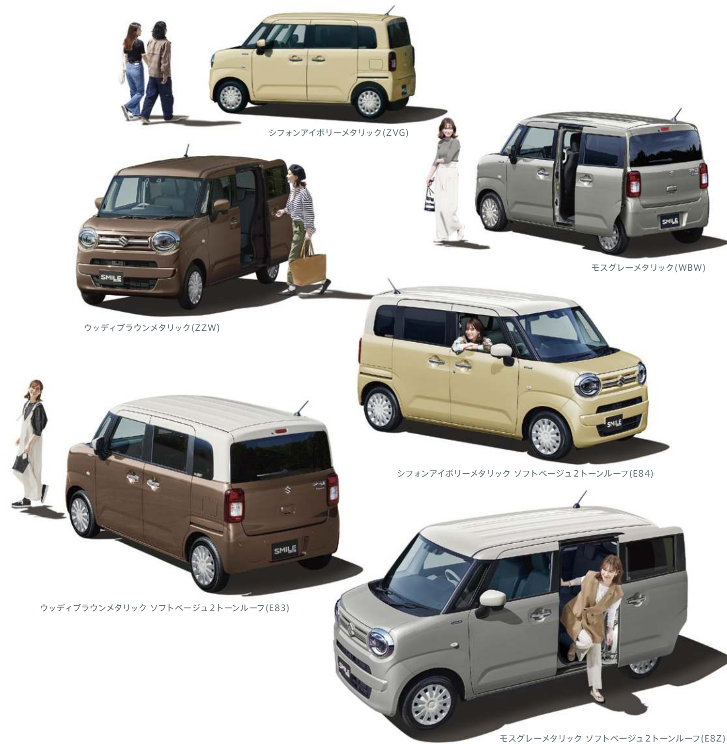
シフォンアイボリーメタリック (ZVG)