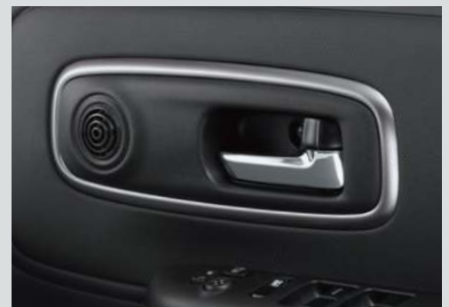
■メッキインサイドドアハンドル(運転席、助手席) ■ドアトリムカラーガーニッシュ [サテndaークシルバー] (運転席、助手席)