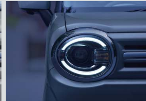
■LEDポジションランプ