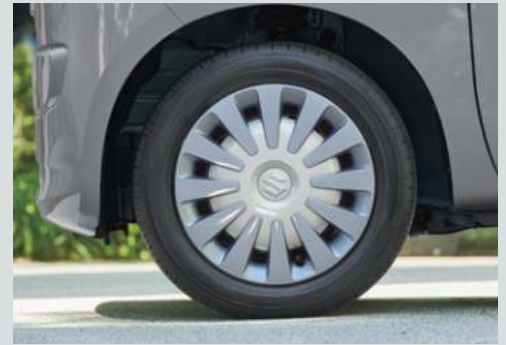
■専用14インチフルホイールキャップ[シルバー×ソフトベージュ]