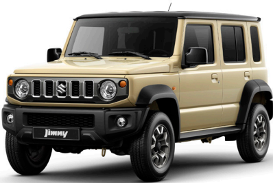
العاجي الفاتح والمعدني القوام مع الأسود المائل إلى أزرق Chiffon Ivory Metallic + Bluish Black Pearl (E5J)