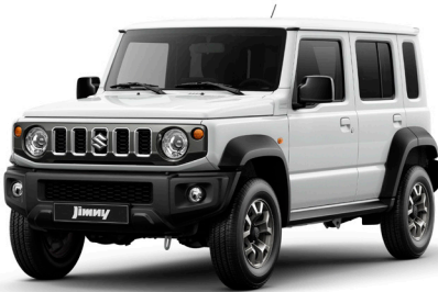
الأبيض النقي واللامع Arctic White Pearl (ZHU)