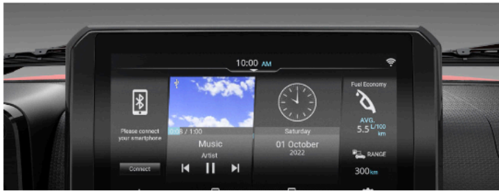
LCD display | شاشة عرض بلورة سائلة