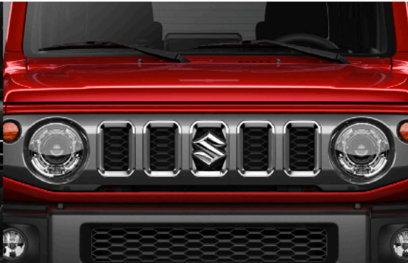
Headlamp | المصباح الأمامي