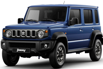
الأزرق الداكن واللامع والمعدني القوام Celestial Blue Pearl Metallic (WBH)