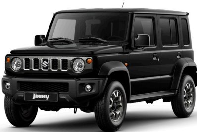
الأسود اللامع المائل إلى أزرق Bluish Black Pearl (WB3)