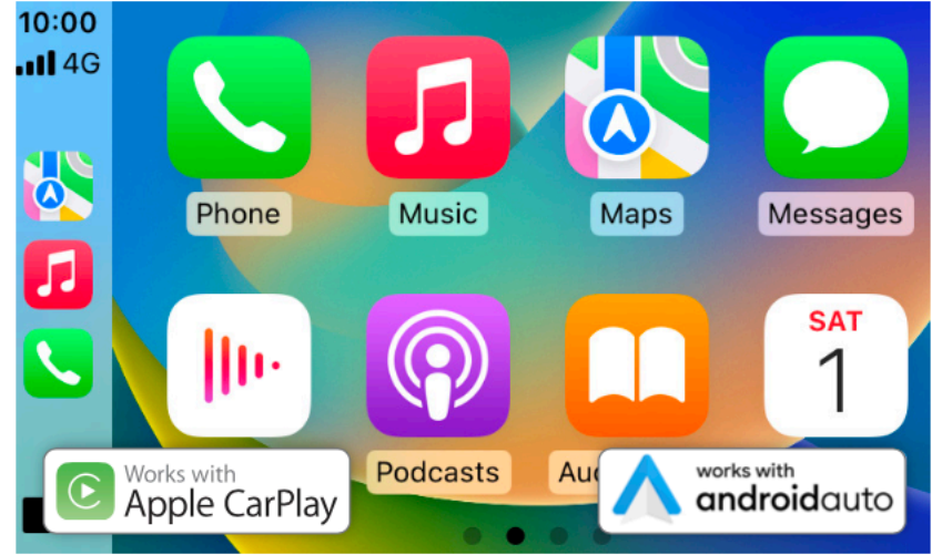
9 Inch Display audio | شاشة 9 بوصة