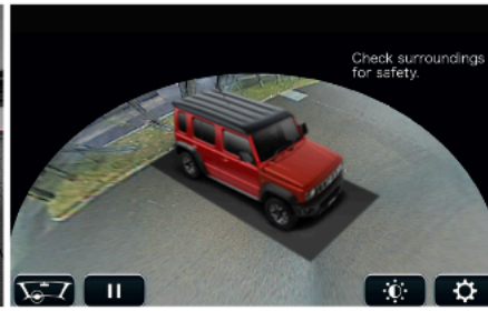
360 View camera | رؤية ثلاثية الأبعاد