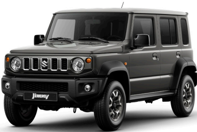
الرمادي المعدني القوام Granite Gray Metallic (ZTN)