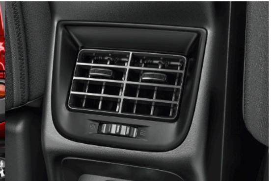
Rear AC vents | فتحات تكييف خلفية