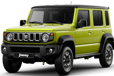
الأصفر القوي والمعدني القوام مع الأسود المائل إلى أزرق Kinetic Yellow + Bluish Black Pearl (E5H)

الألوان المعروضة هنا هي أقرب ما يمكن للألوان الحقيقية للمركبة، قد تختلف بشكل طفيف لأسباب الطباعة، وتختلف أيضاً عند مشاهدتها تحت ضوء الشمس Vehicle colors shown are as close as possible to the real colors but may slightly vary due to printing reasons and may also vary when seen under sunlight