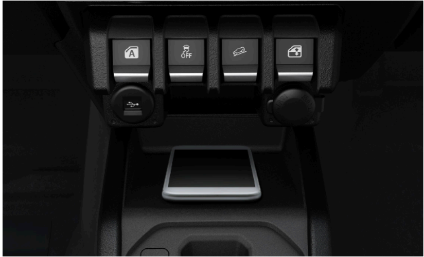
Wireless charger | شاحن اللاسلكي