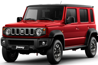
الأحمر الداكن والمعدني القوام مع الأسود المائل إلى أزرق اللامع Sizzling Red Metallic + Bluish Black Pearl (E5R)