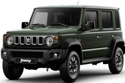
الأخضر الداكن Jungle Green (WA7)