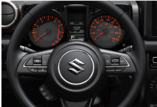
Steering wheel integrated switches | مفاتيح متكاملة لعجلة القيادة